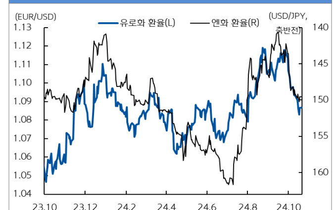
유로화와 엔화 환율 추이