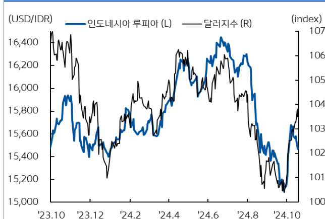
인도네시아 루피아 환율과 달러지수 추이