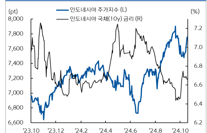
인도네시아 주가지수와 국채 금리추이