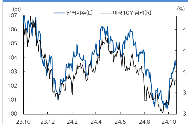
미국 국채 금리와 달러 지수 추이