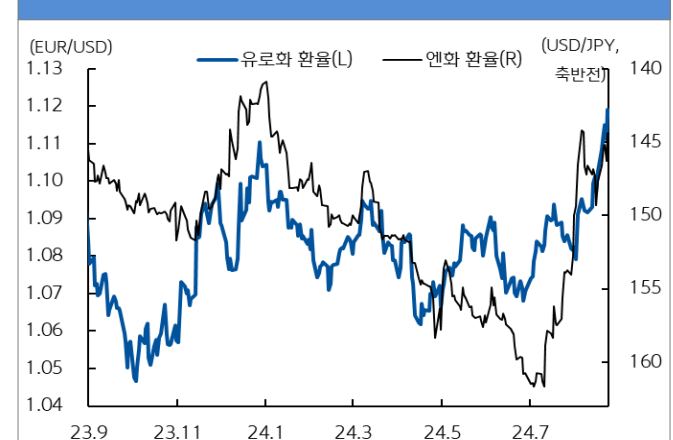
유로화와 엔화 환율 추이