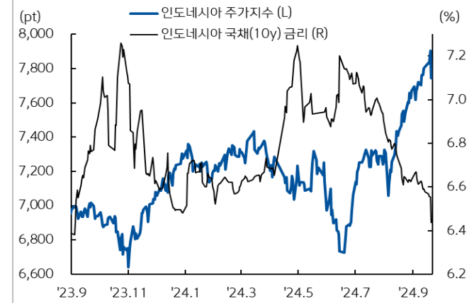
인도네시아 주가지수와 국채 금리추이