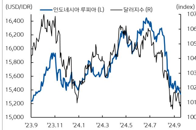
인도네시아 루피아 환율과 달러지수 추이