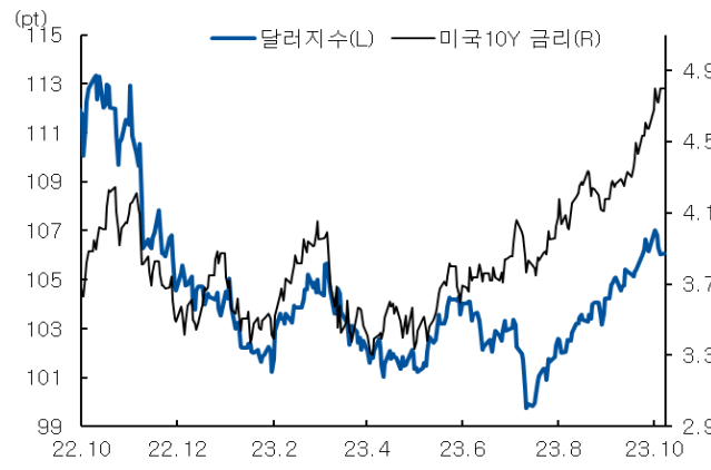
미국 국채 금리와 달러 지수 추이