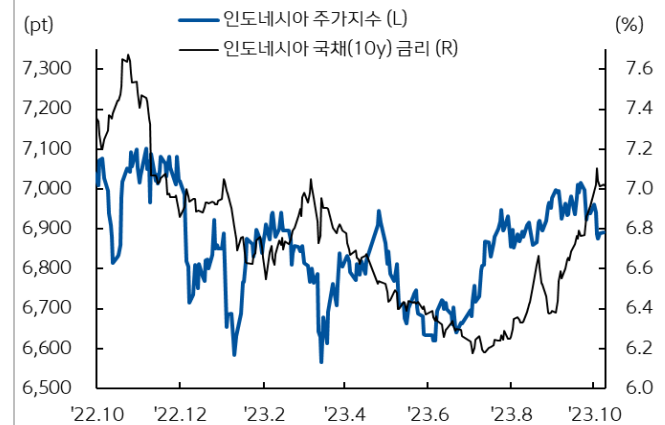
인도네시아 주가지수와 국채 금리 추이