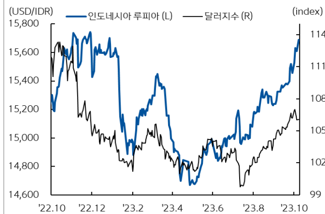
인도네시아 루피아 환율과 달러지수 추이