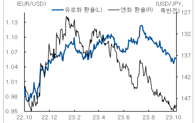
유로화와 엔화 환율 추이