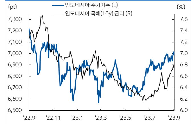
인도네시아 주가지수와 국채 금리추이