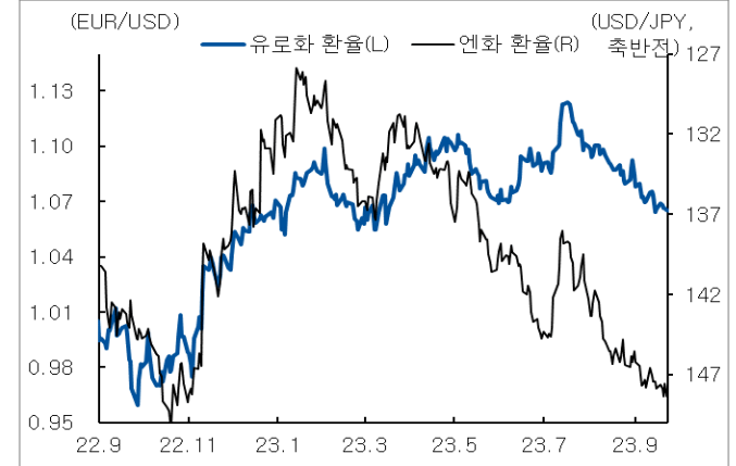
유로화와 엔화 환율 추이