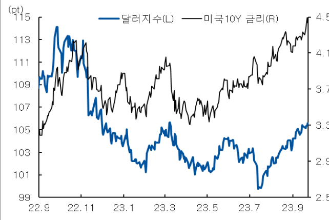
미국 국채 금리와 달러 지수 추이