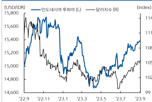
인도네시아 루피아 환율과 달러지수 추이