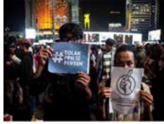
▲2024년 12월 31일 활동가들이 12% 부가세 인상 반대 피켓을 들고 있다

범위한 공황을 촉발시켰던 12월 16일의 정부 발표를 부분적으로 뒤집은 것이다. 당시 정부는 2025년 1월 1일부터 부가가치세를 전반적으로 12%로 인상하는 계획을 추진할 것이며, 정부 프로그램에서 판매되는 산업용 설탕, 밀가루 및 저렴한 식용유는 예외로 할 것이라고 밝혔다. 이번 인상은 조세 조화에 관한 법률 제7/2021호에 명시된 것으로, 2022년 4월 1일부터 부가가치세율을 10%에서 11%로 인상하고, 이후 2025년 1월 1일부터 12%로 인상하도록 규정되어 있다. 같은 발표에서 정부는 빈곤층 가구에 대한 쌀 지원과 최대 2,200볼트 암페어를 사용하는 전력망 연결 가구에 대한 전기 요금 50% 할인 등 소비자들의 타격을 완화하기 위한 다양한 인센티브도 제 공했다. 이러한 모든 조치는 2025