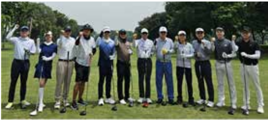
뿌르와까르타 KOGA 연말 모임 열려