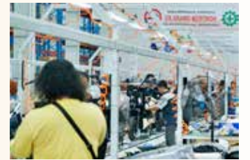
▲eMOA 전기오토바이 제조 현장

올해 들어 생산량과 신규 주문이 증가하면서 인도네시아 제조업체들 사이에서 낙관론이 확산되고 있다. 긍정적인 추세에도 불구하고 루피아화 약세로 인한 수입 자재 비용 상승으로 제품 가격을 인상해야 하는 등의 어려움이 지속되고 있다. S&P 글로벌(S&P Global)이 2월 2일에 발표한 인도네시아의 최신 제조업 구매관리자지수(PMI) 보고서는 11월의 49.6에서 12월에 51.2로 상승했다. 이 수치는 5개월 연속 50포인트를 밑돌다가 경기 확장과 위축을 구분하는 기준선인 50포인트 이상으로 다시 상승했다. 월간 PMI 보고서는 전국 약 400개 제조 기업의 구매 담당 임원을 대상으로 한 설문 조사를 바탕으로 해당 부문의 비즈니스 상황을 측정한다. S&P 글로벌 보고서에 따르면, 신규 수출 주문량이 거의 1년 만에 처음으로 증가하는 등 국내의 시장 수요가 강세를 보였다. 이에 따라 제조업체들은 11월과 12월에 생산량 증가와 신규 주문 요건을 충족하기 위해 구매 활동을 강화했다. 또한 12월에는 두 달 연속으로 투입 재고를 늘렸는데, 이는 향후 몇 달 동안의 생산량과 신규 주문에 대한 긍정적인 전망을 반영하여 재고를 쌓아두기 위한 것이다. 인도네시아는 올해 3월에 라마단과 이돌피트리 금식월을 맞는데, 이 기간은 일반적으로 국내 수요가 최고조에 달하는 시기다. S&P 글로벌 마켓 인텔리전스