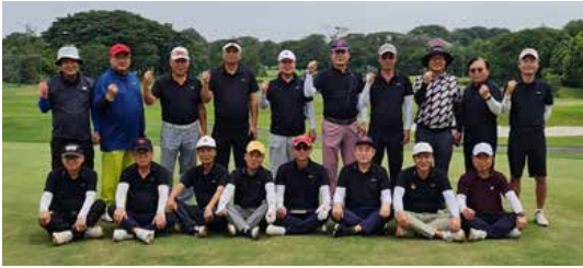
땅그랑 KOGA 연말모임 및 골프대회 열려