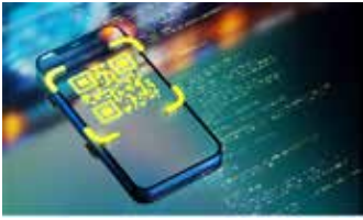
▲대한상의가 'EU 디지털제품여권 동향 및 GS1 국제표준 기반 대응 가이드라인' 을 발표했다.

2027년부터 섬유 등 주요 산업 분야에 EU 디지털제품여권(이하 DPP) 제도 시행이 순차적으로 의무화되는 가운데, EU에 제품을 수출하는 기업들의 선제적 대응이 필요하다는 주장이 제기됐다.