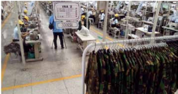
▲중부 자바 수라카르타에 있는 스리텍스 공장

인도네시아 정부는 지난 18일, 파산을 피하기 위한 회사의 항소를 대법원이 기각했음에도 불구하고 상장 섬유회사 스리 레제키 이스만(PT Sri Rejeki Isman, Sritex)이 계속 운영되어야 한다고 주장했다. 대법원은 지난 10월 23일 이 회사의 파산을 선언한 스마랑 상업법원의 판결을 지지해 자동으로 유지했다. 19일, 정부는 스리텍스의 채권자 중 하나인 국영은행에 직원들을 해고할 필요가 없도록 회사를 살리기 위해 협력할 것을 촉구했다. 경제조정부 아이르랑가 하르 다르포 장관은 19일, 재정적 문제에도 불구하고 운영을 계속해야 한다는 우려 속에서 회사를 안심시키기 위해 스리텍스 경영진과 이야기를 나눴으며, 최대 채권자 중 하나인 국영 대출기관 BNI를 포함한 모든 채권자들은 일자리를 보존하기 위해 정부와 협력하여 다른 채권자들을 이끌어야 한다고 말했다. 올해 3분기 기준 회사의 재무 보고서에 따르면, 스리텍스는 16억 달러의 부채를 기록했는데, 이는 자산 5억 9,400만 달러를 훨씬 초과하는 금액이다. 이 회사는 여전히 8억 3,680만 달러의 장기 은행 대