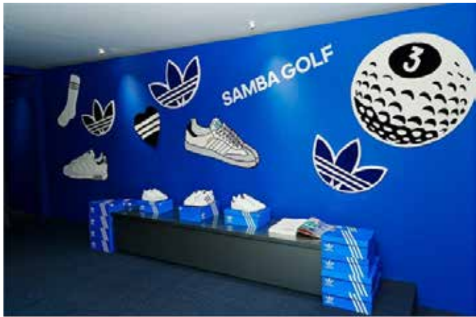
▲아디다스의 주가가 올 들어 30% 상승했다.

15일(현지시각) 발표된 성명에 따르면, 독일 스포츠웨어 회사인 아디다스는 올 영업이익이 약 12억 유로(약 1조7751억 원)에 이를 것으로 예상하고 있다. 이는 이전 예측치인 약 10억 유