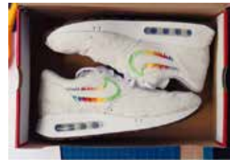
▲ 신형 아이패드 프로에서 영감을 받은 나이키 에어 맥스 1 86

팀 쿡과 나이키의 인연은 2005년으로 거슬러간다. 팀 쿡이 스티브 잡스의 오른팔이자 최고운영책임자(COO)를 지냈던 당시, 애플과 나이키는 운동화 바닥에 만보계 센서를 장착하여 사용자의 피트니스 데이터를 아이팟(iPod)으로 전송하기 위한 파트너십