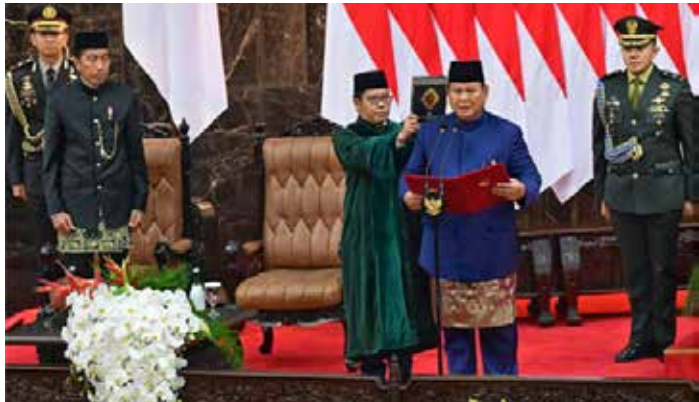
▲인도네시아 프라보워 수비안도 대통령-기브란 라카부밍 라카 부통령 취임식

인도네시아 프라보워 수비안도가 10월 20일 제8대 대통령에 취임했다. 기브란 라카부밍 라카 부통령과 함께 앞으로 2024년-2029년 5년간 인도네시아를 맡는다. 자카르타 소재 의회에서 열린 취임식에서 프라보워 대통령은 취임선서에서 인도네시아 공화국 대통령의 직무를 최선을 다하고 공정하게 수행할 것이며, 헌법을 수호하며 모든 법률과 규정을 올바르게 수행하고 국민과 국가에 헌신할 것을 맹세했다. 프라보워는 취임사에서 “물고기가 상하면 머리부터 썩기 시작한다”는 속담을 예들리며 모든 정부 관료들은 가능한 한 깨끗한 정부 리더십을 수행하기 위해 부패 척결