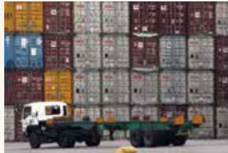
▲북부자카르타 탄중 뿌리옥(Tanjung Priok) 항구

마까사르 신항만 개발 관련해서는 네덜란드 대사관 및 네덜란드 기업인들과 공동 협력구축