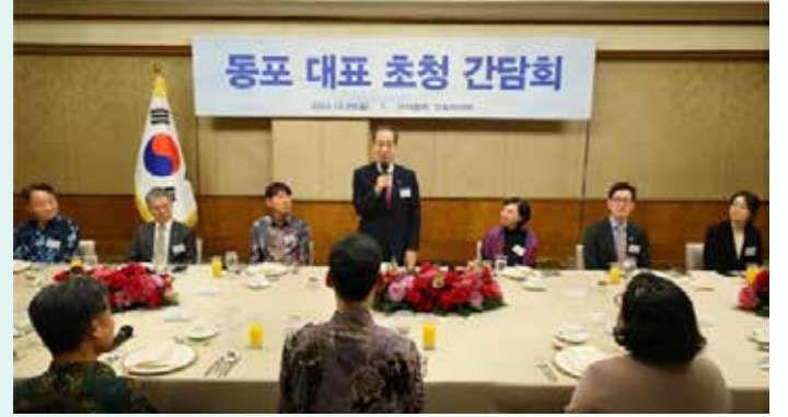
▲재인도네시아 동포들에게 격려사 하는 한덕수 국무총리

한덕수 국무총리는 20일 “지금처럼 전 세계가 한국과 협력하고 싶어 하는 때가 없었다”고 말했다. 한 총리는 프라보워 수비안토 인도네시아 대통령 취임식 참석차 자카르타 방문 중 동포 대표 초청 간담회를 열어 이같이 말한 뒤 “정부는 이런 상황을 좋은 기회로 보고 정부와 여기 계시는 동포 여러분과 힘 합쳐가면서 각국과 관계가 더 좋아지도록 만들겠다”고 말했다. 한 총리는 특히 인도네시아가 매우 크고 잠재력이 무궁무진한 나라로 전 세계가 인정하고 있다며 “정부와 동포 한분 한분 힘 합쳐 대한민국과 인도네시아 관계가 더 좋아지고 경제와 문화 등 모든 분야에서 협력이 되도록 만들겠다”고 약속했다. 이어 인도네시아 동포 사회가 100년이 넘는 긴 역사와 전통의 공동체인 것을 알고 있다며 “앞으로도 양국 관계를 위해 더 적극적으로 활동해 달라”고 부탁했다. 한 총리는 현 정부가 동포들을 위한 재외동포청을 신설했고, 인도네시아 대사 출신의 이상덕 재외동포청장이 열심히 활동하고 있다며 “우리 정부가 동포분들을 위해 할 수 있는 일은