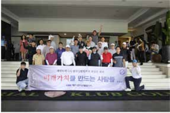
미래가치를 만드는 사람들 ... KOFA 2024년 하반기 회장단회의 열렸다