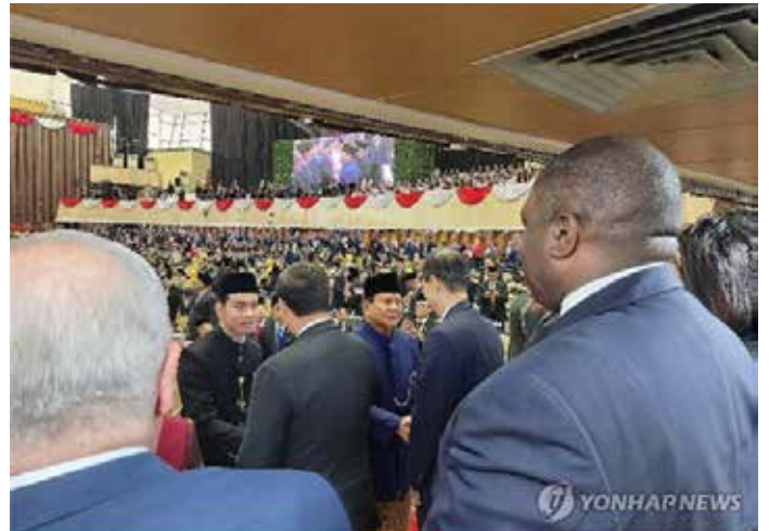
▲한덕수 국무총리가 20일 인도네시아 자카르타 국회의사당에서 열린 프라보워 수비안토 제8대 인도네시아 대통령 취임식에 우리 정부 대표로 참석하고 있다. 2024.10.20

한덕수 국무총리는 20일 프라보워 수비안토 인도네시아 신임 대통령과 만나 인도네시아 새 정부와 협력 의지를 전달했다. 프라보워 대통령 취임식 참석차 자카르타를 찾은 한 총리는 이날 프라보워 대통령과 면담하면서 축하 인사와 윤석열 대통령의 친서를 전달했다. 또 ‘특별 전략적 동반자’인 인도네시아와 관계 발전 방안을 의논했다. 이 자리에서 프라보워 대통령은 한 총리가 경축 사절로 취임식에 직접 참석한 데 감사를 표한 뒤 양국이 모든 분야에서 협력을 증진하고 호혜적 결실을 거둘 수 있도록 함께 노력해 나가자고 밝혔다. 이어 인도네시아 경제발전을 위해 한국과 협력 확대를 희망한다고 전했다. 한 총리도 경제발전 경험과 노하우를 갖춘 한국이 최적의 파트너라며 적극 협력해 나가