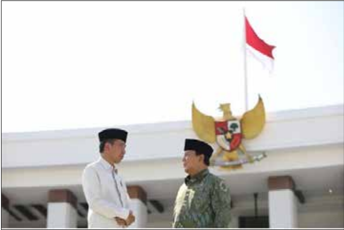
▲조코위 전 대통령과 신임 프라보워 대통령

향후 5년간 인도네시아를 이끌 프라보워 수비안토 인도네시아 대통령이 20일 인도네시아 제8대 대통령에 취임했다. 프라보워 대통령은 이날 인도네시아 자카르타에 있는 의회에서 열린 취임식에서 선서한 뒤 자신을 뽑지 않은 유권자를 포함해 모든 인도네시아 국민을 위한 대통령이 되겠다고 말했다. 프라보워 대통령은 인도네시아에 부정부패 등 해결해야 할 문제가 있다며 “우리 국민과 아이들이 영양실조에 걸렸다는 사실을 알고 있느냐. 많은 국민이 좋은 일자리를 갖지 못하고 있고, 많은 학교가 방치돼 있다”고 지적했다. 이어 그는 “우리는 이 모든 것을 바라보고, 이 모든 문제를 해결할 용기를 가져야 한다”며 자신이 이에 앞장서겠다고 강조했다. 프라보워 대통령은 이번 대선에서 모든 아동과 임산부 등 8천300만명에게 무상급식을 제공하겠다고 약속했고, 내년