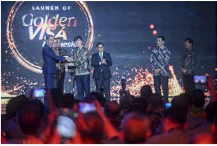
▲조코 위도도 대통령(왼쪽)이 2024년 7월 25일 자카르타에서 열린 골든비자 출범 행사에서 인도네시아 축구 국가대표팀 감독 신태용(왼쪽에서 네 번째)에게 상징적으로 "골든 비자"를 건네주고 있다.

인도네시아 이민국 실미 까림 국장은 지난 7월에 특별 허가가 시작된 이후 거의 500명이 이른바 '골든비자'를 신청했다고 밝혔다.