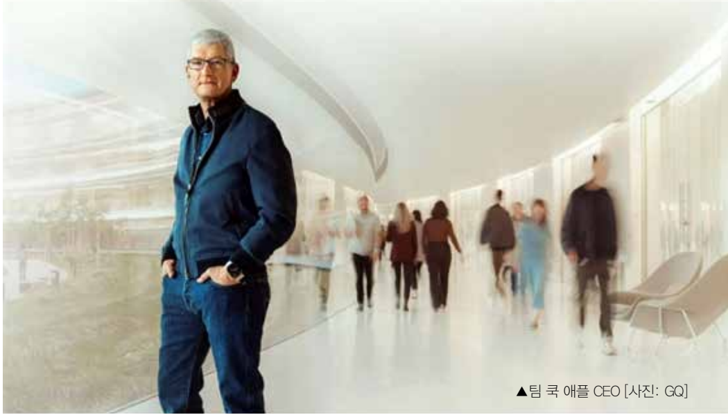
▲ 팀 쿡 애플 CEO

지난 2005년부터 나이키 이사회에서 보상위원회 의장 및 공공경영 위원회 의원으로 활동했던 팀 쿡 애플 최고경영