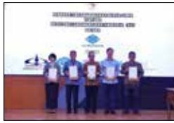
노동부 전략적 파트너 임명 (2024.5)