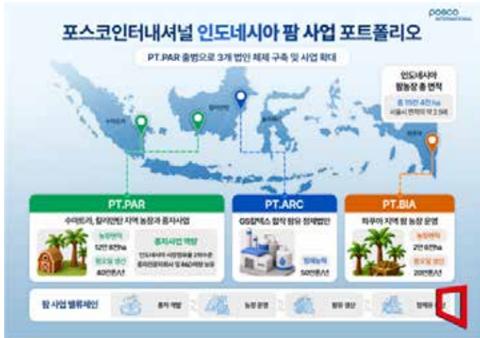
▲포스코인터내셔널 인도네시아 팜 사업 포트폴리오, 포스코인터

포스코인터내셔널은 지난해 인수한 인도네시아 팜 기업 삼푸르나 아그로에 대한 통합 작업을 마무리하고 새 사명을 선포했다. 농장 운영 중심 사업에 종자 개발 역량까지 사