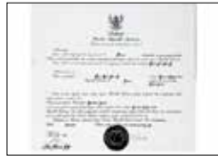
수하르토 대통령 BIC 주부산 인도네시아 명예영사관 지정 (1993~2007)