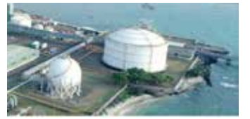
▲롯데케미칼의 인도네시아 자회사인 롯데케미칼 타이탄(PT Lotte Chemical Titan Tbk, FPNI) 공장 전경.

롯데케미칼의 인도네시아 자회사인 롯데케미칼 타이탄(PT Lotte Chemical Titan Tbk, FPNI)이 인도네시아 증권거래소(BEI)의 새로운 규정에 대응하기 위한 방안을 검토하고 있다. 최근 BEI는 최소 유통주식 비율 규정을 손봐 시가 총액 5조 루피아 미만인 기업은 15% 이상 유지하도록 했다. FPNI는 충족 기한인 오는 2029년까지 규정을 충족시킬 것인지 비상장회사로 전환할 것인지 등 방안을 검토할 예정이다.