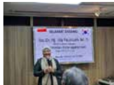
노동부 장관 BIC 방문 (2022.12)

인도네시아 노동부 전략적 파트너 기관, 한국 기업들의 든든한 산업보건 환경 지킴이!