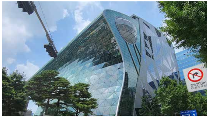
▲서울시 : 외국인신문

등의 ODA 재원을 활용한 본사업(후속사업) 연계 방안을 적극 검토·지원하고 있다. 올해는 기존의 하드인프라 개발 컨설팅 트랙과 더불어, 시민체감도 높은 문화·건강 등 새로운 ODA 영역으로 부상하고 있는 '소프트인프라 기반'의 서비스 사업을 해외로 확산하고자 '프로젝트 트랙'을 신설하였다. 서울시는 지난 2월 사업공모 및 주한대사관 관계자 설명회 → 서울시 친선우호도시·국제기구 대상 홍보 후 → 3~4월에 걸쳐 외부 ODA 전문가들로 구성된 '지원대상 선정위원회'를 개최했다. 그 결과 총 3개의 '소프트인프라 프로젝트 사업'과 1개의 '하드인프라 개발컨설팅 사업'을 추진한 도시를 선정하였다. 특히, 서울시민의 만족도가 높은 정책을 해외로 확산하고자 '2025 서울 10대 뉴스' 선정 정책을 기반으로 한 해외도시의 신청서를 접수한 결과, 1위는 산살바도르 센터(엘살바도르)의 '야외도서관', 2위는 비슈케크(키르기스스탄)의 '서울체력장 도입', 3위는 반다아체(인도네시아)의 '야외도서관' 사업이다. 총 20개국 48개 도시에서 52개의 프로젝트 신청서를 제출하여 17:1의 경쟁률을 기록하였고, 이는 해외 도시들이 문화·레저·건강 등 시민의 일상생활에 밀접한 정책을 개발하고 서울의 선진 도시정책을 전수받으려는 수요가 크다는 것을 방