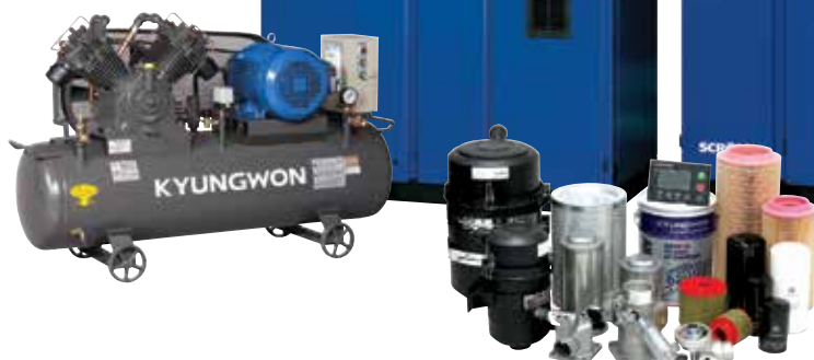
KYUNGWON COMPRESSOR GENUINE PARTS