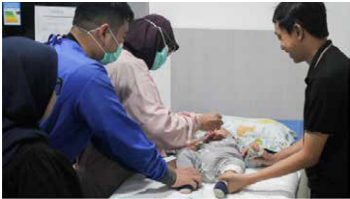
▲인도네시아 소아대상 무료 예방접종 모습

인도네시아 프라보워 수비안 대통령은 10일 자카르타글로브에 따르면, 프라보워 대통령은 10일 람