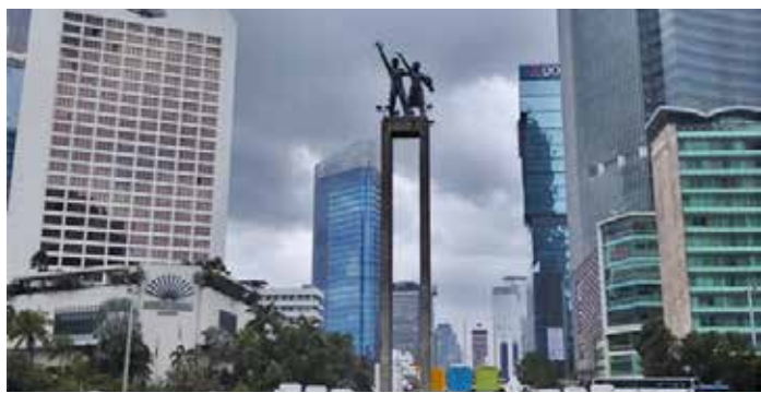
▲자카르타 호텔인도네시아 로터리(Bundaran HI) 환영 동상

인도네시아 정부가 중동 지역 긴장 고조를 계기로 외국인 투자 유치 확대를 기대하고 있다. 14일 자카르타포스트에 따르면, 투자및다운스트림부 로산 루슬라니 장관은 13일 국회 제12위원회(에너지·광물자원 담당) 청