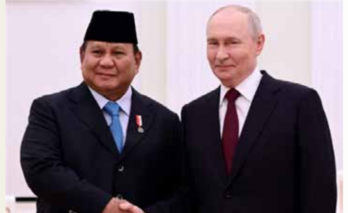
▲지난 4월 13일 정상회담 한 프라보워 인도네시아 대통령(왼쪽)과 푸틴 러시아 대통령

중동 전쟁이 장기화하면서 에너지 수급에 어려움을 겪는 인도네시아가 러시아로부터 원유 1억5천만 배럴을 공급받기로 했다고 24일 안타라통신이 보도했다.