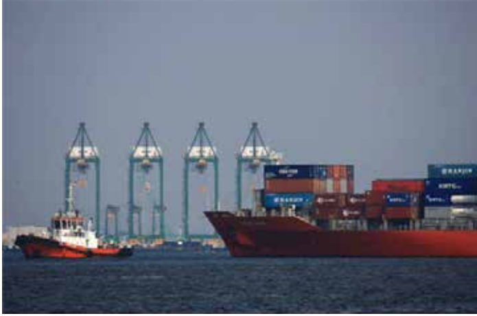
▲자카르타 땀중 뿌리옥항 자카르타 국제컨테이너터미널(JICT)

인도네시아 정부가 미국과 ‘상호무역협정 (ART·Agreement on Reciprocal Trade)’ 추진을 둘러싼 논란 속에서도 협상 정당성을 강조하고 나섰다. 부디 산토소 인도네시아 무역부 장관은 지난 22일 자카르타포스트와 인터뷰에서 “지금이 적기”라며 “인도네시아는 수십 년간 미국과 보다 포괄적인 무역 틀을 모색해왔다”고 말했다. 그는 보호무역주의가 확산되는 상황에서 ART가 “기회”라며, 양국 모두 수출 확대를 통해 상호 이익을 얻는 것이 핵심이라고 설명했다. 인도네시아와 미국은 1996년 무역투자기본협정(TIFA)을 체결했지만, 약 30년간 포괄적 협정 체결에는 실패했다. 반면 ART는 비교적 빠르게 타결됐다.