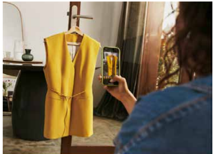
▲중고패션에 대한 수요가 증가하며 플랫폼들이 시장 및 카테고리 확장에 나서고 있다.

2023년 매출 5억 9630만 유로와 비교하면 약 84.5% 증가한 수치다. 외형 성장 속도와는 달리 순이익은 6200만 유로로 감소했다. 이는 수요 둔화라기보다 구조적 투자 확대 영향으로 해석된다. 빈티드는 물류 네트워크 '빈티드 고' 구축과 결제 서비스 '빈티드페이' 도입, 지역 확장에 자원을 집중하고 있다. 실제로 유럽 전역에 50만개 이상의 물류 거점을 확보했으며, 결제 라이선스 확보를 통해 금융 기능까지 내재화하고 있다. 이는 중고패션플랫폼이 단순 거래 중개를 넘어 유통 인프라로 전환되고 있음을 보여준다. 카테고리 확장 역시 중요한 변화다. 빈티드는 기존 의류