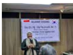
노동부 장관 BIC 방문 (2022.12)

인도네시아 노동부 전략적 파트너 기관, 한국 기업들의 든든한 산업보건 환경 지킴이!