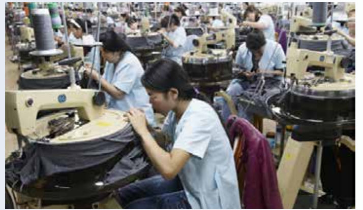
▲AAFA가 고온 대응 노동자 보호 가이드를 발표했다.

미국 의류 및 신발 협회(AAFA)가 고온 환경에서의 노동자 보호를 위한 교육 가이드를 발표했다. 폭염 및 고온 조건에서 발생할 수 있는 건강 위험을 관리하고, 기업이 이를 체계적으로 대응할 수 있도록 지원하는 것이 주요 목적이다. 국제노동기구(ILO)에 따르면 작업시설의 과도한 고열은 약 1만 8970명의 사망자와 2287만 건의 산업재해와 관련이 있으며, 이를 완화할 전략의 필요성이 점점 더 시급해지고 있다. 섬유·의류 산업은 노동집약적 구조로 인해 작업 환경 변화가 생산 차질 및 비용 증가로 이어질 가능성이 높다. 이에 따라 기업들은 기존의 품질·납기 중심 관리에서 작업환경 및 노동자 안전까지 포함하는 통합적 리스크