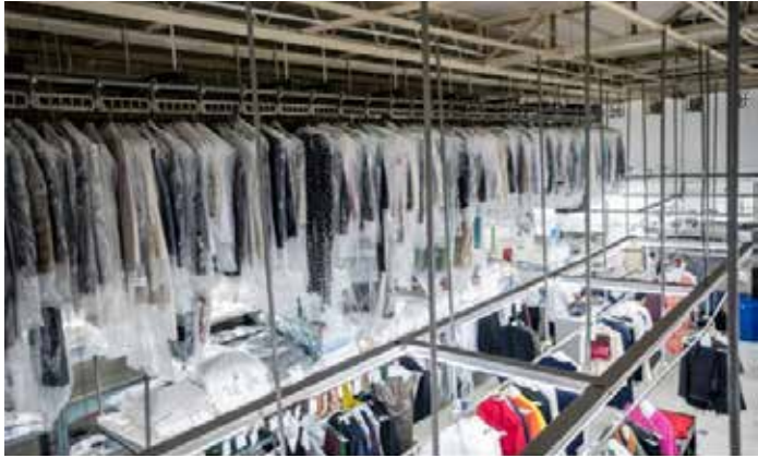
▲3월 의류 수출 늘고 수입은 줄었다.

3월 한국 전체 수출은 866억 달러로 전년 동월 대비 49.2% 증가했다. 무역수지는 262억 달러 흑자를 기록했다. 경공업 수출 확대 국면에서 섬유·의류 및 화장품 제품군도 증가세를 보였으나, 반도체 중심의 구조적 편중은 더욱 강화됐다.