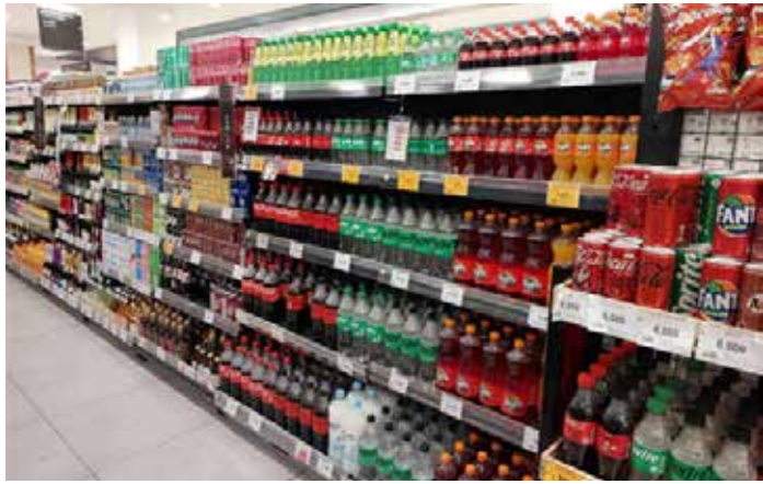
▲수퍼마켓의 음료수 판매대

인도네시아 산업부는 글로벌 정세로 플라스틱 가격이 급등하는 가운데, 특히 식음료 산업의 경쟁력 강화를 위해 포장재 다변화와 대체 소재 개발을 추진하고 있다.