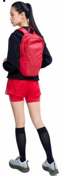
▲프로-스펙스가 러닝 시 번거로울 수 있는 소지품 수납을 해결해 주는 경량 러닝 액세서리를 출시했다. 사진은 프로-스펙스 모델이 러닝 경량 백팩을 메고 있는 모습.