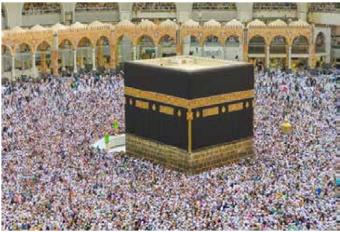
▲사우디아라비아 메카의 카바신전.

중동 지역의 지정학적 불안이 고조되는 가운데, 인도네시아 정부가 올해 하지(Hajj) 순례를 계획대로 진행한다고 밝혔다. 자카르타포스트 4월 18일 보도에 따르면, 인도네시아 종교부 산하 하지 관리국은 사우디아라비아 정부의 공식적인 입국 금지 조치가 없는 한, 안전 지침을 강화하여 순례를 차질 없이 수행할 방침이다. 올해 하지 순례는 5월 24일부터 29일까지 진행될 예정이며, 순례단의 첫 번째 그룹은 4월 22일 사우디아라비아를 향해 출국한다. ◆ 22만 1천 명의 순례 대장정 이번에 배정된 인도네시아 하지 순례객은 총 22만 1천 명이다. 순례객 중 가장 큰 비중을 차지하는 그룹은 주부(약 5만 2천