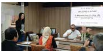
노동부 차관 BIC 방문 (2023.12)