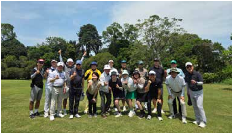
재인도네시아 한국봉제협회 2026년 상반기 코가 상임사 및 회장단 모임열려