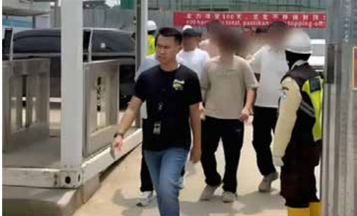
▲2026년 4월 8일, 서부자바 브까시 짜까랑 델타마스에 위치한 그린랜드 국제산업 센터 건설 현장에서 '위라 와스빠다 작전' 중 적발된 외국인 노동자 78명을 브까시 이민국 직원(왼쪽)이 안내하고 있다.

서부자바 브까시 이민국은 불법 취업 혐의로 외국인 78명을 조사 중이라고 17일 자카르타포스트가 전했다. 서부자바 이민국에 따르면, 이들은 4월 7일부터 11일까지 전국적으로 실시된 '위라 와스빠다(Wira Waspada)' 단속 작전에서 적발됐다. 브까시 델타마스 지역의 건설 현장에서 근무하던 이들로, 단속 당시 여권이나 체류 허가증 등 관련 서류를 제시하지 못한 것으로 알려졌다. 적발된 외국인은 중국인 76명, 말레이시아인 1명, 베트남인 1명이다. 이들은 현재 브까시 이민국으로 이송돼 신원 확인과 함께 체류 자격과 실제 활동의 일치 여부에 대한 조사를 받고 있다. 초기 조사 결과 중국인 7명은 임시체류허가증을 소지하고 있었고, 나머지 중국인 69명과 베트남인은 방문체류허가증을 소지했고, 말레이시아인은 관광 목적의 무비자 체류허가증을 소지한 것으로 파악됐다.