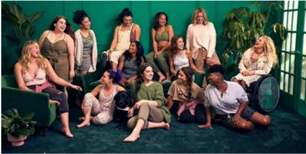
▲AI로 제작한 콘텐츠에 대한 소비자 신뢰도가 하락했다.

패션산업 전반에 빠르게 확산 중인 인공지능이 구매 결정에서는 오히려 부정적인 영향을 미친다는 연구결과가 나왔다. 소비자들은 AI 기반 추천과 탐색 기능의 높은 편의성을 인정하면서도, 소셜 미디어에서 접하는 AI 생성 콘텐츠에 대해서는 과반 이상이 뚜렷한 불신을 드러냈다. 리테일 테크놀로지 쇼(Retail Technology Show, RTS)의 최근 조사에 따르면, 응답자 중 53%가 AI 생성 소셜 콘텐츠를 신뢰하지 않는다고 답했다. 이 수치는 디지털 친화도가 높은 Z세대에서 58%로 더 높게 나타났다. 또한 51%는 AI 콘텐츠가 브랜드 신뢰를 저하시킬 수 있다고 인식했으며, 43%는 AI 확산 이후 오히려 ‘인간 중심 콘텐츠’의 중요성이 커졌다고 응답했다. 이 역시 Z세대에서는 62%까지 상승했다. 탐색과 비교 단계에서는 AI의 영향력이 빠르게 확대되고 있다. 어도비(Adobe) 조사에 따르면 약 25%의 소비자가 AI를 주요 쇼핑 정보 탐색 수단으로 활용하고 있으며, AI 사용자 중 42%는 제품 추천과 조언을 의사결정의 주요