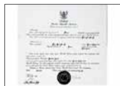
수하르토 대통령 BIC 주부산 인도네시아 명예영사관 지정 (1993~2007)