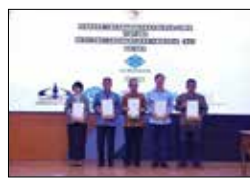
노동부 전략적 파트너 임명 (2024.5)