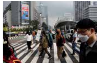
▲자카르타 수디르만 도로를 지나는 시민들

17일 자카르타포스트에 따르면, 뿌르바야 장관은 면담에서 국내 총생산(GDP) 대비 재정적자를 3% 이하로 유지할 수 있는지 여부가 주요 논의였다고 설명했다. 해당 기준은 1997~1998년 아시아 외환위기 이후 법으로 도입된 재정 건전성 기준치다.