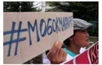
▲여성 가사도우미(PRT), 여성운동위원회(KAP) 등 여성들이 인력주부 청사에서 여성노동자에 대한 폭력과 차별을 해결하는 정부 차원의 정책을 떠달라고 요구하는 시위를 벌이고 있다.2015.3

수프미 다스코 아흐마드 하원 부의장은 사회보장 범위와 연금 제도 도입 가능성 등을 포함한 세부 시행령을 정부가 조속히 마련할 예정이라고 밝혔다. 특히 연금 보장에 국가 재정을 일부 투입하는 방안도 제한할 계획이라고 덧붙였다.