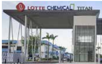
▲롯데케미칼타이탄은 인도네시아 계열사인 PT 롯데케미칼 인도네시아(LC)에 대규모 나프타 물량을 매각하기로 결정했다.

롯데케미칼타이탄은 약 1억 400만 링깃(약 310억 원) 상당의 나프타를 LC에 매각한다. 호르무즈 해협은 전 세계 나프타 유통량의 핵심 통로다. 전쟁으로 인해 이 경로가 봉쇄되거나 운송료가 폭등하자, 상대적으로 재고 여유가 있는 말레이시아 법인에서 인도네시아 법인으로 물량을 돌려 생산 차질을 사전에 차단한 것이다.