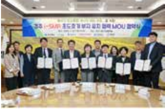
▲경주시는 23일 시청 대외협력실에서 인도네시아 상수도 공기업 '페룸다 티르타 알 반타니 카부파텐 세랑' 과 상하수도 분야 협력을 위한 양해각서(MOU)를 체결했다. 이번 협약을 계기로 경주시는 자체 물정화 기술의 인도네시아 진출을 본격 확대할 계획이다.

상수도 공기업과 MOU 체결... 급속수처리 · 하수고도처리 기술 기반 시범사업 · ODA 연계 확대 추진