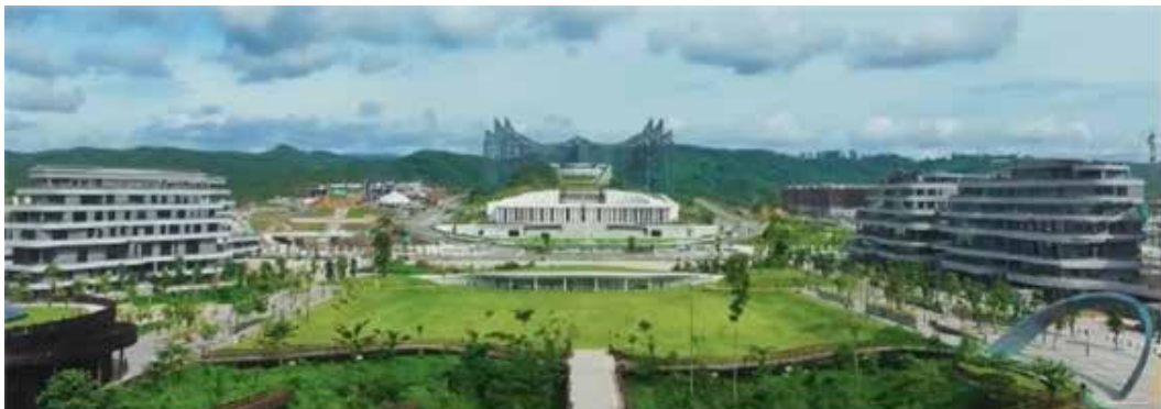
▲ 신수도 누산타라 전경

인도네시아 정부가 신수도 누산타라(Nusantara)에 입법·사법 복합단지를 오는 2028년 초까지 완공할 계획이라며, 최근 제기된 사업 지속성 우려를 불식시켰다. 신수도 건설은 조코 위도도 전 대통령 시절 시작된 국가 핵심 프로젝트다. 후임인 프라보워 수비안토 대통령 역시 사업을 이어가며 누산타라를 ‘정치 수도’로 기능하도록