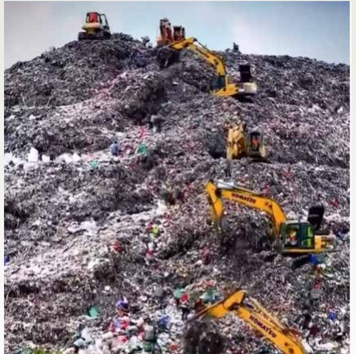
▲반파르거방 쓰레기 매립장

이번 사업에서 중국 기업 비중이 높은 것은 최근 인도네시아 주요 인프라 사업에서 나타나는 흐름과도 맞닿아 있다. 대표적으로 73억 달러 규모의 자카르타-반둥 고속철 사업 역시 중국이 참여한 프로젝트다.