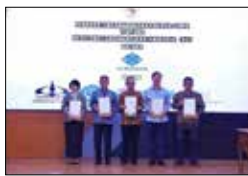
노동부 전략적 파트너 임명 (2024.5)