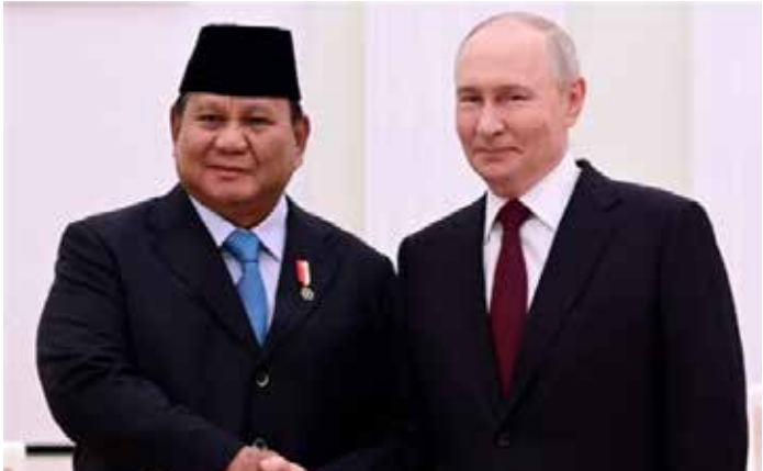
▲지난 4월 13일 정상회담 한 프라보워 인도네시아 대통령(왼쪽)과 푸틴 러시아 대통령 [인도네시아 대통령실 홈페이지 캡처]

중동 전쟁이 장기화하면서 에너지 수급에 어려움을 겪는 인도네시아가 러시아로부터 원유 1억5천만 배럴을 공급받기로 했다고 24일 안타라통신이 보도했다. 프라보워 대통령의 친동생인 하심 조요하디쿠수모 에너지·환경 특사는 전날 열린 '2026 경제 브리핑' 행사에서 이같이 밝혔다. 인도네시아가 이르면 이달부터 러시아산 원유 수입을 시작할 전망이다. 중동 전쟁과 지정학적 불확실성이 이어지는 가운데 에너지 안보를 강화하기 위한 조치로 해석된다. 앞서 바흐릴 라하달리아 에너지 광물장관은 17일 자카르타에서 "이번 계획은 프라보워 수비안토 대통령의 지시에 따른 것"이라며 "지난 13일 프라보워 대통령과 블라디미르 푸틴 러시아 대통령의 회담 이후 양국은 에너지 협력을 강화하기로 합의했고, 러시아산 원유 구매를 포함한 지원을 받기로 했다"고 말했다. 이번 조치는 글로벌 공급망 불안 속에서 원유 조달선을 다변화하고 특정 국가 의존도를 줄