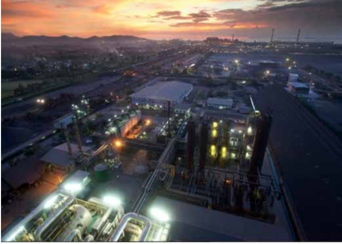
▲포스코는 2029년 완공을 목표로 하는 '크라카타우 포스코(KRAKATAU POSCO)' 2단계 확장 프로젝트를 위해 인도네시아 정부와 구체적인 투자 논의에 착수했다.

2029년까지 2단계 프로젝트 추진... 인도네시아 국부펀드 '다난타라' 와 합작 제안 자동차용 고부가가치 강판 현지 생산... 3만 6천 개 일자리 창출 등 경제 효과 기대