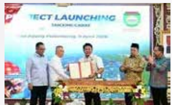
▲[사진=인도네시아 교통부 제공]고, 2개 지구를 신파렘 지원 용지로 해당 성에 양도하기로 합의함에 따라 신파렘방향 건설을 위한 준비가 갖춰졌다. 두디 교통부 장관은 남수마트라주가 석탄, 팜유, 고무 등 풍부한 천연자원을 보유한 국가 경제의 핵심 거점인 만큼, 이번 프로젝트가 인도네시아의

인도네시아 교통부는 9일 남수마트라주 정부와 함께 실파렘방향 건설 프로젝트를 공식으로 개시했다. 해당 주의 주요 항구인 팔렘방시 붐바루항은 부지와 수심 부족으로 능력 확장이나 대형선 기항에 적합하지 않을 뿐만 아니라, 대형 차량의 출입이 도로 혼잡과 교통사고 위험을 높이고 있어 반유아신군 판중 차량에 새로운 물류 거점을 건설한다. 남수마트라주 정부가 면적 59.5헥타르 부지의 토지관리권(HPL)을 교통부로 이관하