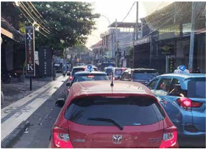
▲발리 꾸따 거리의 교통체증

인도네시아 발리에서 공항과 관광지 짱구(Canggu)를 연결하는 수상택시 도입이 추진되면서 이동 시간이 대폭 단축될 전망이다. 현재 약 1시간, 혼잡 시간대에는 최대 2시간까지 걸리던 이동 시간이 약