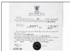
수하르토 대통령 BIC 주부산 인도네시아 명예영사관 지정 (1993~2007)