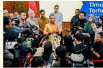
▲[사진=인도네시아 에너지광물자원부 제공]

인도네시아의 바흐릴 라하달리(Bahil Lahadalia) 에너지광물자원부 장관은 17일 러시아가 인도네시아 내 정유소와 석유제품 저장 시설 건설에 관심을 가지고 있다고 밝혔다.