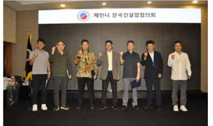
▲재인도네시아 한국건설업협의회 2026년 4월 신규회원사 기념촬영