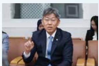
▲김이탁 국토부 1차관이 에디 바스코로 유도요노 인도네시아 국민평의회(MPR) 부의장과 면담을 진행하고 있다.

이번 면담은 1일 열린 한-인도네시아 정상회담 이후 후속 협력 차원에서 마련됐다. 인도네시아 측의 요청으로 성사된 자리로, 한국의 인프라 정