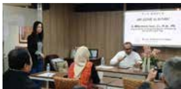
노동부 차관 BIC 방문 (2023.12)