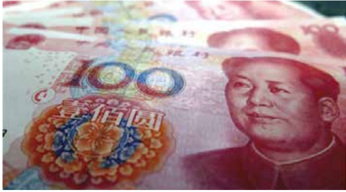
▲중국 위안화 지폐 이미지

뿌르바야 장관은 지난주 미국 워싱턴DC에서 열린 국제통화기금(IMF)·세계은행(WB) 춘계총회 기간중 중국 랴오안 재무장관과