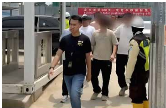
▲2026년 4월 8일, 서부자바 브카시 짜끼랑 델타마스에 위치한 그린랜드 국제산업센터 건설 현장에서 '위라 와스빠다 작전' 중 적발된 외국인 노동자 78명을 브카시 이민국 직원(왼쪽)이 안내하고 있다.

서부자바 브카시 이민국은 불법 취업 혐의로 외국인 78명을 조사 중이라고 17일 자카르타포스트가 전했다. 서부자바 이민국에 따르면, 이들은 4월 7일부터 11일까지 전국적으로 실시된 '위라 와스빠다(Wira Waspada)' 단속 작전에서 적발됐다. 브카시 델타마스 지역의 건설