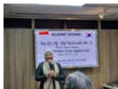
노동부 장관 BIC 방문 (2022.12)

인도네시아 노동부 전략적 파트너 기관, 한국 기업들의 든든한 산업보건 환경 지킴이!