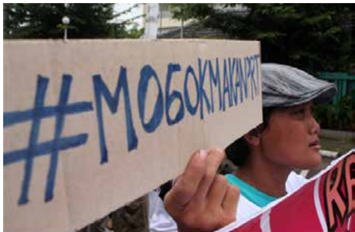
▲여성 가사도우미(PRT), 여성운동위원회(KAP) 등 여성들이 인력이주부 청사 앞에서 여성노동자에 대한 폭력과 차별을 해결하는 정부 차원의 정책을 펴달라고 요구하는 시위를 벌이고 있다. 2015.3

인도네시아 의회가 가사노동자를 보호하기 위한 법안을 통과시키며 20여 년에 걸친 입법 논의가 결실을 맺었다. 21일 자카르타글로브 등에 따르면, 인도네시아 하원(DPR)은 21일 본회의에서 가사노동자 보호법안(PPRT)을 통과시켰다. 이번 법안 처리는 여성 인권 신장을