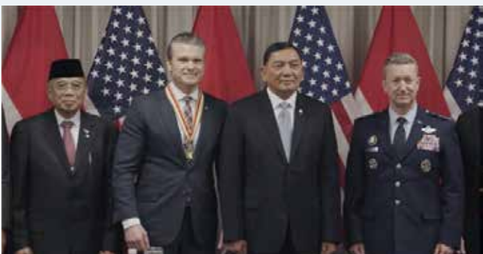
▲© 피트 헤그세스 미 전쟁부 장관 X 캡처