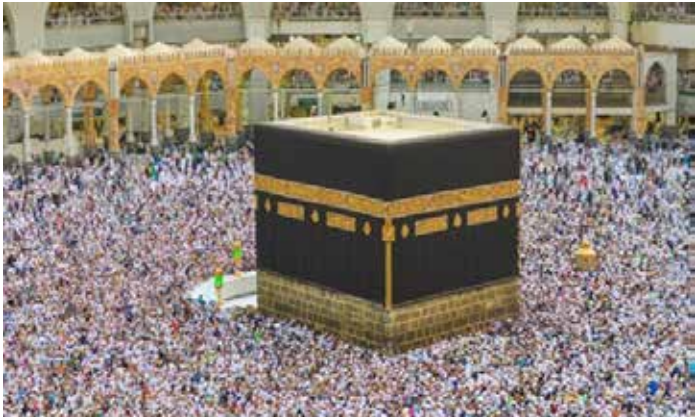
▲사우디아라비아 메카의 카바신전.

중동 지역의 지정학적 불안이 고조되는 가운데, 인도네시아 정부가 올해 하지(Hajj) 순례를 계획대로 진행한다고 밝혔다. 자카르타포스트 4월 18일 보도에 따르면, 인도네시아 종교부 산하 하지 관리국은 사우디아라비아 정부의 공식적인 입국 금지 조치가 없는 한, 안전 지침을 강화하여 순례를 차질 없이 수행할 방침이다. 올해 하지 순례는 5월 24일부터 29일까지 진행될 예정이며, 순례단의 첫 번째 그룹은 4월 22일 사우디아라비아를 향해 출국한다.