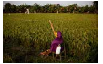
▲서부 자바 브카시 맘분 지역의 논

8월로 예상된다. 국가연구혁신청(BRIN)은 한층 강한 엘니뇨 가능성을 제기하며, 4~10월 사이 ‘고질라급’ 강도의 엘니뇨가 나타날 수 있다고 경고했다. 지역별로 미치는 영향이 다를 것으로 예상되는데, 북부 자바의 주요 쌀 생산지역에서는 극심한 가뭄, 수마뜨라와 칼리만탄에서는 기온 상승으로 인한 산불 위험 증가가 우려된다. 산림부에 따르면 2026년 1~3월 동안 최소 4만2천헥타르(축구장 약 6만 개 규모)의 산림 및 토지가 화재로 소실됐다. 주요 화재 발생 지역은 리아우, 서부와 중부 칼리만탄, 동누사 가라 등이다. 환경부 장관 라자 쥘리 안토니는 지난 6일, “올해 가뭄은 더 일찍 시작되고 더 오래 지속될 것으로 보인다”며 “올해 산불과 토지 화재는 지난해보다 더 큰 위협이 될 것”이라고 밝혔다. 이에 따라 산림부, 기상청, 국가재난방지청(BNPF)은 인공강우, 이탄지 채취, 공중 살수 등 대응 조치를 확대하고 있다.