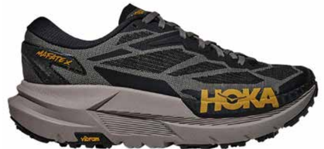
▲미국 데커스 아웃도어 산하 러닝화 브랜드 호카(Hoka)

시장에서는 중국 소비자들이 더 이상 ‘국산 vs 외산’ 구도로 제품을 선택하지 않는다는 점도 주목하고 있다. 기능성, 디자인, 브랜드 이미지 등 다양한 요소를 기준으로 선택이 이뤄지면서 경쟁 구도가 복합적으로 재편되고 있는 것이다.