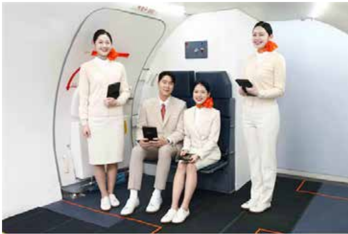
▲제주항공이 올해 2월부터 객실승무원 근무화로 도입한 '스니커즈(운동화)'를 객실승무원들이 신고 있다. 제주항공 측은 "장시간 기내 근무로 인해 발생할 수 있는 근골격계 부담을 줄이고, 비상상황 발생시 대응력을 강화하기 위한 것"이라고 밝혔다.

대한항공이 창립 이래 57년간 이어온 '승무원은 굽 있는 구두를 신는다'는 원칙을 바꾸는 것을 추진한다. 승무원들이 더 편안하게 활동할 수 있게 스니커즈(운동화)를 신을 수 있도록 제도를 개편하겠다는 것이다. 확정될 경우 연말 통합되는 아시아나항공에도 적용된다. 승무원 수만 총 1만명 안팎인 1·2위 대형 항공사의 '신발 변화'가 업계 전반의 분위기를 바꿀 수 있다는 전망도 나온다. 21일 항공업계에 따르면, 대한항공은 노사 협의를 통해 승무원들이 기내 업무 시 운동화나 기능성 신발을 신을 수 있도록 복