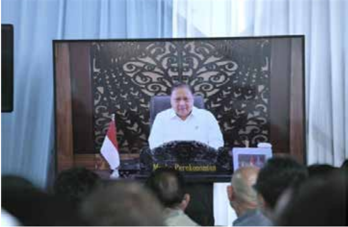
▲인도네시아 경제조정부 아이르랑가 하르따르프 장관

인도네시아가 화학 산업의 다운스트림 부문 개발을 가속화하기 위해 동부자바 그레식 특별경제구역(KEK Gresik)에 국내 최초의 멜라민 생산공장 건설에 착수했다. 9일 자카르타포스트에 따르면, 해당 프로젝트는 GEABH조인트테크놀로지(PT GEABH Joint Technology)가 추진하며, 내년 2분기 가동을 목표로 하고 있다. 아이르랑가 하르따르프 경제조정장관은 8일 “이번 개발은 석유화학 등 전략 산업에서 부가가치 산업을 강화하려는 정부의 의지를 반영한 것”이라고 밝혔다. 이어 “이 프로젝트는 그레식경제특구의 더 광범위한 개발 계획의 일부이며, 예상 투자액은 약 6억 달러(약 10조2천억 루피아) 규모”라고 설명했다. 이 시설은 연간 최대 12만 톤 규모의 멜라민을 생산할 수 있는