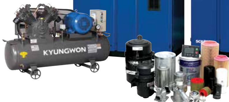
KYUNGWON COMPRESSOR GENUINE PARTS