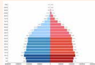
▲2026 인도네시아 인구구조 [위키피디아]

내무부 인구·시민등록국(Dukcapil)은 12일 ‘2025년 하반기 인구 데이터’를 통해 2025년 12월 31일 기준 총인구가 2억 8,831만5,899명에 달했다고 밝혔다. 이는 같은 해 6월 말 대비 약 160만 명 증가한 수치다. 전자 주민등록증(e-KTP) 보급도 확대됐다. 전체 인구 가운데 약 2억1,100만 명이 e-KTP를 보유하고 있으며, 이 중 97.47%에 해