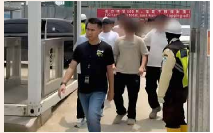
▲2026년 4월 8일, 서부자바 브카시 짜까랑 델타마스에 위치한 그린랜드 국제 산업센터 건설 현장에서 '위라 와스빠다 작전' 중 적발된 외국인 노동자 78명을 브카시 이민국 직원(왼쪽)이 안내하고 있다.

서부자바 브카시 이민국은 불법 취업 혐의로 외국인 78명을 조사 중이라고 17일 자카르타포스트가 전했다.