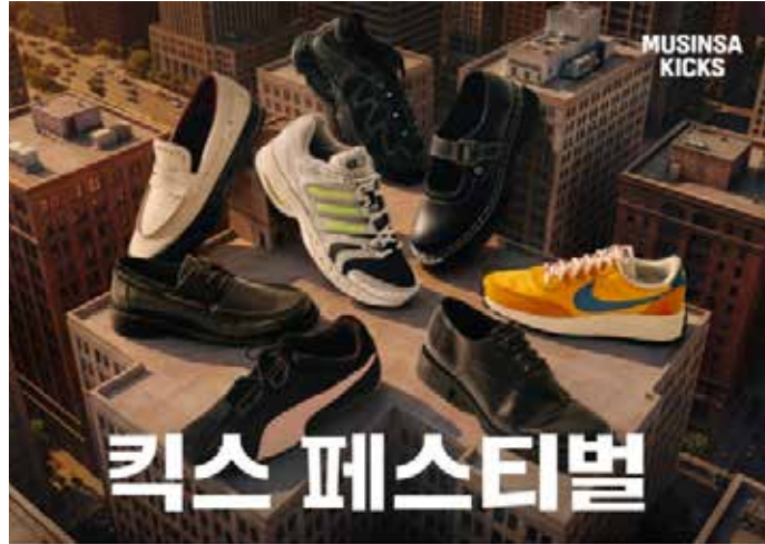
▲무신사가 운영하는 신발 전문관 ‘무신사 킥스(KICKS)’가 상반기 최대 규모의 ‘킥스 페스티벌’을 진행한다.

세 등 프리미엄 구두 및 캐주얼 슈즈 브랜드를 중심으로 ‘브랜드 릴레이’ 혜택을 제공한다. 행사 기간 무신사 단독 상품 및 신규 라인업을 발매한다. 품질 대란을 일으켰던 인기 상품의 재입고 물량도 대거 선보일 예정이다. 카테고리별 고도화된 큐레이션 서비스도 제공한다. 봄철 하객룩이나 출근룩에 매치하기 좋은 구두와 여름 시즌을 미리 준비하는 초여름 슈즈(Pre-Summer Shoes)부터 스니커즈, 러닝화 등 세분화된 테마별 ‘카테고리 데이’를 운영한다. 고객 혜택을 강화하기 위해 캠페인 기간 내 최대 70%의 할인율을 적용하며 25% 추가 할인 쿠폰을 제공한다.