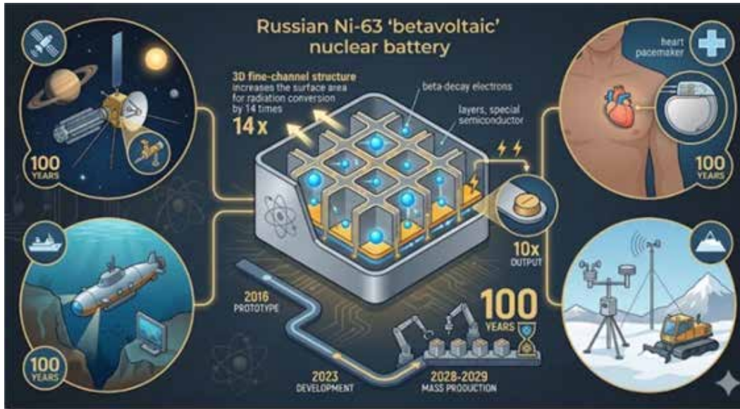
▲한 번 설치하면 충전이나 교체 없이 100년 동안 전력을 공급하는 ‘영구 전지’ 시대가 현실로 다가오고 있다.

‘니켈-63’의 마법... 삼성·LG 이차전지 10배 압도하는 밀도 이번 기술의 핵심은 방사성 동위원소인 ‘니켈-63’이 붕괴하며 방출하는 전자를 전기에너지로 변환하는 ‘베타-볼타(Betavoltaic)’ 방식이다. 이는 기존 리튬이온 배터리와는 차원이 다른 물리적 특성을 지닌다. 우선 독보적 수명과 내구성이 있다. 니켈-63의 반감기는 약 100년이다. 설치 시 최소 50년에서 최대 1세기 동안 별도 충전 없이 전력을 공급한다. 또한, 영하 100도(°C)에서 영상 150도(°C)에 이르는 극한