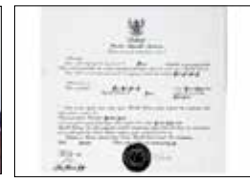
수하르토 대통령 BIC 주부산 인도네시아 명예영사관 지정 (1993~2007)