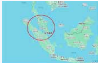
▲인도양과 태평양을 연결하는 세계 최대의 해상 물류 요충지 말라카해협

호르무즈 해협 통행료 법제화가 본격화되고 있는 가운데, 인도네시아 정부가 세계에서 가장 교통량이 많은 해상 교역로 가운데 하나인 말라카 해협(Strait of Malacca)을 통과하는 선박에 통행료를 부과하는 방안을 검토하고 있다고 23일 현지 언론이 보도했다.