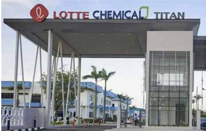
▲롯데케미칼타이탄은 인도네시아 계열사인 PT 롯데케미칼 인도네시아(LCI)에 대규모 나프타 물량을 매각하기로 결정했다.

PT 롯데케미칼 인도네시아에 310억 원 규모 나프타 매각... 중동 전쟁발 공급망 위기 관리