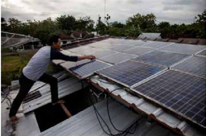
▲족자카르타 구농 가들의 한 주민 집에 설치된 태양광 패널

미국·이스라엘의 이란 공격으로 촉발된 에너지 시장 불안이 재생에너지 수요를 자극하고 있지만, 인도네시아의 전력망 한계로 태양광 확대는 제약을 받고 있다.