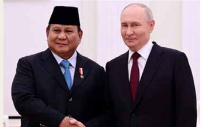
▲지난 4월 13일 정상회담 한 프라보워 인도네시아 대통령(왼쪽)과 푸틴 러시아 대통령

중동 전쟁이 장기화하면서 에너지 수급에 어려움을 겪는 인도네시아가 러시아로부터 원유 1억5천만 배럴을 공급받기로 했다고 24일 안타라통신이 보도했다. 프라보워 대통령의 친동생인 하심 조요하디쿠스모 에너지·환경 특사는 전날 열린 '2026 경제 브리핑' 행사에서 이같이 밝혔다. 인도네시아가 이르면 이달부터 러시아산 원유 수입을 시작할 전망이다. 중동 전쟁과 지정학적 불확실성이 이어지는 가운데 에너지 안보를 강화하기 위한 조치로 해석된다. 앞서 바흐릴 라하달리아 에너지 광물장관은 17일 자카르타에서 "이번 계획은 프라보워 수비안토 대통령의 지시에 따른 것"이라며 "지난 13일 프라보워 대통령과 블라디미르 푸틴 러시아 대통령의 회담 이후 양국은 에너지 협력을 강화하기로 합의했고, 러시아산 원유 구매를 포함한 지원을 받기로 했다"고 말했다. 이번 조치는 글로벌 공급망 불안 속에서 원유 조달선을 다변화하고 특정 국가 의존도를 줄