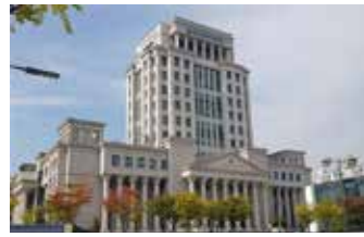
▲한국외국어대학교 본관

일(목)까지이다. 입학문의는 국제지역대학원 사무1팀 전화 (02) 2173-2448 또는 2449, 웹사이트 (http://gsias.hufs.ac.kr)를 방문하면 자세한 입학정보를 확인할 수 있다. 국제지역대학원은 세계 각 지역에 대한 정치·경제·사회·문화 등의 교육을 통해 지역학의 기초를 다진 후, 각 지역별·부분별 전문교육을 통하여 국제협력 실무를 담당할 수 있는 전문인력 양성을 위해 1996년 국제대학원으로 설립되었다. 국제지역대학원은 국제지역 전문가를 양성을 위한 다양하고 전문적인 교과과정을 운영하고 있으며, 국제 전문인력 양성 전문대학원의 위상에 걸맞게 전 과목을 영어 및 해당 원어로 진행하고 있다. 또 외국기관, 정부기관, 국내 유수 기관 및 벤처기업 등에 높은 취업률을 자랑한다. [데일리인도네시아]