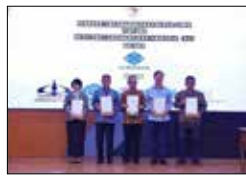
노동부 전략적 파트너 임명 (2024.5)