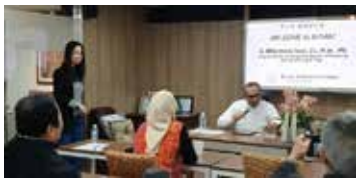
노동부 차관 BIC 방문 (2023.12)