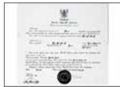
수하르토 대통령 BIC 주부산 인도네시아 명예영사관 지정 (1993~2007)