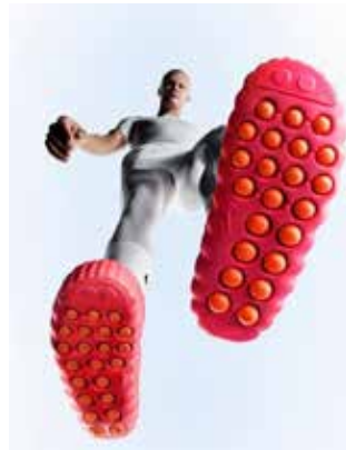
▲나이키 마인드 001을 신은 엘링 홀란드.

츠 브랜드지만, 직전해 대비 10% 가까이 줄었다. 나이키의 구원투수로 온 엘리엇 힐 최고경영자(CEO)가 내놓은 해답은 ‘스포츠로의 회귀’다. 지난해 나이키 본연의 정체성인 스포츠와 퍼포먼스에 다시 집중하겠다는 계획을 내놨다. 존 도나호 전임 CEO가 나이키를 ‘라이프스타일 브랜드’로 포지셔닝한 것이 패착이었다는 판단에서다. 그 일환으로 사업부 조직도 여성, 남성, 아동 등에서 스포츠 종목별로 재편했다. 나이키 마인드는 그 정점이라고 할 수 있다. 10여년에 걸친 연구 끝에 내놓은 이 상품은