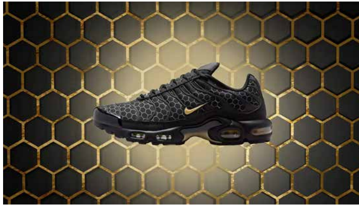
▲그리고 이걸 착화감도 매우 뛰어난 스니커다. 근면함과 자신만의 방식을 중요하게 여기는 도시에서, 나이키 에어 맥스 플러스 '맨체스터'는 0161의 에너지를 그대로 담아낸 완벽한 한 켤레다.[GQ]

맨체스터의 일벌을 모티브로 만들어진 이번 나이키 에어 맥스 플러스. 스니커 팬들이 그 야말로 열광하고 있다. 신고 출근하면 더 바쁘고 당당하게 일할 수 있겠는데?