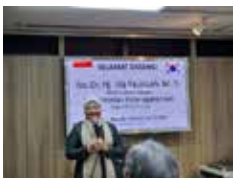
노동부 장관 BIC 방문 (2022.12)

인도네시아 노동부 전략적 파트너 기관, 한국 기업들의 든든한 산업보건 환경 지킴이!