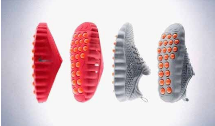
▲나이키 마인드 001(왼쪽)과 002.

지압 슬리퍼 닮은 나이키 신상 ‘마인드’ 한국 출시 직후 품질...해외선 웃돈 거래 “스포츠에 집중” 나이키 선언 입증 스킴스 협업도 인기...성수동 팝업 ‘복적’