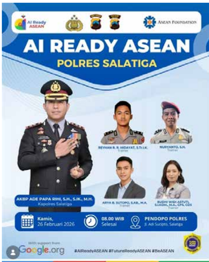
▲디지털 관련 범죄를 예방하기 위한 캠페인 프로그램

마핀도는 보고서에서 “문제의 근본은 단순한 문해력 수준이 아니라 규제 공백, 사기 피해를 줄일 도구의 부족, 이해관계자 간 협력 부족 등 생태계의 불균형”이라고 밝혔다. 셉티아지 에코 누그로호 마핀도 의장은 “이 모든 요소가 사기범들이 활동할 수 있는 공간을 만든다”고 말했다. 그는 또 “인도네시아의 디지털 보안 인프라 개선 속도가 빠르게 진화하는 사기 네트워크를 따라가지 못하고 있다”고 덧붙였다. 온라인 사기범들은 국내외에서 산업적 규모로 조직적으로 활동하고 있다. 동남아시아에서는 캄보디아와 내전 중인 미얀마가 온라인 사기 거점으로 가장 많이