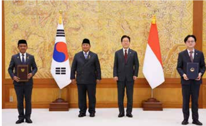
▲김경관 산업통상부 장관과 바후릴 라하달리아 에너지광물자원부 장관이 1일 청와대에서 이재명 대통령과 프라보워 수비안토 인도네시아 대통령이 임석한 가운데 핵심광물 협력에 관한 양해각서를 체결한 뒤 기념촬영을 하고 있다.

인도네시아산 배터리 생산 확대를 위한 적극적인 협력 의지를 재확인했다. 특히 이 대통령은 프라보워 대통령에게 인도네시아에 진출한 한국 기업들에 대한 각별한 관심과 지원을 요청했으며, 프라보워 대통령은 인도네시아 경제발