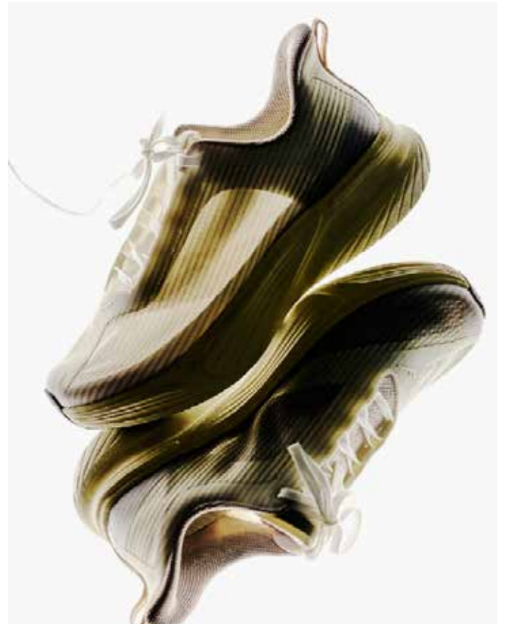
▲프로스펙스가 45년 브랜드 자산을 바탕으로 리브랜딩에 나선다. 사진은 전략 상품으로 이번에 출시하는 프로스펙스 쿠셔닝 러닝화 SWNA SEAM 26.

점은 서울 용산구에 있다. 프로스펙스는 45년간 축적한 브랜드 자산을 기반으로 정체성을 명확히 하고 상품 기획, 디자인, 유통 전략 전반에서 일관된 브랜드 경험을 구축해 나갈 계획이다.