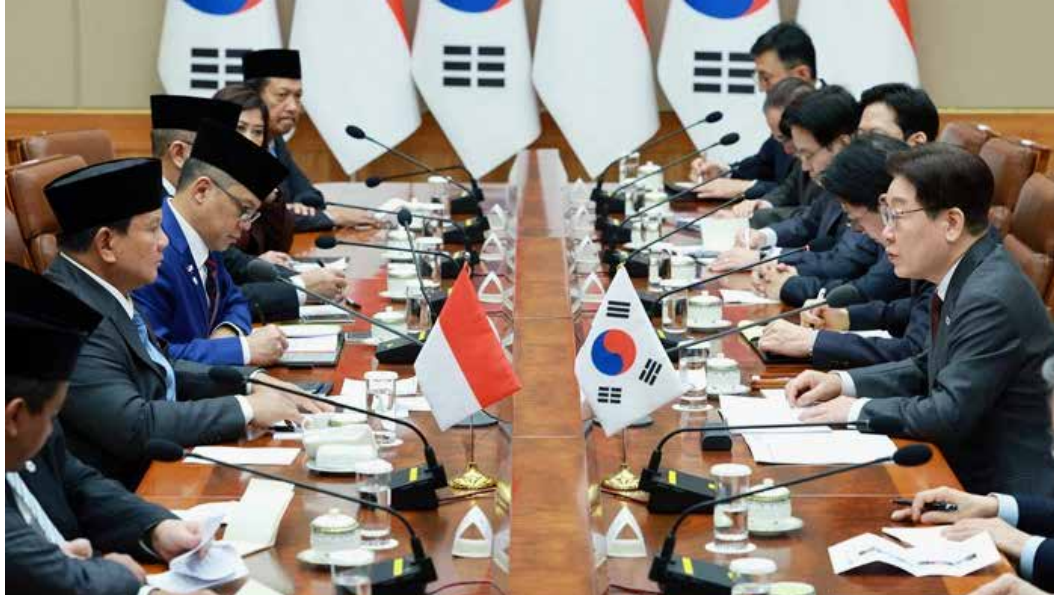
▲이재명 대통령이 1일 청와대에서 열린 프라보워 수비안토 인도네시아 대통령과 한·인니 확대 정상회담에서 발언하고 있다.

또한, 이번 회담 직후 각 분야에서 총 16건의 양해각서가 체결돼 분야별 협력 이행