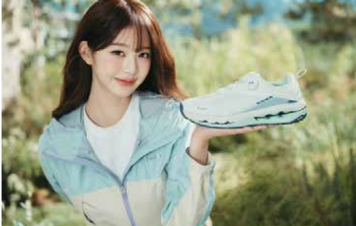
▲ ‘아이더’의 하이킹화 ‘플렉션 하이브리드’ 올해 매출은 전년 동기 대비 약 400% 성장했다.

2차 리오더 진행...2월 성장 견인 ‘걷는 즐거움’ 초점...고어텍스와 공동 개발 기술 적용