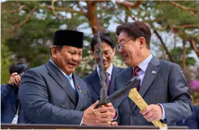
▲이재명 대통령이 1일 청와대 녹지원에서 열린 선물 교환 친교일장에서 프라보위 수비안토 인도네시아 대통령이 선물한 발리 크리스(단검)을 살펴보고 있다.

통 안보 분야에서도 양국 국민의 안전·보호를 위한 협력을 강화하기로 했다. 양 정상은 핵심광물, 조선 등 미래 신성장 분야에서 협력도 확대해 나가기로 했다. 특히 ‘핵심광물 협력 양해각서’를 개정해 세계 니켈 생산량 1위, 코발트 생산량 2위 등 우리 전략 산업인 이차전지 등에 필수적인 핵심광물을 풍부하게 보유한 인도네시아와 공급망 협력을 강화하는 제도적 기반을 마련했다. 아울러, 양 정상은 조선·해양산업 경쟁력 강화를 추진하고 있는 양국 간에 전략적 협력이 매우 유망하다는 점에 공감하고, 조선 분야에서의 협력사업을 적극 발굴하고 구체화해 나가자는 뜻을 모았다. 이어, 인도네시아 해양플랜트 서비스산업 분야에서도 기술 공동개발, 인력양성 지원 등으로 협력 범위를 확대하기로 했다. 이를 통해 2030년 10조 원 규모로 예상되는 동남아시아 해양플랜트 산업 분야에 진출을 희망하는 우리 기업의 경쟁력 강화에 기여할 것으로 기대된다. 양 정상은 첨단기술과 에너지 전환 분야에 있어서도 협력을 강화해 나가기로 했다. 이번에 체결된 양해각서들에 기반해 AI 기본협력을 비롯해, 디