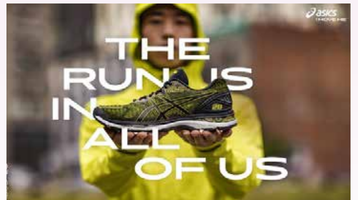
▲아식스가 대표 쿠셔닝 러닝화인 젤-넘버스(GEL-NIMBUS) 시리즈의 스무번째 출시를 기념하기 위해 ‘젤-넘버스20(GEL-NIMBUS 20)’을 출시했다.

이어 “약 20년간 매년 업데이트 돼 출시된 젤-넘버스를 통해서 쿠셔닝을 중시하는 러