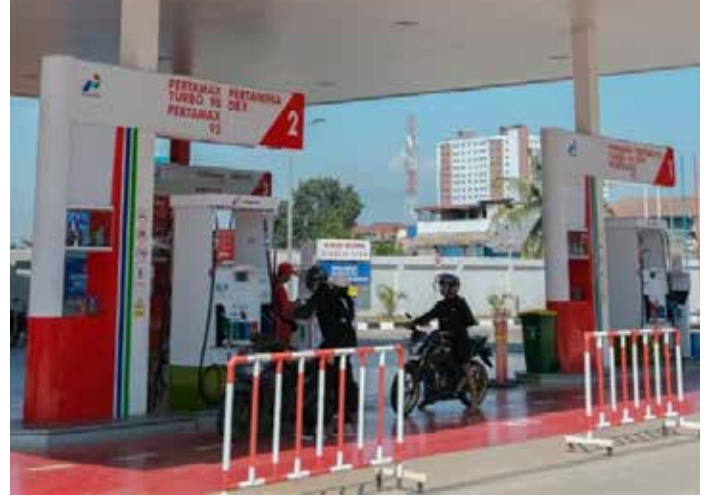
▲국영 에너지회사 빠르따미나가 운영하는 주유소 [자료사진]

중동 전쟁 여파로 세계적인 석유·가스 부족 사태가 심화하면서 인도네시아 정부가 코로나19 팬데믹 때 했던 재택근무 정책을 다시 도입한다. 재택근무(Work From Home, WFH) 요일은 매주 금요일이 될 것으로 보이며, 우선 중앙정부 공무원부터 시행하고 이어 지방정부와 민간 부문으로 확대한다는 방침이다. 26일 현지 언론 보도에 따르면 푸르바야 유디 사데와 재무장관은 전날 “정부가 재택근무 정책을 최종 확정했으며, 조만간 아이틀랑가 하르타르토 경제조정장관이 세부적인 정책을 공식 발표할 것”이라고 말했다. 푸르바야 장관은 ‘금요일’ 재택근무 시행 방안과 관련하여, 생산성 저하를 최소화하기 위해 해당 요일이 선택됐으며, ‘금요일’은 근무시간이 가장 짧기 때문에 생산성 손실도 최소화할 수 있다고 설명했다. 다만, 장관은 재택근무 정책이 민간 부문에 의무적으로