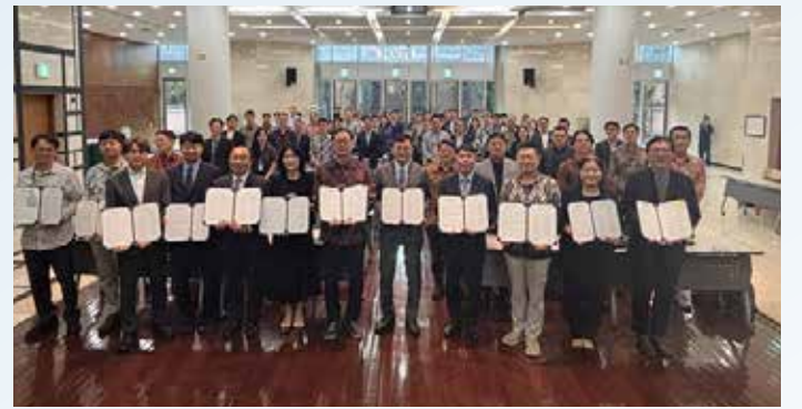
▲주인도네시아한국대사관이 인도네시아한인상공회의소, KOTRA 자카르타 무역관과 지난 3월 10일 자카르타에 있는 한국대사관 강당에서 'K-이니셔티브 협의체' 출범식을 열었다.

주인도네시아한국대사관이 인도네시아한인상공회의소, KOTRA 자카르타 무역관과 지난 3월 10일 자카르타에 있는 한국대사관 강당에서 'K-이니셔티브 협의체' 출범식을 열었다.