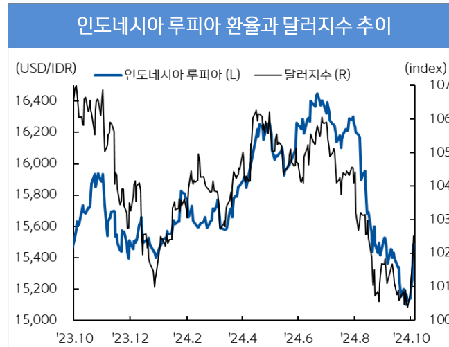
자료 : Bloomberg, 신한은행 S&T센터