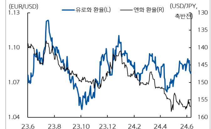
유로화와 엔화 환율 추이