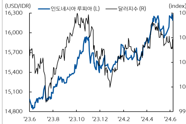
인도네시아 루피아 환율과 달러지수 추이