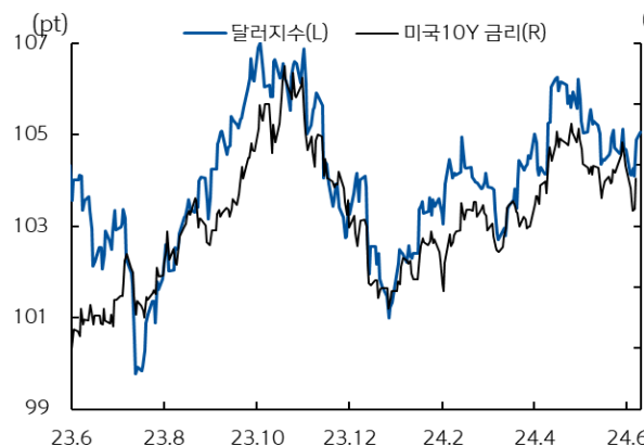
미국 국채 금리와 달러 지수 추이