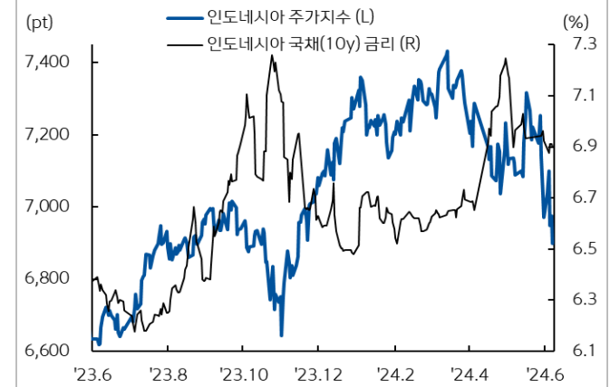
인도네시아 주가지수와 국채 금리 추이