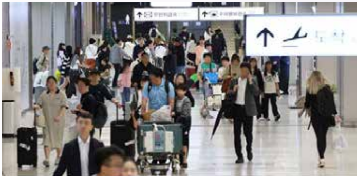
▲어린이날 연휴 마지막 날인 지난 6일 서울 강서구 김포공항 국내선 입국장에서 여행객들이 입국하고 있다.

국토교통부가 이달 중 인도네시아, 몽골, 우즈베키스탄에 대한 신규 운수권(타국에 항공기를 보내 여객·화물을 탑재·하역할 수 있는 권리)을 배분한다. 항공업계는 지방 공항에서 출발하는 인도