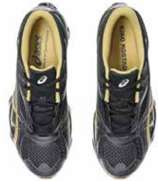
키코 코스타디노브가 아시스와 협업한 젤 쿼텀 지엔치아 '블

랙/골드' 를 공개했다. 이번 협업 스니커는 앞서 출시한 '닉스' 에 이어 새로운 컬러웨이로 선보여졌다. 해당 스니커는 블랙 메시 소재가 어퍼 전반을 감쌌으며, 시그니처 아시스 측면 로고 등 곳곳에는 골드 컬러 포인트가 더해졌다. 키코 코스타디노브 x 아시스 젤 쿼텀 지엔치아 '블랙/골드' 는 2024년 여름 출시될 예정이며, 가격은 약 40만원이다.