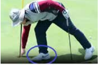
▲지난 7~9일 북한 평양골프장에서 열린 불철골프 애호가 경기에 한 남성이 미국 브랜드 '나이키' 로고가 박힌 신발을 신고 있다.

미국 제국주의 상징이라며 청바지 착용도 금지하는 북한에서 미국 스포츠 브랜드 '나이키' 제품을 착용한 모습이 다수 포착됐다. 20일 미국 자유아시아방송(RFA)은 북한 평양골프장에서 지난 7~9일 열린 불철골프 애호가 경기에서 나이키 로고가 새겨진 바지, 신발을 착용한 선수들이 포착됐다고 보도했다. 조선중앙TV가 지난 12일 방영한 경기 영상을 보면, 골프채를 휘두르는 남성의 흰색 바지에는 검은색으로 나이키 로고가 박혀 있다. 흠에 손을 넣는 다른 선수의 신발에서도 선명한 나이키 로고를 확인할 수 있다. 조선중앙통신이 지난달 26일 평양골프장이 인기를 끌고 있다며 보도한 사진에서도 골프카트에 서 내리는 한 남성의 티셔츠 가슴팍에는 나이키 로고가 그려져 있다. 북한은 최근 몇 년간 외국 문화의 영향력에 대한 단속을 강화한 것으로 전해졌다. 김정은 북한 국무위원장은 '부르주아 문화'와 '반사회주의적 행위'를 자본주의 국가들이 북한을 약화하기 위해 사용하는 무기라고 지목해왔다. 통일부가 공개한 '북한 경제·사회 실태 보고서'에는 북한에서 스키니진 등을 입을 경우 바