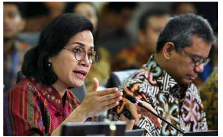
▲스리 몰라니 인드라와띠 재무장관

반면, 인프라는 올해 423조 3천억 루피아가 2025년 404조 2천억 루피아에서 433조 9천억 루피아 사이이며 제안 범위의 상한선에 가깝기 때문에 지출이 감소할 수 있는 유일한 우선순위 항목이다. 스리 장관은 연설에서 국가 경제 발전을 위한 인프라의 중요성을 반복해서 강조했다. 하지만, 왜 퇴임하는 정부가 이 분야에 대한 지출을 줄이려고 하는지에 대한 이유는 설명하지 않았다. 제안된 국가예산 배분은 거시 경제 전망 및 재정 정책 초안(KEM-PPKF)에 나타나 있으며, 이는 향후 몇 달 내에 의회에서 승인할 예정인 2025년 국가 예산의 기초를 형성한다. 그러나 이는 확정된 것이 아