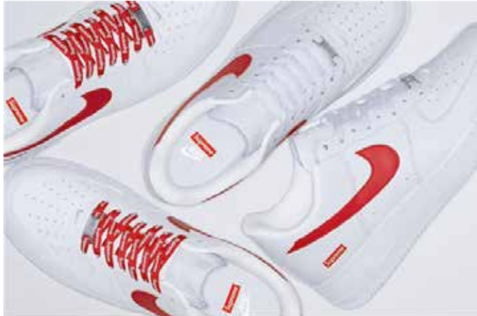
▲슈프림X나이키 에어포스1' 제품 사진.

다. 슈프림의 빨간색 로고를 적용한 레드 스우시는 123달러(약 16만7500원)로 책정됐다. 이 제품은 흰색 가죽 소재로