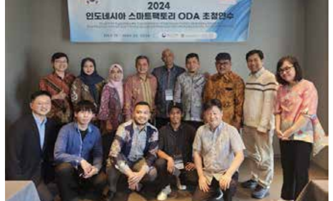
▲인도네시아 스마트팩토리 ODA 초청연수에 참석한 현지 전문가, 정부 관계자가 기념촬영을 했다.

이노비즈협회(중소기업기술혁신협회)는 경기도 안산 중소기업연수원에서 인도네시아 중소기업협동조합부 공무원 및 현지 전문가를 대상으로 스마트팩토리 국제개발협력(ODA) 사업 전문가 초청연수를 진행했다고 24일 밝혔다.