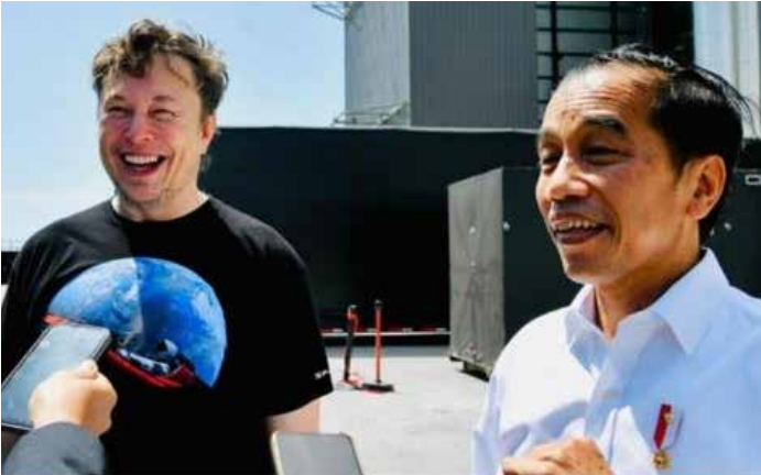
▲조코 위도도 인도네시아 대통령(오른쪽) 2022년 5월 미국 텍사스주 보카치카에 있는 스페이스X 발사장에서 일론 머스크와 만나고 있다.

약 1만7천개의 섬으로 이뤄진 인도네시아에서 인공위성을 이용한 인터넷 통신 서비스인 스타링크가 개통돼 외판섬까지 인터넷에 접속할 수 있게 됐다.