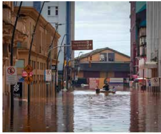
▲홍수로 도시가 잠긴 브라질 히우그란지두술(Rio Grande do Sul)주. @jeffbottega

다. 브라질의 최대 신발 제조업체 중 하나인 칼카도스 베이라-리오(Calçados Beira-Rio)는 홍수 이후 공장을 재건했지만, 또다시 같은 공장이 파괴됐다. 포르투 알레그레의 여성 협동조합인 저스타 트라마(Justa Trama) 회원들은 물 폭탄이 집을 덮치고 공장이 위협에