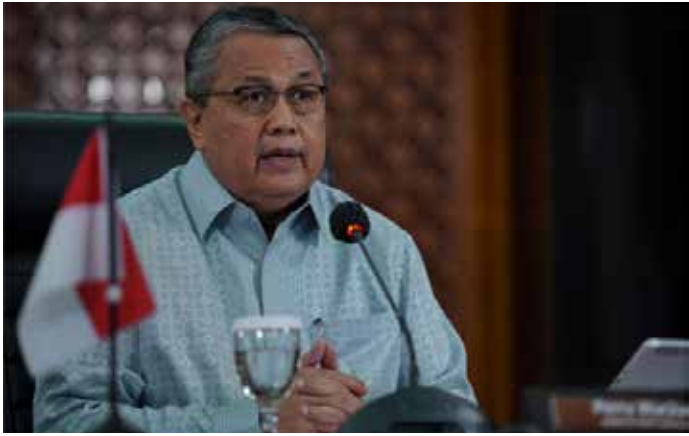
▲빠리 와르지요 중앙은행 총재

인도네시아 중앙은행(BI)은 지난달 25bp 금리 인상 이후 자본 유입 증가로 루피아화가 안정세를 보이고 있다고 판단해 기준금리를 6.25%로 동결했다.