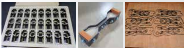
종이, 고무, 가죽, 스폰지,아스테이지, PC, 필름등 모든 자재 커팅금형의 최적금형의 대명사 "톱슨 목금형"

우수한 첨단장비로(CAD, Laser, Auto Banding)최상의 톱슨 목형을 제공하여 신속성, 정밀성, 경제성 이 월등하며 신발, 자동차부품, 전자부품 절단, 생산하는데 최상의 칼 금형