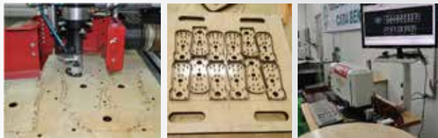
철판,아크릴, 합판, 빼그라이트등 레이저커팅