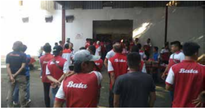
▲서부 자바주 뿌르와까르따에 있는 신발제조업체 바따제화 직원들이 지난 5월 3일 공장에서 경영진의 발표를 위해 모였다

유명 신발 브랜드인 바따(Bata)가 최근 서부 자바주 뿌르와까르따에 있는 공장을 폐쇄하면서 200명이 넘는 근로자들이 생계를 잃었다. 이들은 현재 가족을 먹여 살리는 데 큰 어려움을 겪고 있지만, 앞으로 받게 될 보상을 최대한 활용하여 스스로의 미래를 설계하고 싶다고 말한다.