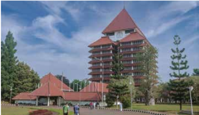
▲인도네시아 국립대학교

인도네시아에서 국립 대학교는 국내에서 최고의 고등교육기관으로 인정받고 있다. 이는 인도네시아 국립 대학교가 정부의 재정지원 덕분에 우수한 강사진, 최고의 실험실 및 연구소 등을 갖췄기 때문이다. 또한 국내 사립대와 비교해 국립대의 저렴한 등록금은 우수한 학생들을 유치하는 데 큰 요소로 작용해 학교의 경쟁력을 더욱 높이고 있다는 평가를 받고 있다. 하지만 최근 몇 년간 등록금이 크게 인상되면서 학생과 학부모들의 불만이 증가하고 있다. 그럼에도 불구하고, 인도네시아 국립대의 등록금은 싱가포르, 말레이시아 및 태국 등 이웃 국가와 비교했을 때 여전히 상대적으로 저렴한 편이다. 인도네시아에는 126개 국립대를 포함한 총 3,300여개의 국공립 및 사립대가 있다.