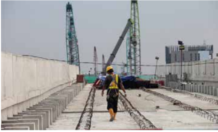
▲자카르타 경전철(LRT) 1B단계 건설 현장

파산한 국영건설회사 이스따까 까르야(PT Istaka Karya)의 벤더들을 대표하는 협회인 브르코빅(Perkobik)은 하원 제6위원회에 파산한 국영건설회사의 미지급금을 해결하도록 정부에 압력을