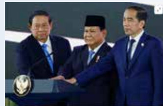
▲2025년 2월 24일 인도네시아 자카르타의 메르데카 궁전에서 수실로 발방 유도요노 전 대통령, 프라보워 수비안토 대통령, 조코 위도도 전 대통령이 새로운 국부펀드 출범식에 참석했다.

싱가포르 테마섹 모델 벤치마킹... 초기 자본금 20億달러 투입 야권 “관리·감독 우려” ... 프라보워 정부 첫 시위 유발