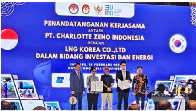
▲PT Charlotte Zeno Indonesia (CZI)와 LNG Korea는 40조 루피아 규모 에너지 및 투자 협약. 2025.2.17.

한국과 인도네시아는 에너지 및 투자 분야에서 괄목할 만한 협력 강화를 이루어 냈다. PT Charlotte Zeno Indonesia (CZI)와 LNG Korea Co., Ltd.는 자카르타 호텔 인도네시아 캄핀스키에서 협약을 체결하며, 인도네시아의 지속 가능한 에너지 프로젝트 개발 및 에너지 인프라 강화를 본격적으로 추진할 예정이다. 투자 규모는 252만 달러, 약 40조 루피아에 달한다. 이번 협력은 양국 정부가 공동으로 추구하는 2060년 탄소 중립 목표 달성을 위한 전략적 파트너십의 일환으로, 신재생에너지 등 다양한 분야에서 오랜 기간에 걸쳐 구축되어 왔다.