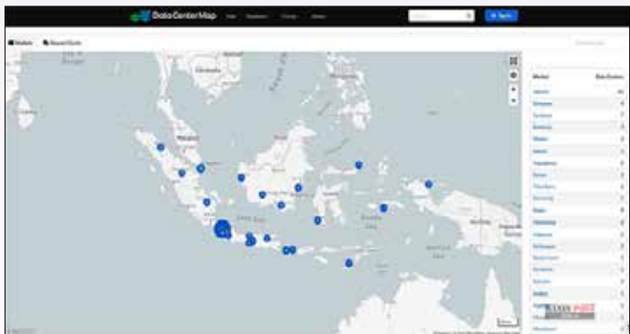
▲인도네시아 전국 137개 데이터센터 구축 운영 지도, 2025.2.18.

인도네시아의 데이터센터 산업은 디지털 인프라와 클라우드 컴퓨팅 서비스 수요 증가에 힘입어 빠르게 성장하고 있다. 2월17일 Data Center Map의 자료에 따르면, 수도 자카르타는 81개의 데이터센터를