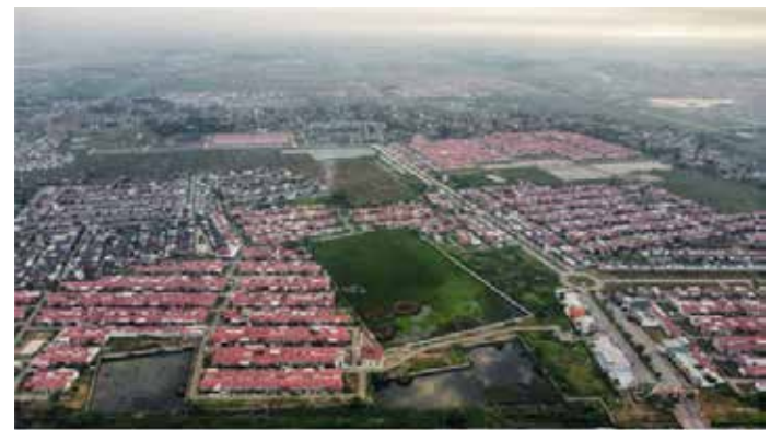
▲서부자바 브까지 지역의 주택단지

부동산 개발업자들은 브라보 워 수비안토 대통령의 주요 사업인 연간 300만 채의 주택과 아파트를 국가주택 공급에 추가하는 프로그램에 대해 더 자세한 내용을 요구했다. 19일 자카르타포스트에 따르면, 인도네시아 부동산(REI) 중앙 이사회 회장인 조꼬 수란토는 공공주택 및 정착부가 운영하는 프로그램에 대한 명확성 부족으로 인해 인도네시아 부동산 시장이 불안정해졌다고 말했다. 조꼬는 18일, 주택 개발업자들은 브라보워 대통령이 부동산 업계 종사자들에게 300만 주택 프로그램과 이 프로그램에 대한 국가 원수로서의 견해에 대해 말해줄기를 바란다고 말했다. 조꼬와 다른 부동산 협회 회장들은 또한 은행 부문에 정부의 주택금융 유동성자금(FLPP)과 유사한 새로운 자금 조달 계획을 수립할 것을 촉구했다. 협회는 보조금 모기지의 분배가 브라보워 행정부의 정책 변경으로 인해 어려워졌다고 지적했다. 당초 국가 예산에서 75%, 은행에서 25%를 배정한 계획이 각 출처에서 50%씩 할당하는 것으로 변경된 것이다. 조꼬는 올해 22만 건의 주택금융 유동성자금(FLPP) 모기지 발급이 정부의 명확한 설명 없이 보류됐고, 대형 개발업체들이 협회 이사회에게 의문을 제기하고 있으며 상황에 대해 혼란스러워하고 있다고 말했다. 공공주택저축 관리기관(BP Tapera)은 앞서 프로그램이