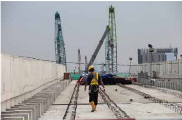
▲자카르타 경전철(LRT) 1B단계 건설 현장

인도네시아 공공사업부는 재무부로부터 70% 이상의 예산 삭감을 당할 처지에 놓였다. 이는 행정부의 비용이 많이 드는 우선순위 프로그램에 재할당할 수 있는 자금을 절약하라는 프라보워 수비안토 대통령의 지시에 따른 것이다. 공공사업부 디아나 꾸수마스 푸띠 차관은 지난 1월 31일, 부처 예산이 대폭 삭감되면 공공 인프라 개발 진행에 영향을 미칠 것이라고 말했다. 도로 건설뿐만 아니라 댐, 관개시설, 건물 모두 중단된다는 것이다.