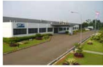
▲산켄 인도네시아(PT Sanken Indonesia) 찌까랑 공장

일본에 본사를 둔 전자장비 제조업체인 산켄 일렉트릭(Sanken Electric Co.Ltd.)의 자회사 산켄 인도네시아(PT Sanken Indonesia)가 오는 6월에 서부자바의 찌까랑 공장 MM2100을 폐쇄할 계획이라고 정부 관계자가 밝혔다. 찌까랑의 산켄은 서부 자바 반딧죽 소재 12헥타르 규모의 가전제품 생산 시설을 운영하고 있는 산켄 아르가드위자(PT Sanken Argadwija)와는 다른 공장이다. 산업부의 금속기계운송 장비 및 전자 담당 국장인 스피아 디아르타는 지난 19일, 변압기와 무정전