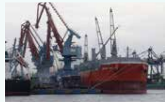
▲북부자카르타 판중 뿌리옥 자카르타 국제컨테이너터미널(JICT)

가와 국민의 복지에 도움이 되어야 한다”고 말했다. 이 새로운 조치는 3월 1일부터 시행될 것이라고 밝혔다. 인도네시아는 2023년부터 모든 자원 수출업체에게 최소 25만 달러 상당의 선적 서류가 있는 모든 수출 수익금의 30%를 현지 금융 시스템에 보관하도록 요구했지만, 프라보워는 수출업체들이 여전히 인도네시아 외부의 은행에 수익을 보관하는 것을 선호한다고 말했다. 프라보워는 새로운 규정에 따라 수