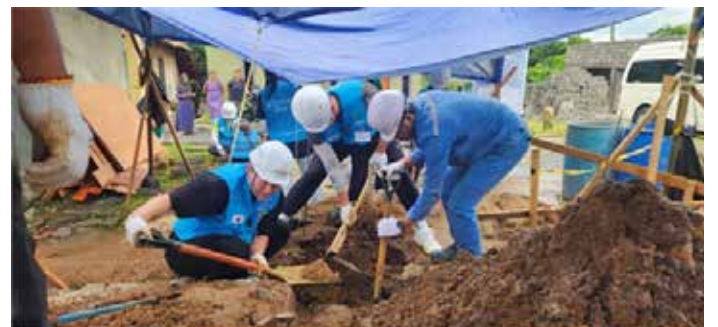
▲비욘드 17기 취약계층 대상 건축봉사 터파기 현장

해외봉사 첫번째 활동은 주거 취약계층을 위한 주택 건축봉사였다. 단원들은 취약계층 다섯가구에 폐플라스틱 업사이클링 벽돌, 빗물 수집 장치, 오폐수 처리 시스템 등을