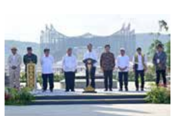
▲조코위 대통령(가운데)이 독립기념일을 앞두고 2024년 8월 13일 신수도에 세워진 누산타라 대통령궁 앞에서 연설하고 있다.

난해 초 착공 이후 빠르게 진행되고 있으며, 이는 수도 이전 프로젝트의 중요한 이정표가 될 예정이다.