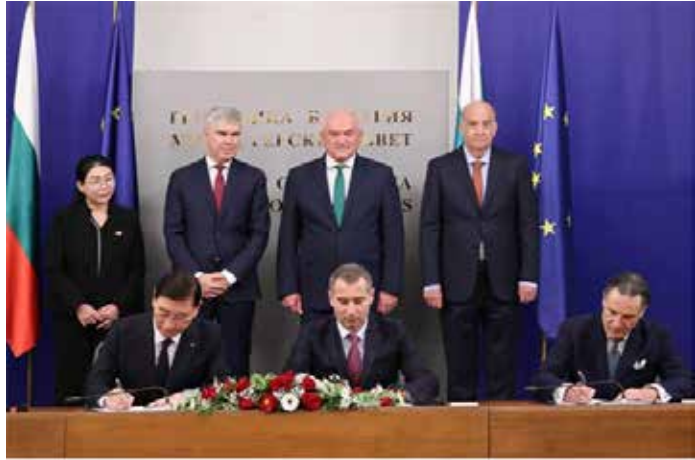
▲현대건설이 지난해 11월 4일(현지시간) 불가리아 코즐로두이 대형원전 설계 계약을 체결했다고 밝혔다.

1965년 이후 누적 수주액 1조달러 넘어서...중동 비중 46% 현대건설·한수원 컨소시엄, 非중동 원전 ‘수주 대박’ 새물결