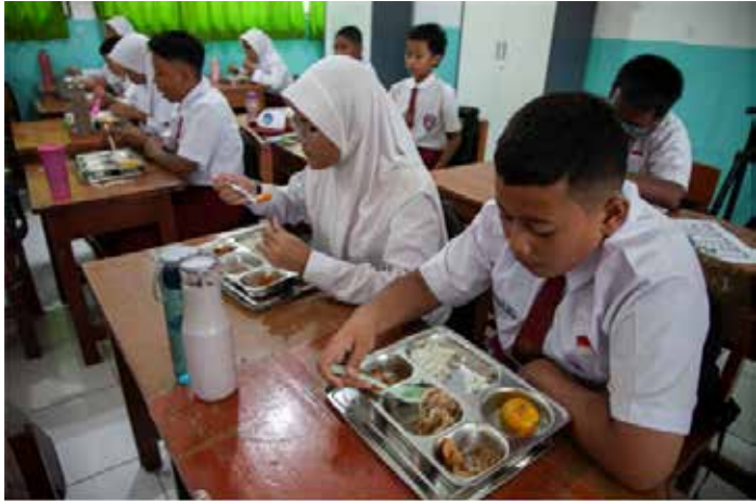
▲2025년 1월 6일 무료 영양 급식 프로그램 첫날, 자카르타 제6공립초등학교(SDN 06) 학생들이 식사를 하고 있다.

인도네시아 브라보워 수비안도 대통령은 각 부처, 기관 및 지역 지도자들에게 2025년에 총 306조 7천억 루피아의 지출을 삭감하도록 명령했는데, 이는 대통령의 주요 정책인 무료 영양식 프로그램과 기타 비용이 많이 드는 계획 지원을 위한 추가 자금을 모색하기 위함이다. 지난 22일에 발표된 대통령 지침 1/2025호에 명시된 삭감안은 부처 및 기관 예산에서 256조 1천억 루피아, 지방 이전 기금에서 50조 5,900억 루피아로 구성된다. 이 지침은 유지 보수, 공식 출장, 행사, 컨설팅 서비스, 공공 사업 및 장비 조달과 관련된 지출에 영향을 미칠 것으로 예상된다. 그러나 직원 급여와 사회 지원 프로그램은 면제 대상이다. 계획된 예산 삭감은 2025년 국가예산의 8.4%에 해당하며, 이는 일반적인 5% 삭감보다 훨씬 높은 수치다. 스리 물라니 인드라와띠 재무 장관은 지난 24일 금융시스템 안정위원회(KSSK) 분기별 브리핑에서 기자들에게 “각 부처와 지역 예산은 일자리 창출, 생산