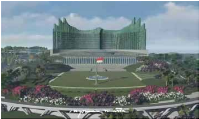
▲인도네시아 신수도(Ibu Kota Nusantara · IKN) 전경

IKN 녹색·디지털 혁신 담당 부국장 발인 韓 정부 ODA 자금 지원...기술 활용 등 기대