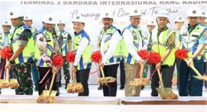
▲인니 바탐 항만국제공항 제2터미널 기공식

인도네시아 정부는 새로 취임한 도널드 트럼프 미국 대통령 아래에서 관세를 피하려는 중국 공장의 투자에 대한 개방성을 재차 강조했다. 자카르타포스트가 21일 전했다. 정부는 특히 바탐섬의 경제특구(SEZ)가 주요 투자처로 부상하고 있는 것에 기대를 걸고 있다.