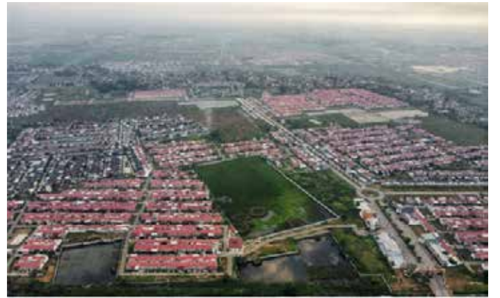
▲서부자바 브가시 주택단지

있다. 프라보워 대통령은 농촌 지역에 200만 채, 도시에 100만 채의 주택을 건설하겠다고 공언했으며, 그의 동생인 사업가 하심 조요하디꾸수모가 이끄는 주택 태스크포스팀을 구성했다. 이 프로그램은 인도네시아의 부족한 주택 공급 문제를 해결하고자 한다. 지난 2023년에는 주택 수요와 기존 주택 소유자 간의 격차가 990만 가구에 달했다. 전 공공사업주택부에 따르면 작년에 1,270만 가구 이상으로 추산되는 주택 적체량과 비교하면 그 격차는 훨씬 더 커질 것으로 예상된다. 정부는 국가 자금이 지나치게 의존하지 않고 프로그램을 추진하기 위해 외국인 투자자를 유치하기 위해 노력해 왔다. 지난해 10월 말, 마투아라르 시라이트 공공주택 및 정착부 장관은 매년 주택 프로그램