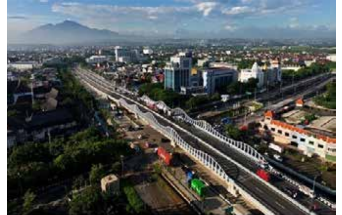
▲ 최근 완공된 스마랑 고가도로

프라보워 수비안토 대통령은 ‘인도네시아 주식회사 (Indonesia Inc)’ 개념을 제안하며, 민간 기업이 인프라 개발을 포함해 국가 경제 성장에 주도적인 역할을 할 것을 촉구했다고 19일 자카르타포스트가 보도했다.