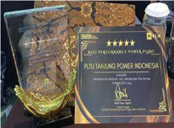
▲인도네시아 국영전력회사(PLN)가 선정하는 '2024 최우수 발전소(Best Performance Power Plant)' 상패와 상장.

한국동서발전이 인도네시아 현지에서 발전소 운영 역량을 인정받았다. 동서발전은 인도네시아에서 운영하고 있는 칼셀-1(칼셀) 발전소가 인도네시아 국영전력회사(PLN) 선정 '2024 최우수 발전소' 를 수상했다고 20일 밝혔다. 동서발전의 칼셀 발전소는 2022년 이후 3년 연속으로 이 상을 받았다. 칼셀 발전소는 동서발전이 인도네시아 아다로그룹과 공동 투자해 갈리만탄섬 남부에서 운영하고 있는 순환유동층 석탄화력발전소다. 순환유동층 석탄화력발전소는 공기와 석회를 동시에 주입하는 방식으로 질소산화물, 황산화물 등 오염물질 배출을 크게 줄이는 친환경 설비다. 동서발전은 발전소 운영 신뢰도 및 효율성을 평가하는 주요 항목에서 높은 점수를 받았다.