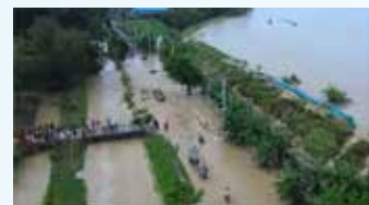
▲중부자바주 북부 해안지역에 위치한 끈달 지역에 폭우로 가옥 1천여 채가 침수됐다.