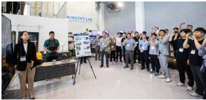
▲현대건설이 27일 경기 용인 기흥구 기술연구원 내 로보틱스랩에서 ‘혁신 R&D 건설로봇 기술 시연회’를 개최했다. <현대건설>