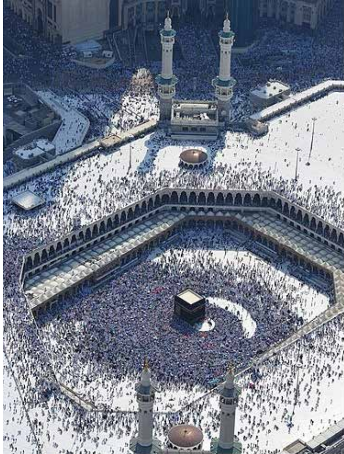
▲사우디아라비아 메카에 있는 이슬람의 제1성지인 카바 신전.

순례객들 “폭염 속 의료 지원 등 부족” 이집트 정부, 성지순례 여행사 면허 박탈