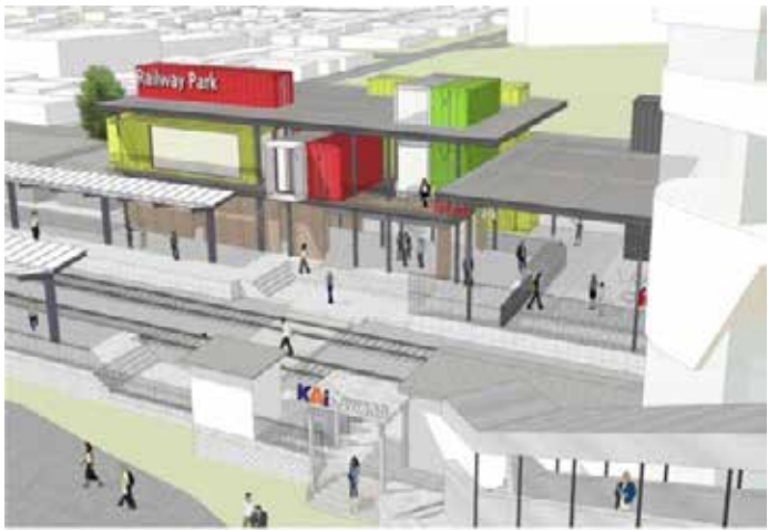
▲자카르타 도시철도 시범역사 조감도

서울 지하철 1~8호선을 운영하는 서울교통공사가 인도네시아 자카르타 도시철도 운영 컨설팅 사업을 추진한다고 1일 밝혔다. 사업 기간은 2025년부터 2028년까지로 총사업비는 980만달러(130억원) 규모다. 이 사업은 한국국제협력단(KOICA)이 공모하는 공공 협력사업으로 삼성물산, 도화엔지니어링과 컨소시엄을 구성해 사업을 진행한다. 내년 1월 이번 사업을 위한 약정을 체결할 예정이다. 공사는 이번 사업을 통해 안전하고 편리한 자카르타의 대중교통 이용 환경을 개발하고, 지속 가능한 대중교통 시스템을 구축해 시민복지와 교통 문제 해결에 기여하겠다는 계획이다. 공사는 앞서 2020년 코이카가 발주한 철도 운영 컨설팅 사업인 '자카르타 경전철 역량강화사업'에 참여해 올해 4월까지 사업을 진행한 바 있