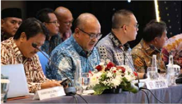
▲바탐, 2045년까지 개발 우선순위의 7개 전략산업

인도네시아 바탐 사업청(BP Batam)은 2025년 회계연도의 정부 업무 계획(RKP)과 주 부처/기관 업무 계획 및 예산(RKA-KL)을 발표했다. 바탐 사업청의 뿌르위안토 부 청장은 자카르타에서 열린 하원(DPR) 10위원회에서 바탐은 2045년까지의 미래 계획이 바탐의 현재 상황에 맞는 7가지 전략적 산업 부문에 초