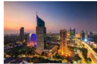
▲인도네시아 수도 자카르타의 전경

세계은행은 24일 발표한 최신 인도네시아 경제전망에서 올해 실질 국내총생산(GDP) 성장률을 5.0%로 예측했다. 지난해 12월의 직전 예측보다 0.1%포인트 상향 수정했다. 2025년과 2026년은 5.1%로, 직전 예측보다 각각 0.2%포인트, 0.1%포인트 상향했다. 세계은행은 24일 성명을 통해 인도네시아 경제는 향후 수년간 공공투자 증가 및 소비자 수요 등