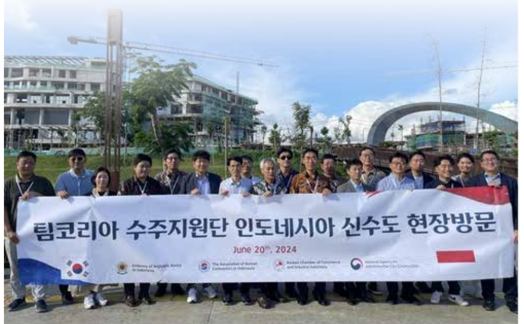
▲(누산타라=연합뉴스) 20일(현지시간) 주인도네시아 한국 대사관과 재인도네시아 한국건설업협회, 재인도네시아 한인상공회의소, 행정중심복합도시건설청 등으로 구성된 팀코리아 수주지원단이 인도네시아 신수도 누산타라를 찾아 기념 촬영을 하고 있다.

인도네시아의 수도 이전을 앞두고 인도네시아 내 한국 건설사 및 관계자들이 신수도 부지를 찾아 사업 참여 가능성 등을 타진했다. 인도네시아는 수도를 현 자카르타에서 칼리만탄섬 누산타라로 옮기는 작업을 진행하고 있다. 주인도네시아 한국 대사관과 재인도네시아 한국건설업협회의, 재인도네시아 한인상공회의소, 행정중심복합도시건설청은 20일(현지시간) 팀코리아 수주지원단을 구성해 칼리만탄섬 누산타라에서 한국 기업의 신수도 사업 참여 방안 모색을 위한 '팀코리아, 신수도 합동 현장 방문 및 워크숍'을 실시했다. 지원단은 인도네시아 공공사업주택부와 함께 한국 정부의 공적개발원조(ODA)로 건