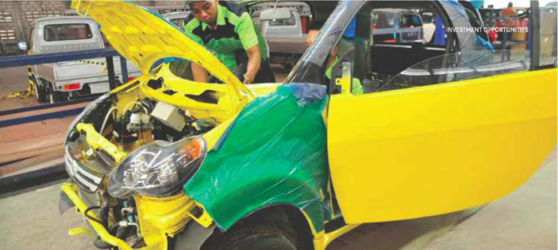
Photo credit: Yudhi Dwi Anggoro, "Mobil Listrik Buatan Dalam Negeri", 2016

자바섬 이외의 지역은 천연자원 가공사업 위주로 진행 될 것이며 자바섬내의 산업단지에는 노동집약, 첨단 기술 및 소비재 산업에 집중할 예정입니다.