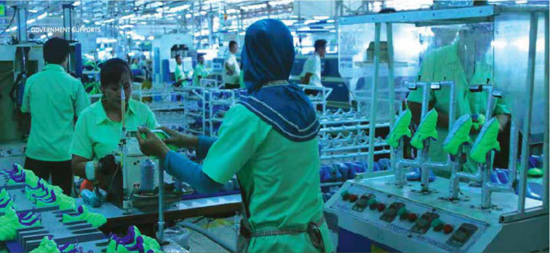
"Kegiatan Industri 4", 2016