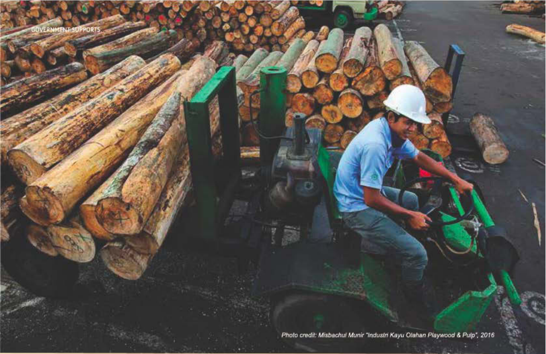
Photo credit: Misbachul Munir "Industri Kayu Olahan Plywood & Pulp", 2016