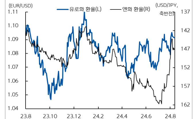
유로화와 엔화 환율 추이