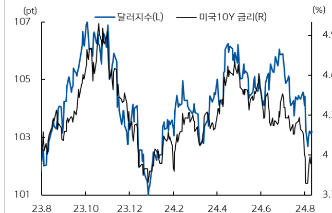
미국 국채 금리와 달러 지수 추이