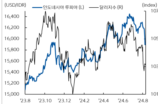
인도네시아 루피아 환율과 달러지수 추이