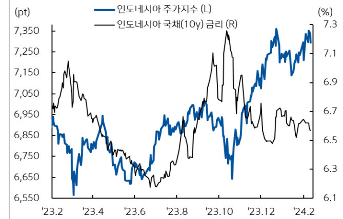
인도네시아 주가지수와 국채 금리 추이