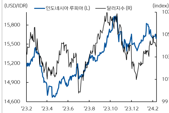
인도네시아 루피아 환율과 달러지수 추이