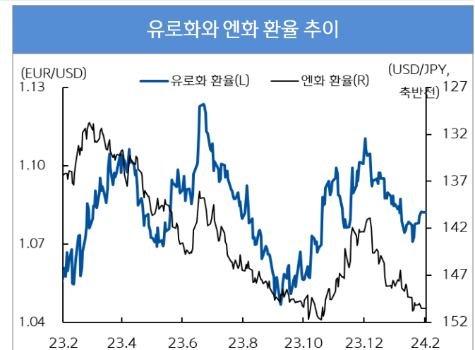
자료 : Bloomberg, 신한은행 S&T센터