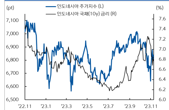
인도네시아 주가지수와 국채 금리추이