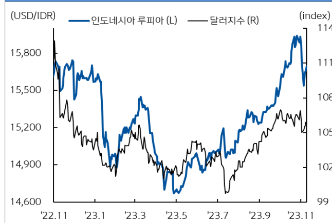
인도네시아 루피아 환율과 달러지수 추이