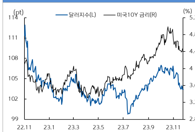
미국 국채 금리와 달러 지수 추이