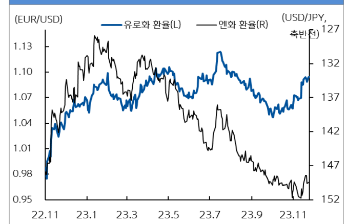
유로화와 엔화 환율 추이