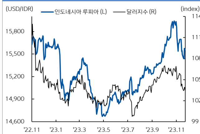
인도네시아 루피아 환율과 달러지수 추이