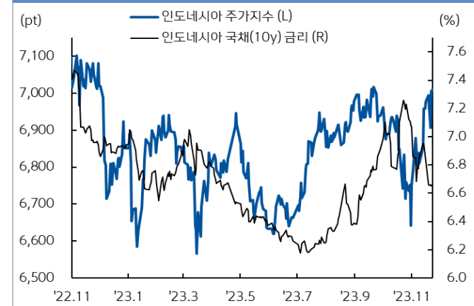
인도네시아 주가지수와 국채 금리추이