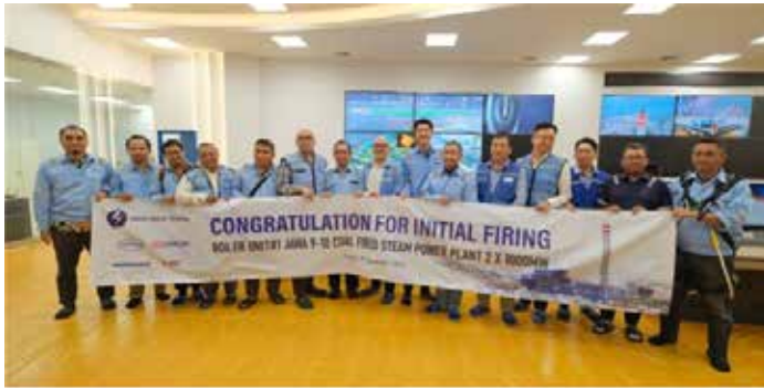
▲인도네시아 특수목적법인(SPC) IRT(PT. Indo Raya Tenaga)는 지난달 29일 자와 발전소 9, 10호기 연소에 성공했다.

두산에너지빌리티는 지난 2019년 IRT와 1조6000억원 규모의 자와 9·10호기 화력발전