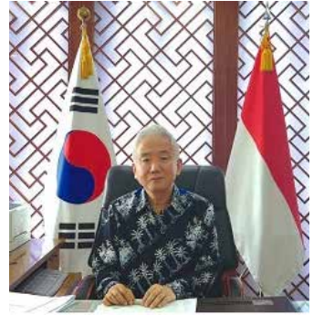
▲이상덕 주인도네시아 대한민국대사 리를 대변해 줄 선량을 뽑는 소중한 선거에 여러분의 귀중한 한 표를 행사하여 주실 것을 당부합니다. 사랑하는 동포 여러분, 푸른 용의 해 갑진년을 맞이했습니다. 동포 여러분의 하시는 모든 일이 용의 기운을 받아 순조롭게 풀려 나가기를 진심으로 기원합니다. 주인도네시아 대한민국대사 이상덕

경제 활동을 이어갈 수 있는 경제·사회 환경이 조성될 수 있도록 힘쓰겠습니다. 이를 위해 우리 대사관은 '팀 코리아'의 기치하에, 공공기관, 동포사회, 진출기업 등이 함께 서로의 생각과 정보를 공유하고, 현장에서 맞닥뜨리는 어려움을 합심하여 풀어 나가는 플랫폼을 만들어 나가겠습니다. 본국 정부는 작년 6월 750만 재외동포의 염원을 담아 재외동포청을 출범시켰습니다. 우리 대사관은 재외동포청과 긴밀히 협력하여, 보다 양질의 영사 서비스가 동포 여러분들께 제공될 수 있도록 배전의 노력을 기울이겠습니다. 마지막으로, 2024년 3월 27일부터 4월 1일까지 제22대 국회의원 재외선거가 실시됩니다. 동포 여러분의 목소리