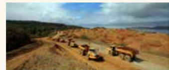
▲안탐 니켈 광산 [Antam]

안탐 측은 이번 지분 매각이 인도네시아 전기 자동차 생태계를 구축하기 위한 것이라며 합작 투자 회사 설립 차원에서 이뤄진 것이라고 설명