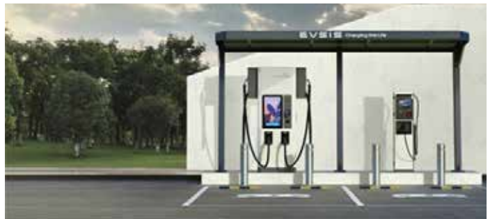
▲이브이시스가 인도네시아에 설치할 전기차 충전 인프라

롯데정보통신은 자회사인 전기차 충전 플랫폼 기업 이브이시스(EVSIS)가 공적개발원조(ODA)를 통해 인도네시아에서 전기차 충전 인프라를 조성한다고 20일 밝혔다. 사업은 3년 동안 인도네시아에 순차로 200kW(킬로와트) 초급속 충전기와 22kW 완속 충전기 약 70기를 보급하는 것이다.