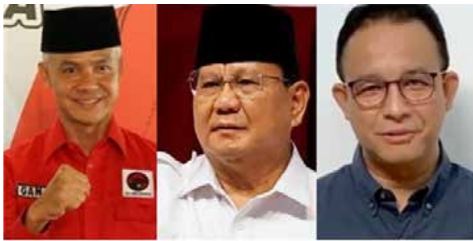
▲사진은 인도네시아 유력 대선 후보. (왼쪽부터) 간자르 프라노워 자바 주지사, 프라보워 수비안토 국방장관, 아니스 바스웨단 자카르타 전 주지사. <연합뉴스>

이 사업은 총 3단계로 나뉘며 정부 7조7천억 원, 민·관협력 21조7천억 원, 민간투자 10조6천억 원 등 모두 40조 원의 재원이 투자된다.