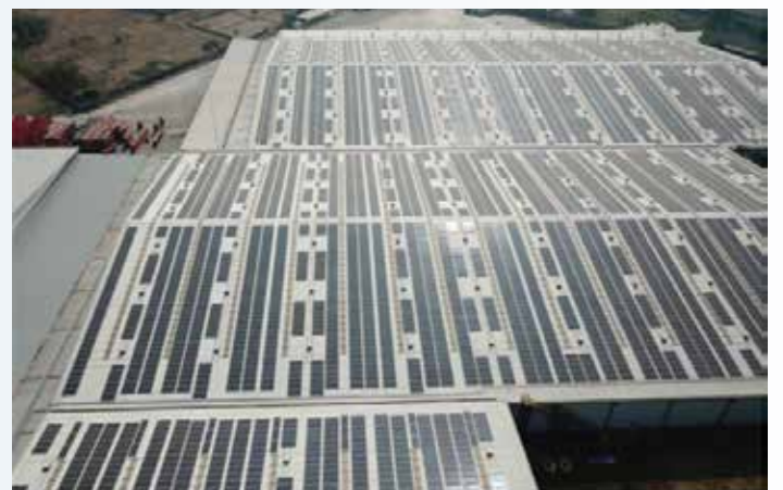
▲CCEP 인도네시아가 설치 중인 동남아 최대 규모의 태양광 패널 지붕

인도네시아 공장에 960만킬로와트(kW)의 태양광 발전 패널을 설치하는 등 적극적인