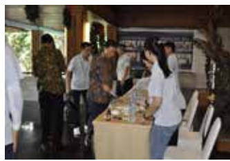
▲행사장에 입장하고 있는 회원들