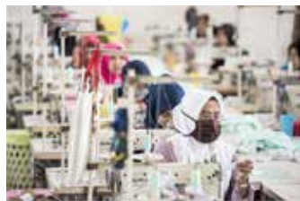
▲서부 자바 반동의 De' Cantiqou 공장에서 노동자들이 옷을 만들고 있다. 2017.10

이러한 조치의 효과는 2025년에야 현실화되기 시작할 것이므로 수입국의 구매력에 부정적인 영향을 미칠 것이라고 설명했다. 이는 결국 2020년 이후 가장 낮은 가동률 수준 50%를 기록한 인도네시아를 포함한 수출국의 섬유 산업 가동률에 영향을 미칠 것이다. 국제통화기금(IMF)은 2024년 세계 경제가 올해 예상치인 3%보다 약간 낮은 2.9%의 연간 GDP 성장률을 보일 것으로 전망했는데, 이는 2022년의 3.5%에서 크게 하락한 수치다. 선진국의 GDP 성장률 하락에 따른 글로벌 수요 약화로 인도네시아의 섬유 및 신발 산업은 올해 힘든 시기를 겪었다. 내수 시장에만 의존해