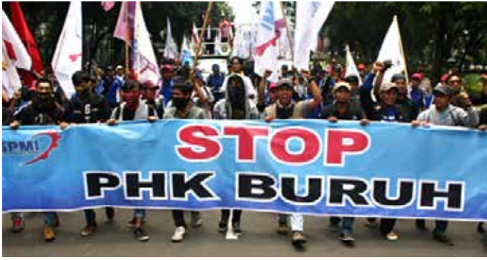
▲인도네시아금속노동조합 노동자들이 정리해고 반대 시위를 하고 있다. 2016.2