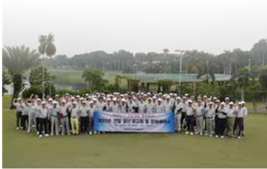
“가능성을 개척하다, KOFA ... 2023년 연말결산 및 경제세미나 열어 경기불황의 눈높이에 맞춰 간결한 연말 송년행사로 치러