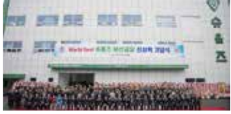
▲ 슈울즈는 6일 조병길 부산시 사상구청장, 윤숙희 사상구청의의장, 윤태한 부산시의원, 김형균 부산테크노파크 원장, 박옥수 국제청소년연합 설립자, 신발산업 관계자 100여명, 슈울즈 전국가맹점연합회 150명, 슈울즈 임직원 100여명 등 350여명이 참여한 가운데 부산 사상구에서 신사옥 준공식을 개최했다.

매출 300억 앞두고, 신발산업 메카 부산에 신사옥 준공 배터리나 별도의 충전 없이 자가발전 이용한 스마트 기능 갖춰 독자 기술로 개발한 진동칩 신발에 접목, 차별화된 상품 경쟁력