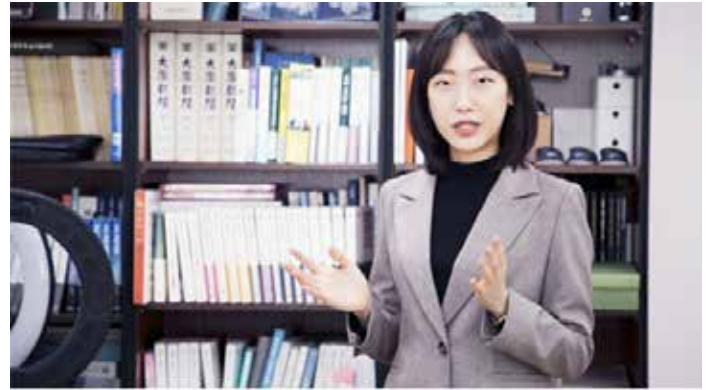
▲트렌드코리아 2019~2024년도 공동저자, 서울대 소비트렌드 분석센터 연구위원

“이전 트렌드 키워드로 ‘팬슈머(Fansumer)’와 ‘디깅’을 소개했다. 올해는 디토소비를 주목해야 한다. 이 키워드는 다 연결돼 있다. 더서웬대(더서웬대 1조원을 돌파했다. 소비자들은 좋아하는 것에 지갑을 여는 팬심이 젊은층에서 두드러졌다. 이처럼, 가격에 제한받지 않고 지갑을 여는 팬심이 중요하다. 브랜드들은 자기만의 브랜드 스토리와 한 사람에 맞는 뾰족한 페르소나를 잘 잡아야 한다. 모든 소비자를 다 잡을 수 없다. 쿨잇, 무신사, 지그재그 등은 각각 다른 소비 연령