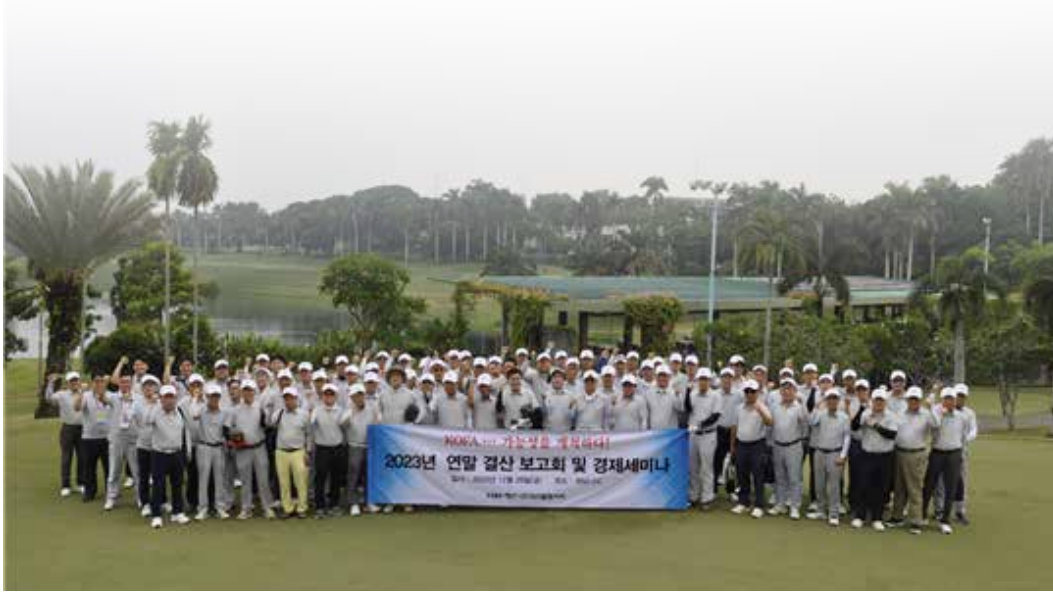
▲재인도네시아 한국신발협회의회 2023년 연말결산 및 경제세미나 행사후 기념촬영

던 신발인의 날 행사를 작금의 어려운 경제상황으로 한인 동포의 체감정서에 맞춰 축소하게 된 점 유감스럽게 생각한다 고 했으며 재인니 한국신발기업은 1985년 인도네시아 진출이후 술한 어려움과 고비를 넘기면서 꾸준한 성장을 해왔고 내년이면