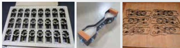
종이, 고무, 가죽, 스폰지,아스테이지, PC, 필름등 모든 자재 커팅금형의 최적금형의 대명사 "틈스 목금형"

우수한 첨단장비로(CAD, Laser, Auto Banding)최상의 틈스 목형을 제공하여 신속성, 정밀성, 경제성 이 월등하며 신발, 자동차부품, 전자부품 절단, 생산하는데 최상의 칼 금형