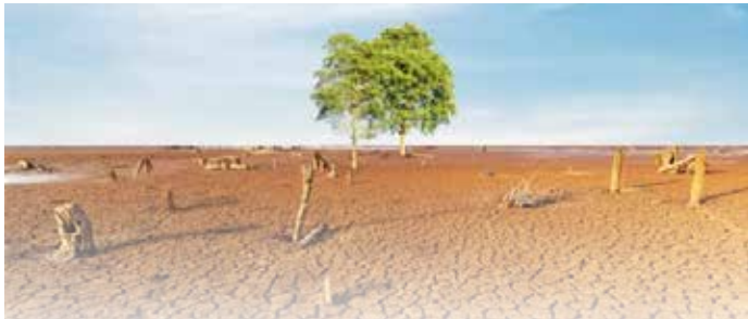
▲MSCI가 2024년 ESG 8대 트렌드를 선정 발표했다. 이상기후에 따른 생산성 저하와 노사갈등을 피하기 위한 대책마련이 중요한 시점이다.

기후변화가 근로자의 건강과 거주지 안전에 미치는 영향이 극단적으로 커지고 있다. 예를 들어 2050년까지 이산화탄소 배출량이 계속 증가한다면 뉴욕 물류창고 근로자의 평균 생산성은 50% 하락할 것으로 예상된다. 이상기후에 따른 생산성 저하와 노사갈등을 피하기 위한 대책 마련이 중요한 시점이다.