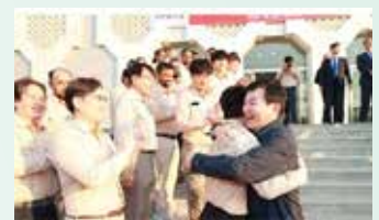
할 수 있도록 국가 차원의 지원이 꼭 필요하다”고 강조했다.

면 마음이 뭉클해진다”며 “막 태어난 아기 재롱은 보지 못한 채 사우디에서도 외판곳에서 일하는 30대 아빠도 잊히지 않는다”고 덧붙였다. 이어 “해외 건설은 단순히 건물을 올리는 것이 아니라 국가의 위상을 높이는 작업”이라며 “그만큼 우리 근로자들이 자부심을 느끼고 일