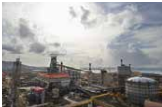
▲인도네시아 크라카타우 포스코(PT. Krakatau POSCO) 전경

크라카타우 포스코, 1550미터톤 강판 생산해 납품 새 수도에 신규 대통령 관저 건설중 수도 건설과 인프라 구축 위해 철강 공급 의지