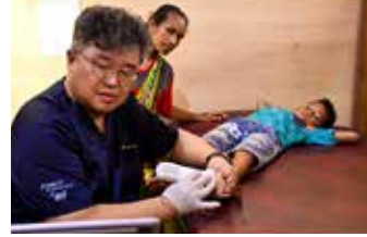
▲포스코인터내셔널은 지난 6.24부터 7.2일까지 인도네시아 파푸아 울릴린 지역에서 지역 주민들을 대상으로 의료 봉사를 실시했다.

다. 2017년부터 고려대 안산병원 로제타 홀 봉사단이 의료 지원에 함께 참여해 본격적인 활동에 나서고 있다. 현재는 인도네시아 파푸아의 보건 의료 환경 개선을 이끄는 지역 대표 의료 봉사활동으로 평가받고 있으며 지금까지 혜택을 받은 주민들은 8천여명에 달한다. 특히 코로나 19로 현장에 방문하지 못하던 기간에도 현지 의료진의 요청에 따라 혈액분석기, 백신저장고, 폐약품처리기 등 다양한 의료 용품을 지원하며 의료 환경 개선에 앞장섰다. 또한 2021년에는 협업기관인 고려대학교 안산병원에서 그동안 의료봉사를 통해 수집한 의료 데이터