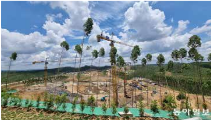
▲정부는 수도 이전을 추진 중인 인도네시아에 한국형 스마트시티를 이용해 줄 것을 적극적으로 요청하고 있다. 사진은 올해 3월 촬영한 인도네시아 보르네오섬 칼리만탄 주 발릭파판 외곽 신수도 예정지인 '누산타라' 모습이다.

이카멘) 페루(쿠스코) 콜롬비아(보고타) 터키(가지안텝/앙카라) 등 4개 나라 5개 도시의 프로젝트입니다.