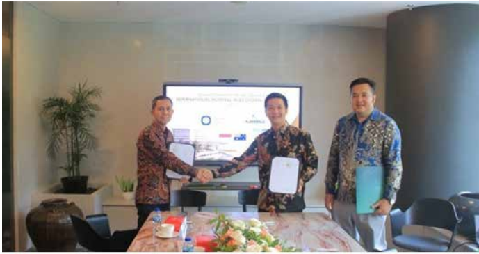
▲인도네시아 부동산 개발기업 바산타그룹(Vasanta Group)은 호주계 의료 서비스 기업 아스펜메디컬 현지 합작사와 바산타 에코 타운(Vasanta Eco Town)에 국제병원 건설에 협력하는 업무협약(MOU)을 맺었다.

바산타·아스펜메디컬, 병상 200개 규모 병원 개발 협약 롯데건설이 투자하는 인도네시아 자카르타 고급 주거단지 프로젝트가 국제병원 유치에 성공했다. 개발 사업이 본격화하고 있다. 인도네시아 부동산 개발기업 바산타그룹(Vasanta Group)은 호주계 의료 서비스 기업 아스펜메디컬 현지 합작사와 바산타 에코타운(Vasanta Eco Town)에 국제병원 건설에 협력하는 업무협약(MOU)을 맺었다고 16일 밝혔다. 양사는 에코타운 내 병상 200개 규모 종합병원을 설립한다