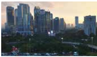
▲자카르타 수디르만 중심상업지구(SCBD) 전경

부동산 컨설팅 회사 콜리어스(Colliers)에 따르면 자카르타의 기업들이 사무실 규모를 줄이기를 원하면서 더 작은 사무실 공간에 대한 수요가 증가하고 있다고 29일 자카르타포스트가 보도했다. 콜리어스는 사무실 규모를 줄이는 것은 기업이 비용을 절감하고 직원 수에 따라 사무실 공간을 최적화하여 효율성을 높이기 위한 전략이라고 말했다.