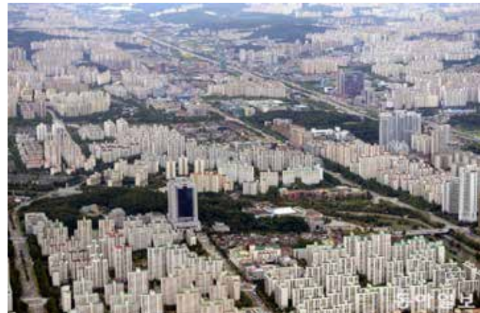
▲정부는 2020년부터 한국형 스마트시티 ‘K-City’ 를 홍보하기 위해 ‘K-City 네트워크 사업’ 을 추진하고 있다. 도시설계가 문제 해결에 한국형 스마트시티 방식을 적용하는 것인데, 올해는 우크라이나 우만 등 8개 도시가 선정됐다. 사진은 분당신도시 전경. 동아일보 DB

대할 수 있기 때문입니다. 건설업계 관계자들은 “해외신도시 개발은 단순히 도로망 상하수도 등과 같은 인프라와 주택을 건설하는 데 그치는 것이 아니다” 며 “관련 시설을 완공한 이후 정보기술(IT)을 이용한 운영 관리 등 지속적인 수요 창출이 가능한 복합 수출상품” 이라고 설명합니다. 단순히 건물