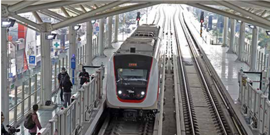
▲LRT 자카르타(Jakarta Light Rapid Transit)가 2019년 6월 11일 첫 번째 공개 시범 운행에 들어갔다.

인도네시아 정부는 자카르타 경전철(LRT) 노선을 서부 자바의 보고르시와 까라왕까지 확장할 계획이다.