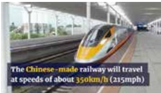
▲중국 일대일로 사업의 일환인 자카르타-반둥 고속철이 오는 8월 완공을 앞두고 있다. [유튜브 캡처]

중국 주도의 일대일로(BRI, the Belt and Road Initiative) 사업에 참여한 일부 국가들이 '중국의 채무 함정' (Chinese debt trap)에 시달리고 있다면서, 인도네시아가 주의를 기울이지 않는다면 위기를 처할 수도 있다는 경고가 나왔다고 최근 인도네시아 언론이 보도했다. 현지 싱크탱크인 CELIOS(경제법률