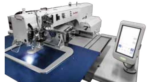
3-칼라 컴퓨터 패턴 재봉기 ST-3020HS-C3