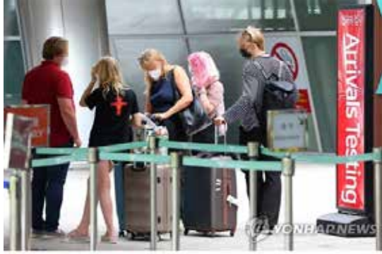
정부...입국 전 코로나19 검사를 폐지할지 여부에 대해 의견 수렴 중