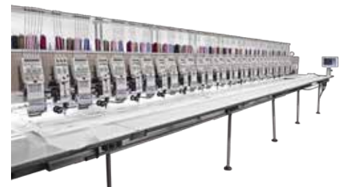
신발 생산 전용 자수기 SFT-10616