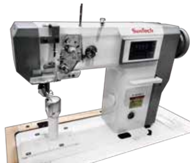
자동 땀폭 조절이 가능한 롤러 포스트 재봉기 ST-666H, ST-777H