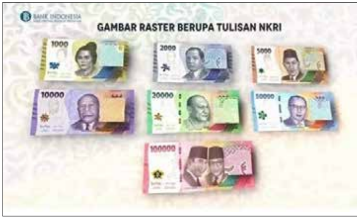
▲ 2022년 8월 17일부터 유통되기 시작한 2022년판 새 지폐

인도네시아 중앙은행(BI)이 8월 18일(목) 2022년도 발행 루피아화 새 지폐 7종의 유통을 공식화했다. 2022년판 새 지폐들은 10만 루피아, 5만루피아, 2만 루피아, 1만 루피아, 5,000 루피아, 2,000 루피아, 1,000 루피아 7종이다. 페리 와르지요(Perry Warjiyo) 중앙은행 총재는 18일(목) 새 지폐 출범식 연설에서 자신과 스리 물야니 인드라와띠 재무장관이 함께 새 지폐 7종의 발행을 공식 선포한다고 말했다. 스리 물야니 재무장관도 1946년 10월 30일 인도네시아 공화국의 첫 화폐가 발행되었을 때 모하마드 하타 부