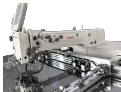
2-칼라 컴퓨터 패턴 재봉기 ST-3020HS-C2, ST-6040HS-C2