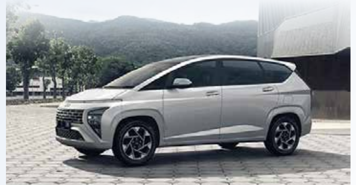
▲ 현대 스타게이저 외관

현대차 인도네시아 차우준 법인은 현대 스타게이저의 출시가 인도네시아에서 게임 체인저가 되겠다는 현대자동차의 약속의 일부라며 "현대 스타게이저는 동급의 새로운 벤치마크로 특별히 디자인되어 혁신적이고 미래지향적인 현대자동차의 상징적인 제품이 되었다. 활발하고 역동적인 인도네시아 커뮤니티의 요구에 따라 현대 스타게이저가 인도네시아에서 매우 긍정적인 반응을 얻을 수 있기를 바란다" 고 말했다.