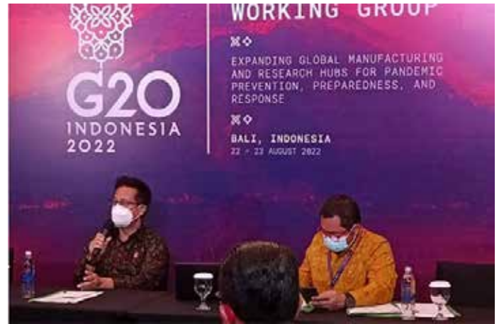
▲ 부디 구나디 사디킨 보건부 장관이(왼쪽) 8월 22일 발리 바동의 누사 두아에서 열린 G20 보건 워킹그룹 회담과 관련한 기자회견을 하고 있다.

인도네시아 보건부 부디 구나디 사디킨 장관은 1980년생 이전 출생자들은 이미 원숭이두창으로부터 지켜줄 항체를 보유하고 있다고 밝혔다. 22일 콰스닷컴에 따르면, 부디 장관은 22일(월) 발리 바동의 누사두아에서 열린 G20 보건 워킹그룹 회담 기자회견에서 영아 시절 수두접종을 받으며 생긴 항체는 평생 유효한데 해당 항체가 원숭이두창에도 방어 효과가 있다는 것이다. 비록 100%까지는 아니지만 분명한 방어효과가 있다고 강조했다. 그는 유럽에 비해 동남아에서 원숭이두창 감염사례가 매우 낮은 것은 수두 백신이 보편적으로 접종되던 시기가 다르기 때문이라고 설명했다. 유럽에서는 수두가 빨리 사라져 관련 백신접종도 빨리 종료되면서 해당 항체를 가진 인구가 상대적으로 적은 반면 인도네시아에서는 수두가 오래 지속되면서 거의 전국민이 백신접종을 받았다는 설명이다. 따라서 1980년 이전에 태어난 사람들은 대부분 원숭이두창에 저항성을 보이는 수두 항체를 가지고 있다고 부디 장관은 설명했다. 부디 장관은 원숭이두창으로 인한 치명률과 사망률은 코로나-19 바이러스에 비해 매우 낮다는 점도 지적했다. WHO 자료에 따르면 지금까지 전세계적으로는 35명이 원숭이두창에 감염되어 12명이 목숨을 잃었으며 그것도 바이러스가 직접 사인이 아니라 그로 인한 합병증 때문이었다. 따라서 비록 인도네시아에서도 이제 첫 감염사례가 발견되었지만 부디 장관은 국민들