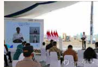
▲ 자카르타 외곽 카라왕 산업단지(KNIC)에서 열린 현대차 그룹과 LG에너지솔루션의 인도네시아 배터리셀 합작 공장 착공식 축사. [자료사진]

또 LG화학 · LX인터내셔널 · 포스코 · 중국업체 화유 등과 컨소시엄을 꾸려 니켈 광산 채굴-제련-전구체 생산-양극재 생산-배터리셀 생산으로 이어지는 ‘패키지