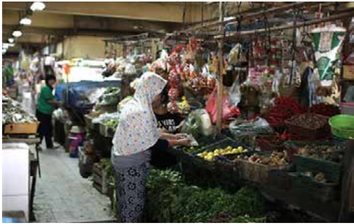
▲동부자카르타의 한 재래시장

인도네시아 소비자물가가 2015년 10월 이후 가장 빠른 속도로 상승함에 따라 인플레이션은 인도네시아 중앙은행(B)과 정부가 이미 수정한 추정치를 넘어섰다고 자카르타포스트가 1일 전했다.