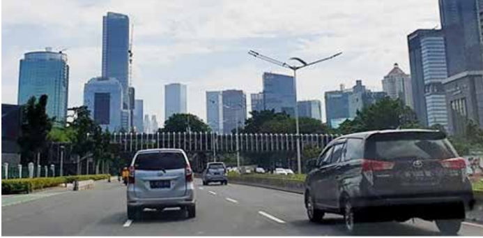
▲ 자카르타 시내 도로를 주행하고 있는 차량들

STNK는 유효기간이 5년이지만 앞으로는 차량소유주가 2년간 자동체세를 내지 않고 STNK를 갱신하지 않으면 삼삿(자동차등록서비스 기관)에서 차량기록을 자동 말소할 전망이다.