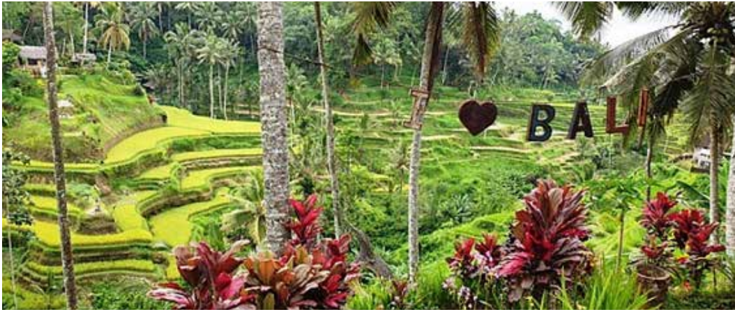
▲ 인도네시아 발리

인도네시아는 인터네이션스(InterNations)가 진행한 엑스펫 인사이더 2022 (Expatriate Insider 2022) 설문조사 결과 국외거주 외국인들이 살기에 가장 좋은 나라 순위 2위에 올랐다.