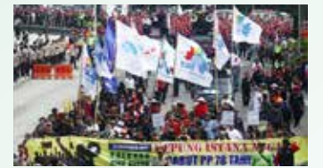
▲2017년 11월 10일 자카르타 시청 앞에서 수천 명의 노동자가 정부가 정한 최저임금 반대 시위를 하고 있다

자카르타 주의 올해 2022년 최저임금이 최종 4,573,845 루피아로 결정됐다. 자카르타주 행정법원(PTUN)은 아니스 바스웨단(Anies Baswedan) 자카르타 주지사에게 2022년 자카르타 최저임금(UMP)을 4,573,845루피아로 정하도록 했다고 폼빠스닷컴 등이 12일 보도했다. 이는 자카르타 주지사가 정한 '2022년 자카르타 최저임금에 관한 주지사 결정 2021년 지방 최저임금법 제 1517조' 에서 정한 최저임금 4,641,854루피아에 대해 자카르타경영자협회(Apindo)가 받아들일 수 없다고 제소해 자카르타 주 행정법원이 12일 승인한 결과다. 올해 최저임금 4,573,845루피아는 2021년 11월 15일자