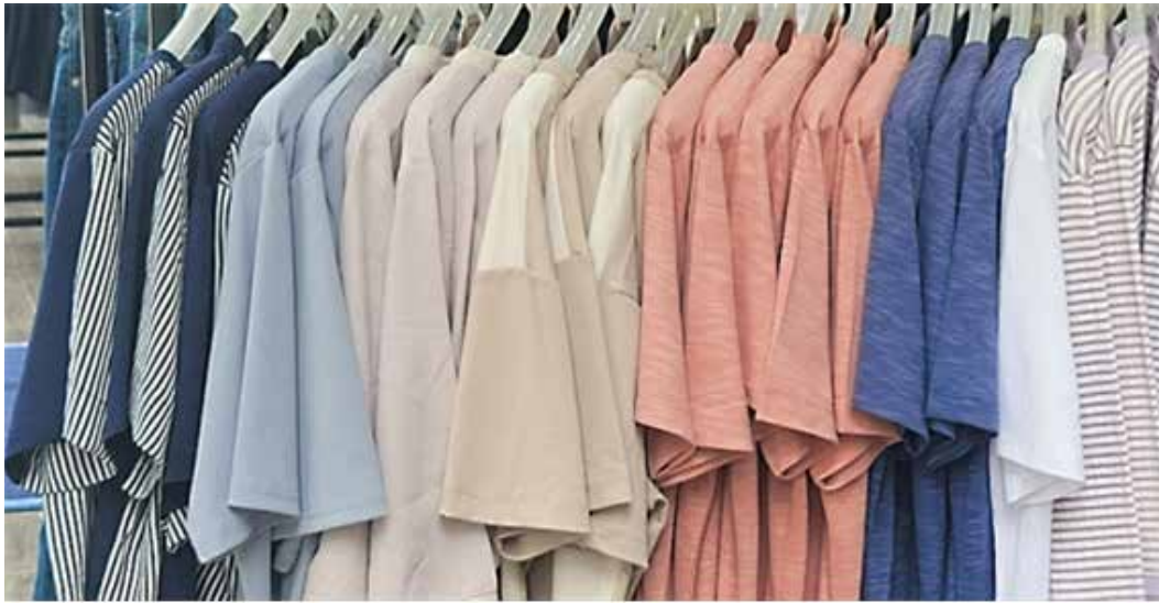
▲해외 브랜드는 이미 상반기 옷값 인상에 나섰다 국내 기업은 올 겨울부터 옷값을 줄줄이 인상할 것으로 전망된다.

올리지 않는 블랙야크는 내년 상품 가격 인상을 검토 중이다. 블랙야크 관계자는 "일부 아이템에 대해 올릴 여지가 있다"고 말했다. 하지만 일부 브랜드들은 상품 가격을 올리기 쉽지 않다. 옷값을 2~3%만 올려도 소비 심리 위축으로 판매가 안 될 것을 염려해서다. 패션기업 임원은 "패션브랜드들은 소비자인 옷, 신발 소비자가 가격 인상을 꺼리는 경향이 있다. 인플레이션으로 물가가 오르면, 소비자들은 옷이나 신발 구매부터 줄인다"며 "전문가들은 내년까지 인플레이션 영향이 계속될 것으로 전망하고 있