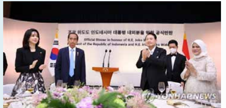
▲윤석열 대통령 내외와 조코 위도도(조코위) 인도네시아 대통령 내외가 28일 오후 서울 용산 대통령실 청사에서 열린 공식 만찬에 참석하고 있다. 2022.7.28

한-인니 정상회담 결과 브리핑... “한국 재계, 인도네시아 투자에 관심 커”