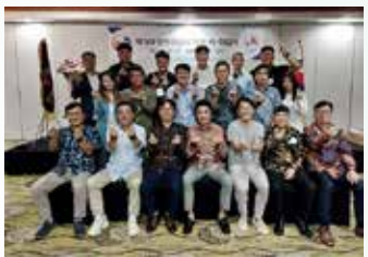
▲제5대 한인청년회 회장선출 및 이취임식

제5대 한인청년회 회장 선출 및 이취임식이 3월 16일 로얄자카르타골프클럽에서 진