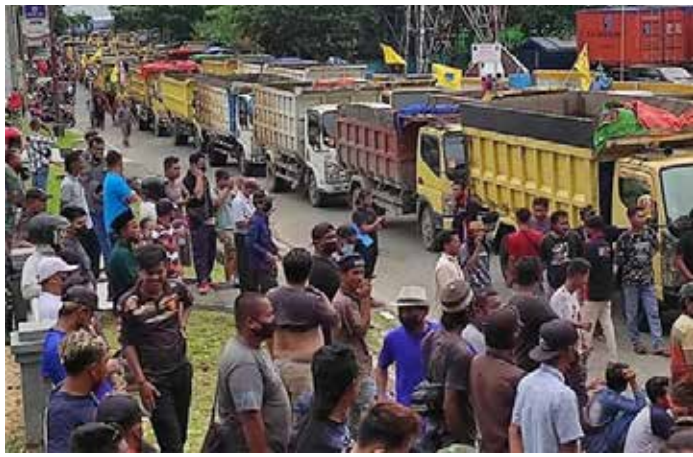
▲ 대학생들과 운전사들로 이루어진 수백 명의 시위대가 디젤 가격 인상과 관련해 빠르타미나 건물 입구에서 시위를 벌이고 있다.

다. 만약 특정 지역의 수요가 증가하거나 유통 교란이 발생할 경우 빠르타미나 빠트라 니아가와 AKR 코르포르인도는 해당 지역 쿼터 총량에 영향을 주지 않는 범위 내에서 각 지역 유통업체들에 대한 할당량을 조정할 수 있다.