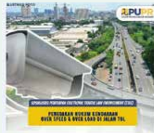
▲스피드건 설치를 알리는 공공사업 및 국민주택부(PUPR) 트위터 게시물

인도네시아 공공사업국민주택부의 고속도로통제청(BPJT)은 공식 트위터 계정에 “고속도로상 제한속도 위반 단속을 위한 트랜스 자바