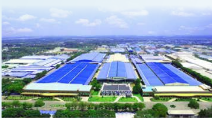
아디다스 신발 등의 OEM을 맡고 있는 화승엔터프라이즈도 NH PE의 증자에 맞춰 대영섬유에 400억원을 추가 투

자하기로 했다. 화승과 NH PE가 대영섬유의 증자에 나선 것은 동남아시아와 중국 등에서 신발과 스포츠 의류 판매 등이 급성장하자 베트남 공IB업체의 한 관계자는 “화승엔터프라이즈는 대영섬유 인수 후 기존 고객인 아디다스 외에도 나이키 등 글로벌 고객사를 확보했다”며 “베트남 공장 증설로 나이키 제품의 위탁생산을 확대할 수 있을 것”이라고 말