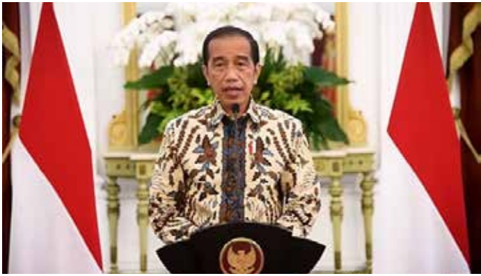
▲23일 조코 위도도 대통령이 자카르타 소재 머르데카 궁에서 온라인 기자회견을 하고 있다.

조코 위도도 대통령은 23일 머르데카 궁에서 진행된 온라인 기자회견에서 코로나 백신 2회 기본접종과 부스터샷 접종까지 마친 사람들에게 한해 올해 이틀 피트리 축일을 전후해 귀성(mudik) 허용 방침을 밝혔다. 귀성길의 모든 활동은 코로나-19 예방을 위한 철저한 보건수칙에 따라야 함도 덧붙였다. 정부의 이번 귀성 허용방침은 올해 라마단 금식월과 이틀피트리 축일이 다가오는 가운데 코로나-19 팬데믹 상황이 크게 호전되고 있다는 낙관적 전망 속에서 나왔다. 코로나가 한창이던 2020년과 2021년 인도네시아 정부는 2년 연속 무딕을 공식적으로