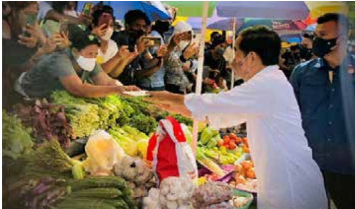
▲조코위 대통령이 동부누사 가라주 꾸뵙 지역의 시장을 방문해 상인들에게 현금 보조금을 지급하고 있다. [자료사진=조코위 대통령 페이스북]

통상 르바란 연휴는 열흘 이상 지속하고, 이때 무려 2천500만명 안팎이 귀향길에 오르는 ‘무딕’(Mudik)이 이어진다.