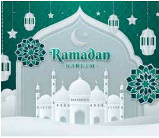
인도네시아 라마단 시작 : 4월1일부터 5월 1일 까지