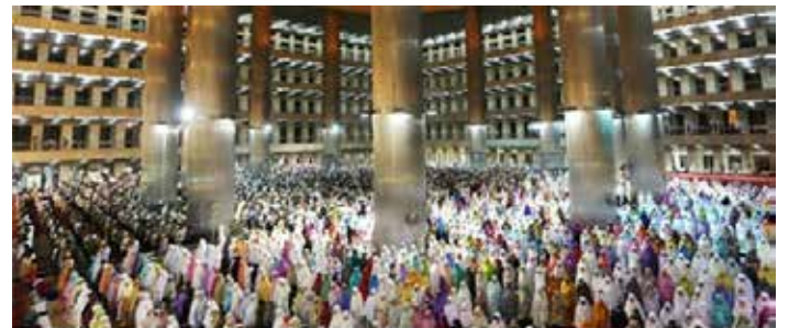
▲ 인도네시아에서 가장 큰 이슬람사원인 이스티클랄 사원 내부.

는 인도네시아라며, 모스크와 기도실이 총 80만개소에 달하며, 지방에서는 220명당 1개의 사원이 있다고 말했다. 깔라 위원장은 인도네시아에 주 5일제 근무가 확대되면서, 의무예배가 있는 금요일에 근무시간이 늘어나면서 각급 학