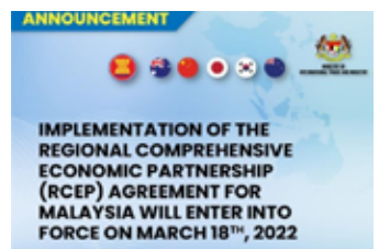
▲ 말레이시아에서도 18일 RCEP 공식 발효

이어 코로나19 팬데믹의 충격으로부터 경제가 점차 회복함에 따라 RCEP은 역내 무역장벽을 없애고, 기업과 경제활동을 재도약시킬 중요한 도구 가 될 것이라고 강조했다. RCEP은 아세안 10개국(브루나이·캄보디아·인도네시아·라오스·말레이시아·미얀마·필리핀·싱가포르·태국·베트남)과 비아세안 5개국(호주·중국·일본·한국·뉴질랜드) 등 총 15개국이 참여하는 다자무역협정이다. 전 세계 국내총생산(GDP), 인구, 교역 규모의 3분의 1을 차지하는 세계 최대 규모의 자유무역협정(FTA)이다. RCEP은 2020년 11월에 체결됐고, 협정문 내 발효 규정에 따라 당사국별로 아세안 사무국에 비준서를 기탁한 지 60일이 되면 정식 발효된다. 중국과 일본 등 10개국에서는 올해 1월 1일 발효됐고, 한국