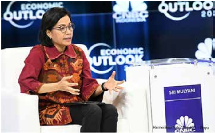
▲ CNBC인도네시아 경제전망2022에 참석한 스리 물리야니 재무부 장관

인도네시아 재무부 스리 물리야니 인드라파따 장관은 소비재 가격 급등에도 4월 1일부터 부가가치세(VAT)를 인상할 것이라고 22일 밝혔다. 지난해 통과된 조세조화법은 부가가치세를 현행 10%에서 올해 11%, 3년 뒤 12%로 인상하도록 규정하고 있다. 또한 이 법은 부자들에게 대한 소득세를 인상하고, 법인소득세 인하안을 백지화하고, 탄소세를 도입한다. 재무장관은 정부가 재정 건전화 계획을 달성하기 위해 조세 정책을 개혁할 필요가 있다면서 사회 지원 프로그램을