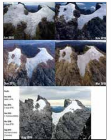
▲ 파푸아 뽀짜자야산 만년설 연도별 변화 [인도네시아 기상 전문가 도날디 트위터]

지구 온난화로 산 정상에 내리던 눈이 빙하 형태로 내리면서 기존 빙하를 녹이고, 빙하가 녹을수록 주변 암석이 어둡게 변하면서 열을 더 많이 흡수해 맞닿은 빙하를 더 많이 녹이는 효과가 발생한다고 당국은 설명했다. [연합뉴스]