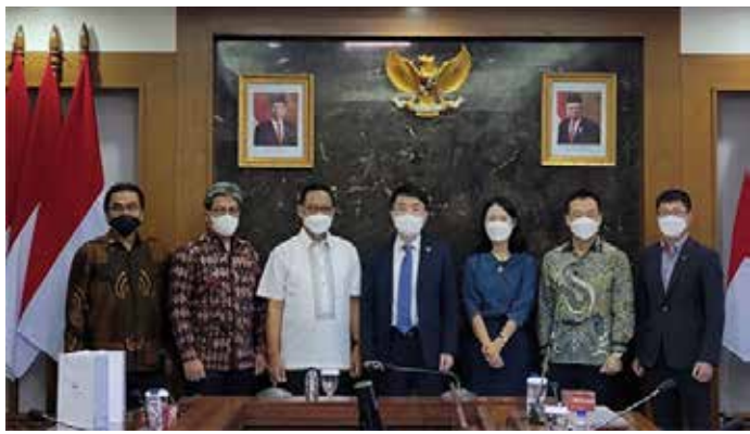
▲윤성원 국토부 제1차관이 밤방 수산토노 신수도부 장관(왼쪽에서 두번째) 등과 함께 면담 후 기념촬영을 하고 있다.

국토교통부가 우리나라와 인도네시아 간 인프라 사업 확장을 위한 협력 방안을 논의했다.