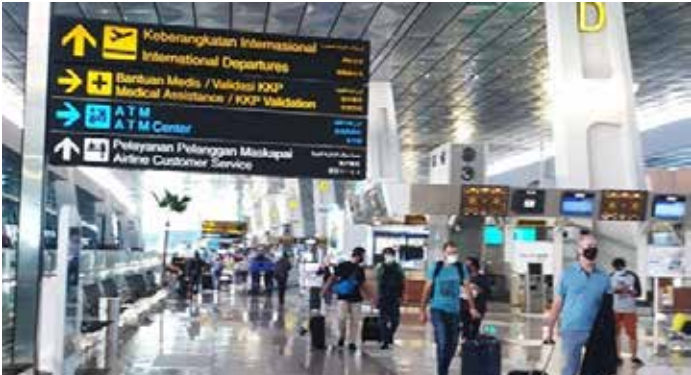
▲수카르노-하타 국제공항 3터미널 (사진=자카르타경제신문)

인도네시아 교통부는 수카르노-하타 공항을 통해 인도네시아로 입국하는 외국인 관광객에 대한 입국 금지를 철회했다.