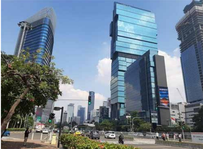
▲ 인도네시아 수도 자카르타 시내 전경

인도네시아의 지난해 경제성장률이 3.69%를 기록하면서 코로나19 사태가 처음 발생한 2020년도 마이너스 성장에서 벗어났다. 다만 코로나19 변이 오미크론이 급속 확산하면서 올해 회복세의 발목을 잡을 수 있다는 관측이 나온다. 7일 인도네시아 통계청(BPS)은 2021년 국내총생산(GDP)이 전년 대비 3.69% 증가했다고 발표했다. 마고 유원노 통계청장은 “보건 회복이 경제 회복의 중요한 요소다. 지난해 코로나19 팬데믹 영향이 줄어 경제성장이 이뤄졌다”며 “2022년도 일일 확진자 수가 줄고, 이동성이 늘어나 경제 회복세가 유지되길 바란다”고 기자회견에서 말했다. 2021년도 분기별 성장률을 보면 1분기 -0.70%, 2분기 7.07%, 3분기 3.51%, 4분기