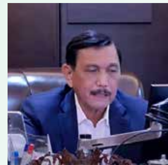
▲루훗 빈사르 판자이탄 해양투자조정 장관