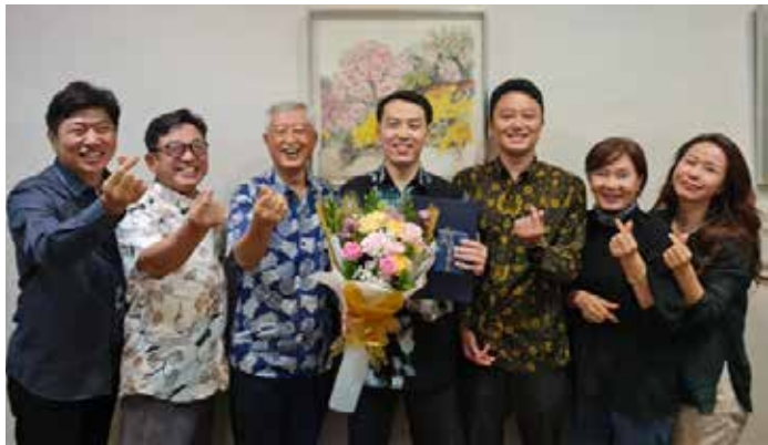
PT.NOTOS 강원구법인장 주인도네시아 대한민국대사 표창 수상