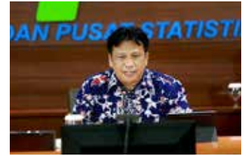
▲마고 유워노 통계청장

인도네시아 통계청 (BPS)은 2021년 경제 성장률이 3.69%로, 2020년 성장률 -2.07% 보다 높다고 밝혔다. 마고 유워노(Margo Yuwono) 통계청장은 7일 기자회견에서 2021년 전체 경제 성장에 가장 높은 비중을 차지한 산업은 가공산업으로 1.01% 비중을 차지했다고 말했다고 7일 비즈니스닷컴이 보도했다. 가공산업은 연간 아니라 2021년 4분기에도 4.92% 기록하여, 22.61% 성장한 운송 산업과 11.31% 성장한 기초 금속 산업의 뒤를 이었다. 통계청에 따르면 가공산업 중 광산 부문은 주석, 페로니켈 및 보크사이트 생산 증가로 성장하였으며, 석탄 산업과 식용유 및 석유와 가스도 8.58% 성장하였다고 밝혔다. 또한 마고 청장은 2021년 4분기 성장을 주도한 부문은 가계 소비와 투자로 가계 소비는 3.55% 증가했고 투자는