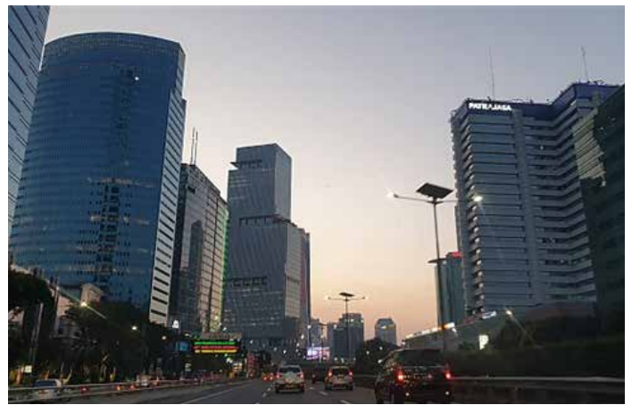
▲자카르타 시내 도로

2009년 도로교통법으로 해당 규정이 바뀌었지만 여전히 도로 현장에서 경찰이 좌회전을 허용하는 경우도 있었고 해당 표지판이나 교통신호장치가