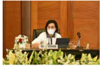
▲인도네시아 재무장관 스리 물리야니 인드라와띠

신차에 대한 최근의 세금 혜택은 이전과 같이 지역과 엔진 용량에 근거하는 대신 차량 가격에 근거할 것으로 가격이 2억 루피아 이하이거나 2억~2억5000만 루피아 사이 자동차는 사치세(PPnBM)를