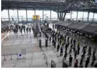
▲태국 수도 방콕 외곽의 수완나품 국제 공항.

코로나19 오미크론 변이 확산 우려에도 동남아의 대표적 관광지인 태국과 인도네시아가 입국 규제를 완화했다.