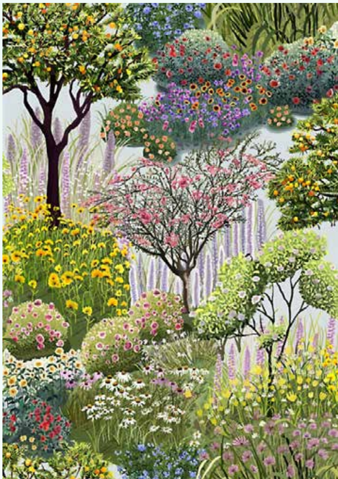
▲작품명 : 제인의 정원 / 최소담 작