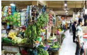
▲자카르타 재래시장