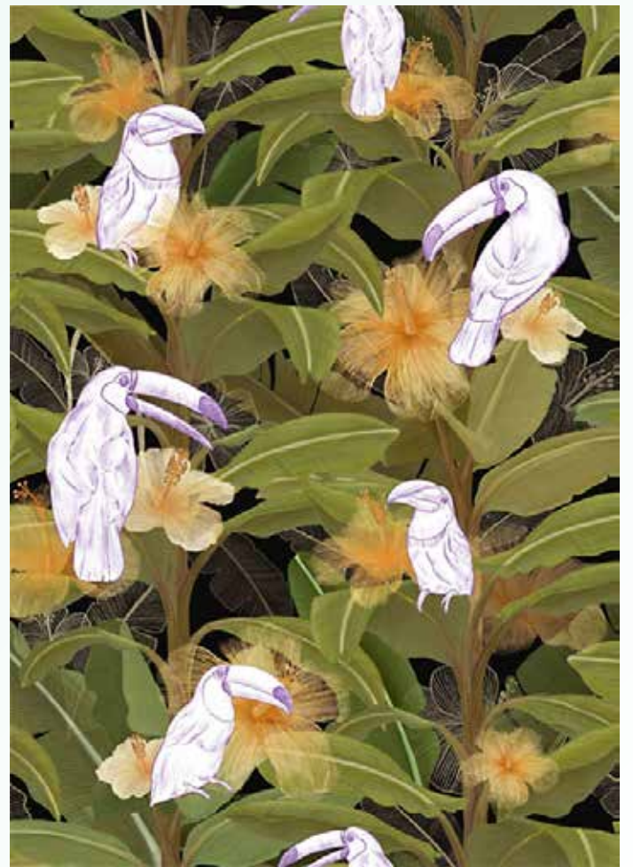
▲작품명 : Toco Toucan in the rain forest / 정이슬 작