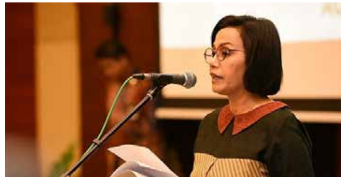
▲인도네시아 재무장관 스리 물리야니 인드라와티(Sri Mulyani Indrawati)

인도네시아 재무부는 세수 목표치가 예년보다 낮았지만 기업활동 회복과 높은 원자재 가격으로 12년 만에 연간 징수 목표를 초과 달성했다고 28일 자카르타포스트가 보도했다.