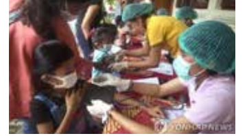
▲ 사진설명인도네시아 초등학생들이 노백 백신 접종받는 모습

인도네시아 정부가 신종 코로나바이러스 감염증(코로나19) 오미크론 변이의 비교적 짧은 잠복기를 감안해 입국자 지정호텔 격리기간을 10일에서 7일로 단축하기로 했다.