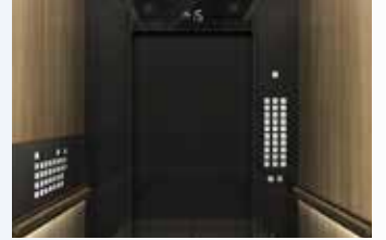
▲현대건설이 현대엘리베이터와 협업해 개발한 ‘FANTASTIC RIDE’의 네이처 컨셉 전면

현대건설이 힐스테이트 입주민들에게 새로운 엘리베이터 디자인인 ‘FANTASTIC RIDE’를 선보인다. 이번 ‘FANTASTIC RIDE’ 프로젝트는 엘리베이터를 단순한 이동 수단이 아닌, 입주민들이 새로운 경험을 할 수 있는 공간으로 탄생시키기 위해 진행되었다. 현대건설은 이를 위해 현대엘리베이터와 함께 작년말부터 연구개발을 진행하여 샘플 설계까지 약 18개월의 시간을 통해 완성하였다. 어두운 지하주차장을 화려한 갤러리로 탈바꿈시킨 ‘5 second 갤러리’의 뒤를 이을 디자인 프로젝트로 엘리베이터에 세련미를 더하는 동시에 사용자의 편의까지 고려한 디자인이 적용된다. 이번에 새롭게 개발된 디자인은 반짝이는 밤하늘의 별에서 모티브를 얻어 ‘별빛’이라는 컨셉으로 안에서 별이 쏟아지는 광경을 느낄 수 있도록 움직이는 LED 조명을 설계했고, 엘리베이터 천정고를 10cm 높여 공간감을 극대화했다. 벽면 마감에는 대형 사이즈의 흑경을 추가해, 천정에 빛나는 별빛이 연속되는 새로운 경험이 가능한 디자인을 구현했다. 이외에도 엘리베이터 하부와 손잡이 부분인 핸드레일에 조명을 추가해 고급스러움을 강조했으며, 엘리베이터 내부 입력 버튼에는 고급 호텔 엘리베이터에나 사용되는 텍스트 버튼을 적용하며 디자인을 고