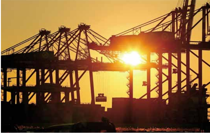
▲ 2022년 임인년(壬寅年) 새해가 밝았다. 새해 첫날부터 분주히 움직이는 인천신항 수출입 컨테이너 크레인 위로 한국경제의 희망찬 미래를 밝히는 태양이 떠오르고 있다. 지난해 우리나라는 코로나19 여파에도 수출·무역액이 사상 최대치를 기록했다. 새해에도 호황의 기운으로 물동량이 넘쳐나 컨테이너부두의 크레인들이 쉼 없이 움직일 것으로 기대된다.

지구촌 호령하는 K-수출 반도체, 조선, 자동차 등 주력산업 탄탄한 경쟁력 갖춰... 성장세 견인 을 수출, ‘7000억달러’ 시대 진입 세계 5위권 교역국 발돋움 정조준