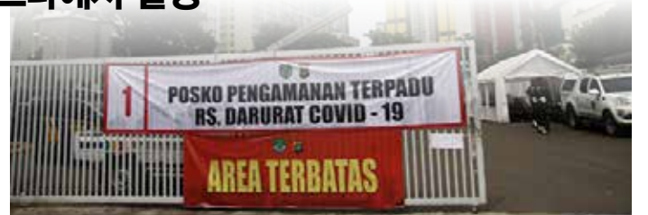
▲코로나-19 격리병원으로 개조한 꼬마요란 아시아안선수출 아파트(위스마 아틀렛) 사진=자카르타경제신문/Aditya

크론 전체 사례 중 239건이 해외 유입 사례이며 지역 감염은 13건이다. 모든 오미크론 변이 감염자는 꼬마요란 위스마 아틀렛과 솔리안티 사로스 감염병 병원(RSPI Sulianti Saroso)에 있다”고 밝혔다. 리자는 오미크론 변이 확산을 방지하기 위해 모든 자카르타 주민 및 해외출국자들에게 보건수칙을 지키고 마스크를 벗지 말라고 당부했다.