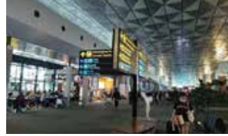
▲ 사진설명인도네시아 자카르타 외곽 수카르노-하타 공항