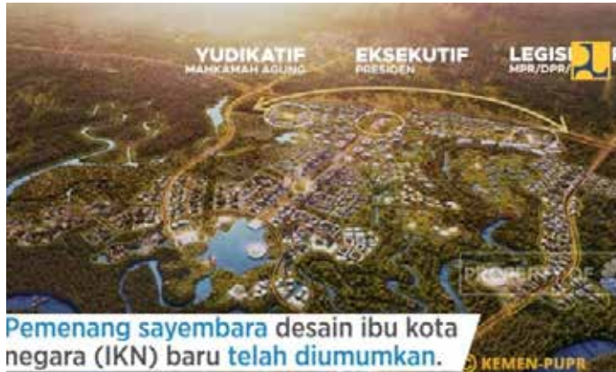
Pemenang sayembara desain ibu kota negara (IKN) baru telah diumumkan.