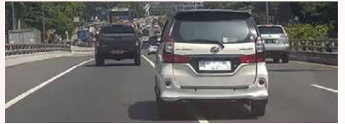
▲ 흰색 바탕 검정 글씨의 BE 번호판을 단 차량이 도로를 달리고 있다.

현재 전자식 교통단속 시스템에 탑재된 차량번호 자동인식 기술로는 차량 번호판 인식할 뿐 차량번호판 자체의 위조 여부는 분별할 수 없다.