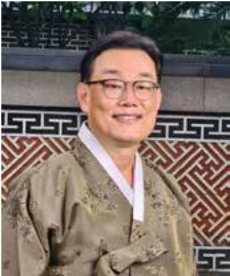
존경하는 인도네시아 한인 동포 여러분, 임인(壬寅)년 검은 호랑이의

새해가 밝았습니다. 호시우행(虎視牛行)과 같이 성실하게 한 걸음씩 앞으로 나아가는 동시에 호랑이의 예리함과 용맹함이 더해지는 한 해가 되길 기원합니다.