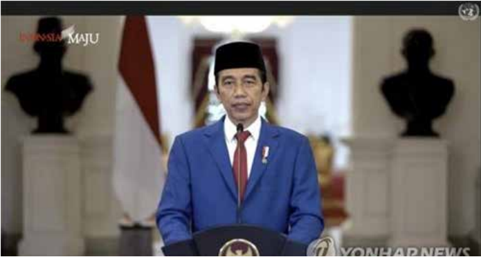
▲조코위 유엔 연설서 “모두 안전할 때까지 아무도 안전하지 않아”

조코 위도도 인도네시아 대통령은 22일(현지시간) 제75차 유엔총회 화상 연설에서 신종 코로나바이러스 감염증(코로나19) 대응을 위해 뭉치지 않고, 오히려 분열·경쟁하는 국제사회 분위기를 우려했다. 23일 인도네시아 대통령궁에 따르면 조코위 대통령은 연설에서 “팬데믹과 싸우기 위해 단결해야 할 시점에 깊은 분열과 경쟁을 키워가는 모습을 보고 있다”며 “국가 간의 상호 이익을 위해 단결하고, 윈-윈 접근법을 추진해야 한다”고 촉구했다.