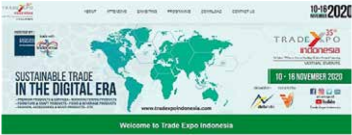
트레이드 엑스포 인도네시아(TEI) 홈페이지 캡처

인도네시아 아구스 무역장관은 21일 신종 코로나 바이러스(코로나19)에 따라 올해로 35회째를 맞이하는 수출입 상품 박람회 '트레이드 엑스포 인도네시아(TEI)'를 온라인으로 11월 10일부터 16일까지 7일까지 개최한다고 밝혔다. 현지 언론 끈판 22일자 보도에 따르면 아구스 무역장관은 "온라인 TEI는 각종 수출 제