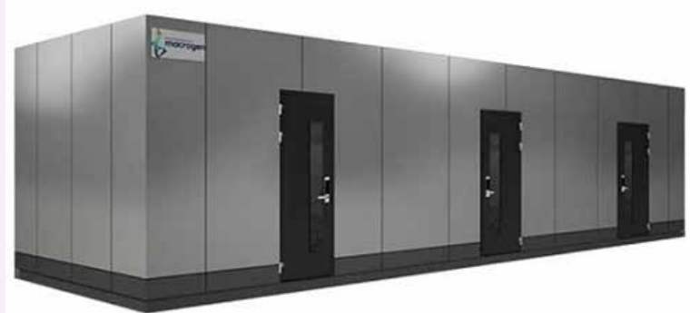
▲ 마크로젠 '스마트 모바일 랩'

바이러스 유전물질 추출과 실시간 유전자 증폭 방식(RT-PCR) 검사까지 가능하며, 표준운영지침과 검사인력