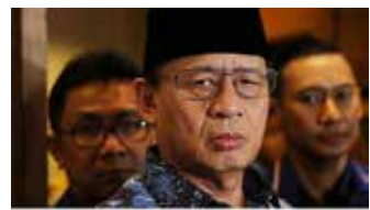
▲인도네시아 반뜰주 와히딘 할림 주지사

인도네시아 반뜰주 와히딘 할림 주지사 인도네시아 반뜰주가 21일 대규모사회적제약(PSBB)을 10월 20일까지 연장한다고 밝혔다. PSBB 실시기간은 각각 지자체가 감염 상황에 따라 결정한다. 반뜰주는 당초 예정에서 1개월 연장했다. 반뜰주는 7일 땅으랑군, 땅으