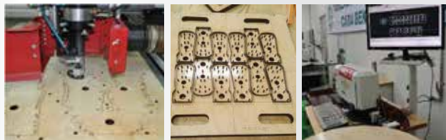
철판,아크릴, 합판, 뼈그라이트등 레이저커팅