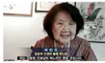
▲ 장윤원 선생 며느리 뽀완 조 (왼쪽), 마루프 아민 인도네시아 부통령 축하 영상