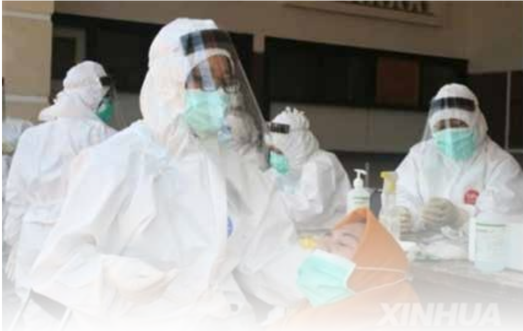
▲ 코로나19 검사하는 인도네시아 의료진

인도네시아에서 신종 코로나 바이러스 감염증(코로나19) 신규 확진자가 매일 3천명 넘게 발생하고, 백신 보급까지 확산세가 계속될 것으로 전망되면서 한인 사회가 바짝 얼어붙었다.