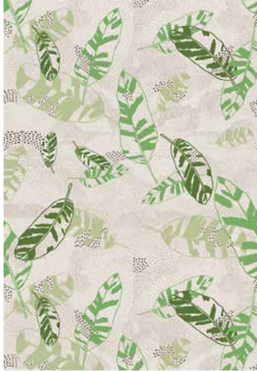
▲ Jungle Escape 조재원 작