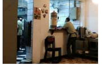
▲ 자카르타 식당

지난 몇 년 동안 인도네시아 노동자들은 코로나 대유행으로 인한 경기 침체로 공장들이 직원들을 해고하면서 서비스업 일자리를 눈을 돌렸다. 그러나 최근 자료에 따르면 고학력 인적 자원이 부족해 상대적으로 임금이 낮은 전통적인 부문에 노동자가 집중되고 있다고 자카르타포스트가 5일 보도했다. 인도네시아 통계청(BPS)의 최신 자료에 따르면 도소매, 무역, 숙박 및 음식 서비스업, 운송 및 창고업 등 전통적인 부문은 2021년 8월 인도네시아 노동력의 대부분을 고용하고 있다고 밝혔다. 이에 비해 선진국에서는 보건, 교육, 금융, 비즈니스 서비스 및 IT와 같은 산업에 더 많은 고용이 이루어지고 있다. 국영 만다리은행 이코노미스트 파이살 라흐만(Faisal Rachman)은 지난 2월 25일 특히 공공 이동수단과 관련된 서비스 부문이 대유행으로 인해 상당히 심각한 타격을 입었으나 이동 규제가 완화되면 이 분야들은 더 빨리 반등할 수 있을 것이지만 이에 비해 제조업은 가속화하는 데 시간이 필요하다고 말했다. 2,570만 명 이상의 근로자들이 도소매업에서 일하며, 이는 전체 서비스 인력의 거의 40%를 차지하고 있으며, 숙박 및 음식업 종사자가 전체의 14.2%를 차지해 이 부문은 두 번째로 많은 고용이 이루어지고 있다. 이들 주요 서비스업 종사자 대부분은 직업교육이나 대학 교육 미만이다. 예를 들어 숙