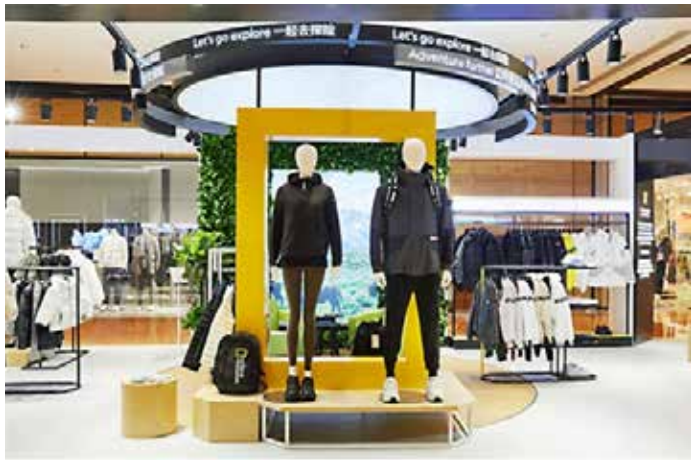
▲ '내셔널지오그래픽어패럴'은 중국 베이징에서 지난달 14일부터 5주간 운영한 팝업 스토어의 5주간 매출이 100만 위안(약 1.9억 원)을 돌파했다.

더네이처홀딩스(대표 박영준)의 '내셔널지오그래픽어패럴(이하 내셔널지오그래픽)'은 중국 베이징 팝업 스토어 성공에 힘입어 중국시장 확대에 나선다. 중국 베이징에서 팝업 스토어를 운영한 5주간 매출 100만 위안(약 1.9억 원)을 돌파했다고 21일 밝혔다. 이는 국내 기준 인기 의류 브랜드 매장의 매출 중 상위권에 해당한다. 지난달 14일 중국 베이징 왕푸징 소재 대형 쇼핑몰 WF 센