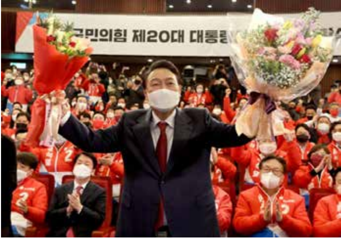
윤석열 대통령 당선 ... 5년만에 정권교체