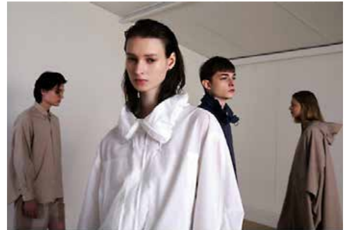
▲ '내셔널지오그래픽어패럴'은 중국 베이징에서 지난달 14일부터 5주간 운영한 팝업 스토어의 5주간 매출이 100만 위안(약 1.9억 원)을 돌파했다.