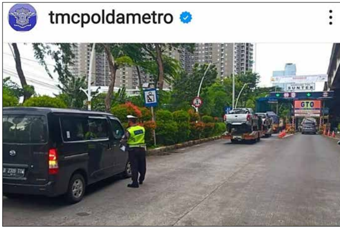
▲ 경찰이 순터(Sunter) 톨 입구에서 지나가는 차량에 '위대한 치안 작전 2022' 브로셔를 배포하고 있다.

자카르타 메트로자야 지방경찰청은 '위대한 치안 작전 2022' (Operasi Keselamatan Jaya 2022)라는 작전명의 교통위반 차량 단속을 시작했다.