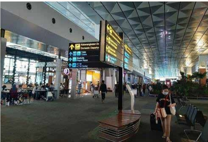
▲ 인도네시아 자카르타 외곽 수카르노-하타 공항

인도네시아 정부가 코로나19 백신 접종을 완료한 국내 여행객의 코로나19 검사 의무를 폐지했다. 또 추가 접종(부스터샷)을 접종한 시민들에 대해서는 스포츠 경기 관람을 허용하고, 관