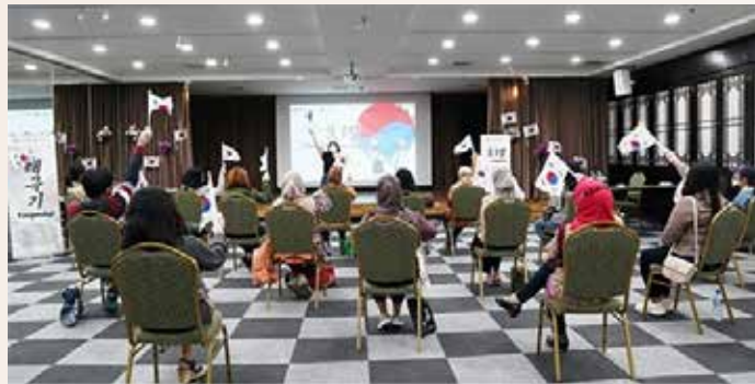
▲ 제103주년 3.1절 기념행사- 인도네시아인과 함께 외친 '대한독립만세'

주인도네시아 한국문화원(원장 김용운)은 2월 27일(일) 제 103주년 3.1절을 기념하여 인도네시아 국민들에게 한국의 역사 속 3.1절의 의의를 소개하기 위한 행사를 문화원에서