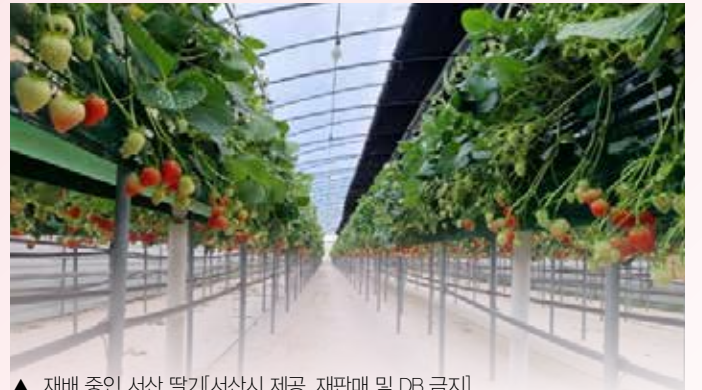
▲ 재배 중인 서산 딸기

맛과 향이 뛰어난 충남 서산 딸기가 미국 등에 이어 인도네시아 첫 수출길에 오른다. 서산시는 농업회사 법인 해미읍성 딸기 와인에서 생산한 딸기 240kg이 3일 항공편으로 인도네시아에 수출된다고 2일 밝혔다. 현지 반응에 따라 점차 물량을 늘린다. 서산 딸기는 2017년 미국에 2