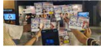
▲ 다큐멘터리 4편을 정주행 한 참가자들의 인증샷

시대를 바꾼 아티스트, 데뷔의 순간' 인도네시아 순회상영 이난영의 '목포의 눈물' 부터 BTS "Permission to Dance '까지