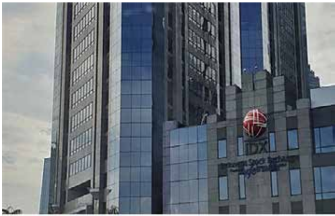
▲ 인도네시아 증권거래소

러시아군이 우크라이나를 침공함에 따라 인도네시아는 자국 경제와 자본시장에 직접적인 영향은 거의 없지만 투자자들은 위기에 만전을 기하는 것이 좋을 것이라고 자카르타