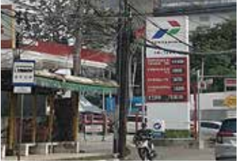
▲ 국영석유가스회사 빠르따미나 주유소

국영 석유가스 회사 빠르따미나(Pertamina)는 2월 27일부터 국제 가격 인상에 따라 비보조 액화 석유 가스의 가격을 킬로그램 당 15,500 루피아로 인상했다. 이는 지난해 12월 kg 당 가격이 11,500루피아에서 13,500루피아로 오른 지 불과 몇 달 만에 나온 것이다.