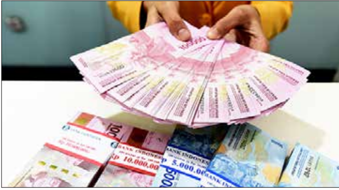
▲ 루피아 지폐

인도네시아 노동부(Kemena-ker)는 이슬람 최대 명절 르바란 이전에 기업이 직원들에게 지급해야 하는 종교축일수당(THR)에 대해 '명절 7일 전까지 지급' 할 것을 요청했다.