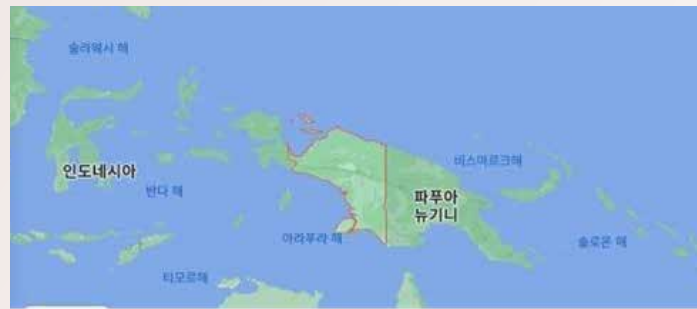
▲ 뉴기니섬 서쪽 절반 인니령 파푸아와 동쪽 절반 파푸아뉴기니

인도네시아에 편입된 파푸아에서 계속 무력 항쟁과 반정부 시위가 날로 격화하고 있다.