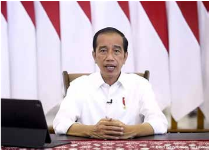
▲ 조코 위도도 대통령이 4월 6일 대통령궁 유튜브 채널을 통해 르바란 유급휴가대체일을 발표하고 있다

조코 위도도 대통령은 6일 온라인 기자회견을 통해 올해 르바란 유급휴가대체일(Cuti Bersama)을 발표했다. 조코위 대통령은 5월 2일과 3일은 이돌 피트리(Idul Fitri) 국경일로 정하고, 4월 29일, 5월 4일, 5일, 6일을 유급휴가 대체일(Cuti Bersama)로 지정한다고 밝혔다. 이에 대한 구체적인 결정은 관계부처 합동 의결을 거쳐 정한다고 덧붙였다. 이로써 올해 르바란 연휴는