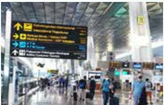
▲ 수카르노하타 국제공항 3터미널

인도네시아 정부는 법무부 이민국을 통해 해외입국자의 관광 및 방문을 위한 도착비자 발급 정책 범위를 확대하고 4월 6일부터 적용한다고 5일 발표했다.