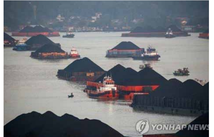
▲ 인니 동칼리만탄서 촬영된 바지선에 실린 석탄