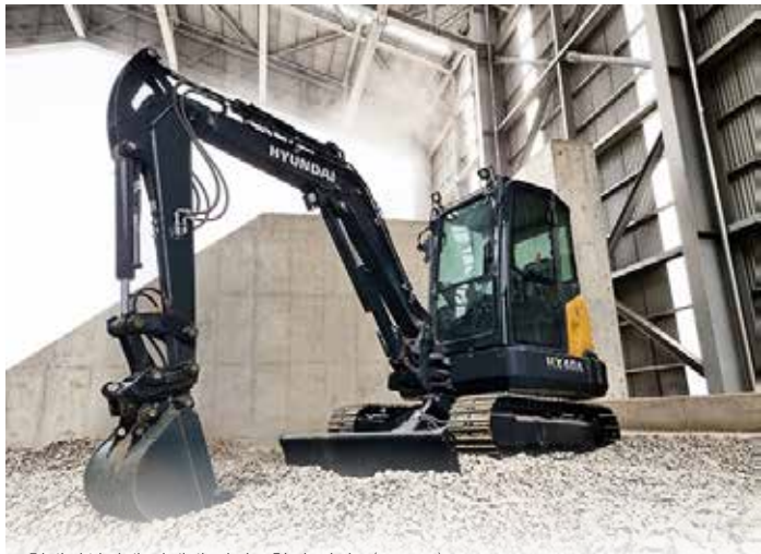
▲현대건설기계 차세대 미니굴착기 시리즈(HX40A).

현대제뉴인(현대중공업그룹 건설기계부문 지주사) 계열사인 현대건설기계가 디자인계의 오스카상으로 불리는 '2022 레드닷 디자인 어워드(Reddot Design Award 2022)' 에서 본상을 수상했다. 현대건설기계는 최근 진행된 '2022 레드닷 디자인 어워드' 에서 자사의 차세대 미니굴착기 시리즈 3종(HX35Az,