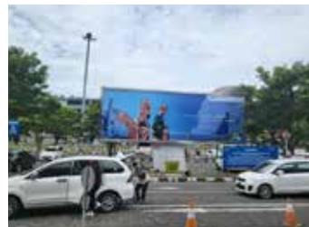
▲한산한 발리 응우라라이공항의 모습

인도네시아 정부는 작년 10월 14일부터 발리, 민탄, 바탐 등 3개 섬에 백신접종 완료자의 관광을 허용했으나 격리가 길고 비자 발급, 보험가입 등 입국 조건이 까다로워 방문객이 극소수에 그치자 대폭 정책을 수정했다. 지난달부터 발리에는 일본 도쿄, 싱가포르, 호주에서 오가는 여객기 정기노선이 부활했다. 다만, 인천~발리 노선 부활과 관련해 아시아나항공 등은 좀 더 검토가 필요하다는 입장이다. 말레이시아도 주변 국가와 백신접종 완료자의 무격리 입국을 확대 허용하고 있다. 말레이시아 교통부는 '백신접종자 여행통로(VTL)제도'를 오는 15일부터 태국, 캄보디아로 확대한다고 전날 발표했다. 말레이시아 쿠알라룸푸르~태국 방콕 여객기는 매일 최대 6편, 쿠알라룸푸르~태국 푸켓 노선은 매일 최대 4편까지 운항할 수 있고, 쿠알라룸푸르~캄보디아 프놈펜 노선은 매일 최대 2편까지 띄우기로 합의했다. 말레이시아는 작년 11월 29일부터 싱가포르와 무격리 입국을 시작했고, 브루나이와도 조만간 무격리 입국을 허용키로 했다. 인도네시아와 말레이시아의 코로나19일일 확진자는 오미크론 변이 확산으로 최근 3만 명 안팎을 오르내리고 있다. [연합뉴스]