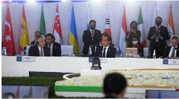
▲ 인도네시아, G20 의장국 선출 2021.10.31