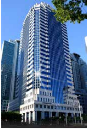
▲ 전문건설회관 전경.

전문건설공제조합(이사장 유대운, 이하 전문조합)이 2021년 1,451억원의 흑자를 기록했다고 7일 발표했다. 지난 2019년 기록한 역대 최대 흑자인 1,452억원과 불과 1억원 차이이다.