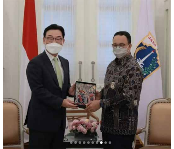
▲아니스 바스웨단 자카르타 주지사가 박태성 대사에게 기념품을 전달하고 있다.

박태성 주 인도네시아대사가 4일 자카르타 주정부 청사에서 아니스 바스웨단 자카르타