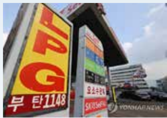
▲서울 내 가스충전소 가격 안내판 모습. 2022.3.1

국제 신용평가사 무디스는 러시아의 우크라이나 침공에 따른 원자재 가격 상승이 신흥국 시장에 인플레이션(물가 상승) 압력을 불러온다며 부정적 영향을 받는 주요 수입국 중 하나로 한국을 꼽았다.