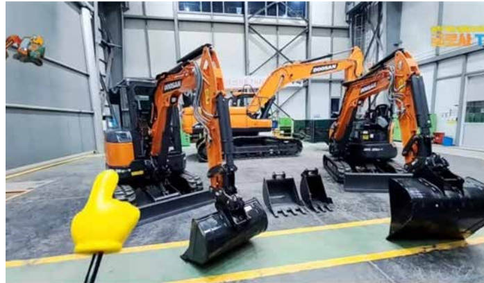
▲ 현대두산인프라코어가 온라인 방송을 통해 고객과의 소통을 강화하고 있다. 사진은 현대두산인프라코어의 유튜브 채널 '굴로사TV' 라이브 방송 모습.

현대두산인프라코어는 적극적인 온라인 마케팅을 통해 고객들의 장비에 대한 피드백을 신기종 출시 시 적극 반영함으로써, 지난해 국내시장에서 역대 최대 실적(6,200억원)을 달성한 바 있다.