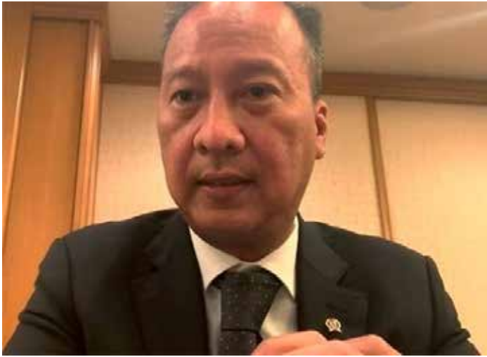
▲[온라인 회견을 하고 있는 아구스 장관=10일]

아구스 구미왕 인도네시아 산업부 장관은 10~11일, 일본을 방문해 정부 관계자와 자동차업계 등 재계 관계자와 회담을 가졌다. 인도네시아에 대한 일본 자동차업계의 투자 유치와 인도네시아의 자동차 수출을 확대해 나가겠다는 의지가 엿보였다. 아구스 장관은 10일, 온라인 기자회견을 통해 아시스, 경단련, 일본무연진흥기구, 미쓰비시(三菱)자동차 대표와 회담했다고 밝혔다. 일련의 회담에서 아구스 장관은 인도네시아가 고용창출을 제정, 투자환경을 정비한 것을 강조