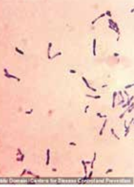
▲코로나19보다 전파력 강한 디프테리아 팬데믹... “항생제 내성 탕”

급성 호흡기 질환인 디프테리아를 일으키는 세균이 다양한 항생제에 내성을 갖는 사례가 급증하면서 세계적인 위협이 될 가능성이 있다는 우려 섞인 연구 결과가 나왔다.