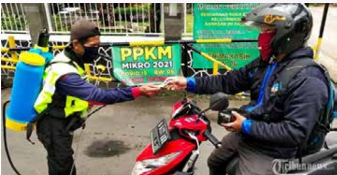
▲(사진=Tribun Jabar/Gani Kurniawan)

인도네시아 정부는 소규모 지역단위 사회활동제한조치(PPKM Mikro)를 오는 3월 22일까지 연장한다고 공식 발표했다.