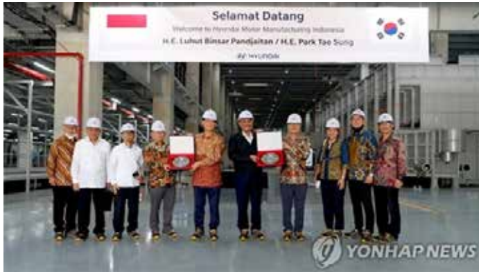
▲2020년 11월 6일, 인도네시아의 현대자동차 완성차 공장 건설 공사가 60% 진행된 가운데 루훗 뽀자이만 해양투자조정 장관이 6일 현장을 방문해 기념 촬영하고 있다.

우리나라 제조산업의 기술력을 가늠할 수 있는 지표도 나왔다. 미국 경제전문 통신사 블룸버그가 ‘2021 혁신지수(Bloomberg Innovation Index)’를 산정한 결과, 한국을 전세계에서 가장 혁신적인 나라로 꼽았습니다. 블룸버그 혁신지수는 연구개발(R&D) 비용, 첨단 기술기업들의 집중도, 생산능력 등에 가중치를 두어 국가별로 점수를 매긴다. 한국은 이번에 90.49점(100점 만점)을 받아 1위에 이름을 올렸다. 우리나라와 2위인 싱가포르, 7위인 이스라엘을 제외한 10