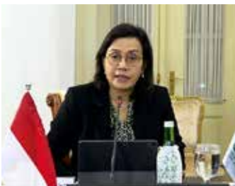
스리 물리아니 재무장관은 2월까지 올해 예산(Anggaran

Pendapatan Dan Belanja Negara, APBN) 총액 2,750조 루피아의 9.7%에 해당하는 266조7천억 루피아를 집행하였고, 이는 11.7% 증가한 금액이라고 밝혔다. 중앙정부 지출이 10.9% 증가한 169조7천억 루피아이고, 지방정부 지출이 12.2% 증가한 97조 루피아이며, 이