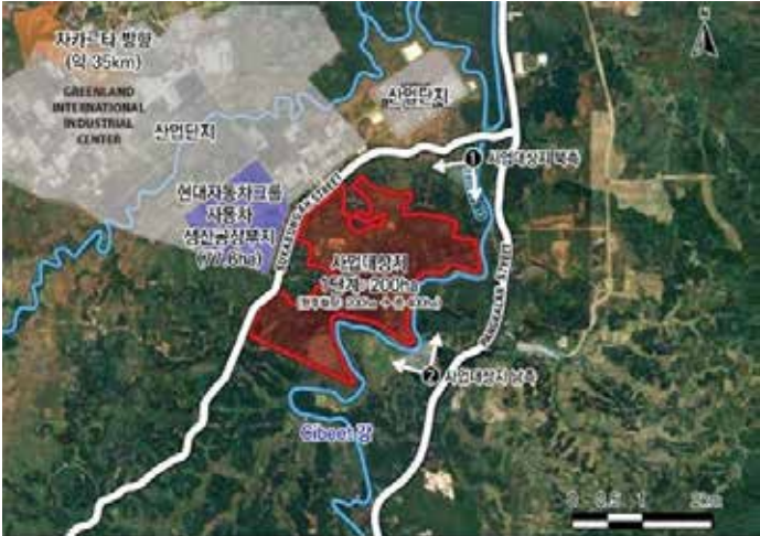
▲ 한국토지주택공사(LH)가 지난해 12월 18일 현대엔지니어링과 컨소시엄을 구성해 인도네시아 현지법인과 '인도네시아 버카시 복합산업단지 개발 업무협약' 을 체결했다고 밝혔다. 사진은 인도네시아 버카시 복합산업단지 위치도. 2020.12.21

한국토지주택공사(LH)는 2월 25일 서울 영등포구 한국 해외인프라도시개발지원공사(KIND) 사옥에서 KT[030200], KIND와 '인도네시아 서부자바주 버카시 산업단지 데이터센터 사업 공동추진에 대한 양해각서(MOU)' 를 체결했다고 밝혔다. 연합뉴스 보도에 따르면 버카시 산업단지는 LH가 작년 12월부터 현지 사업주, 현대엔지니어링과 공동으로 추진하는 해외 산업으로, 산업과 주거 기능이 결합된 복합산업도