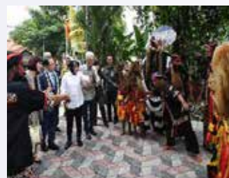
1939년 설립된 이 조선소에는 1천300여명이 근무하며 군함과 상선을 만들고 있다.

오 시장은 26일 인도네시아 최대 규모 국영 조선소인 'PT PAL'을 방문해 해양플랜트 해체기술 교류와 조선기자재 업체 진출방안 등을 논의했다.