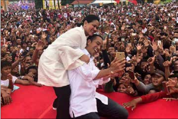
▲ 조코 위도도 인도네시아 대통령이 2019년 3월 24일 인도네시아 반푼주 세량에서 지지자들에게 둘러싸여 있다.

내달 17일 치러지는 인도네시아 차기 대통령 선거가 조코 위도도(일명 조코위) 현 대통령의 재선을 지지하는 서민과 정권교체를 원하는 엘리트 계층의 대결 구도로 전개되는 양상이다. 29일 인도네시아 자카르타 소재 싱크탱크인 전략국제연구소(CSIS)에 따르면 이달 15일부터 22일 사이 전국 34개 주 남녀 1천960명을 상대로 여론조사를 한 결과 응답자의 51.4%가 조코위 대통령의 재선을 지지하는 것으로 나타났다. 야권 대선후보인 프라보워 수비안토 대인도네시아운동당(그린드라당) 총재와 러닝메이트인 산디아가 우노 전 자카르타 부지사를 지지한다는 응답은 33.3%에 그쳤다. 눈길을 끄는 대목은 응답자의 교육 수준이나 직업군에 따라 선호하는 후보가 확연히 갈리는 현상이 나타났다는 점이다. CSIS는 홈페이지에 게재한 보고서 통해 초·중·고교 졸업자의 경우 응답자의 57.3%가 조코위 대통령을 지지했으며, 프라보워 후보에게 표를 던지겠다는