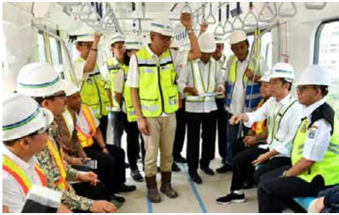
▲ 조코 위도도 대통령이 자카르타 지하철(MRT)을 돌아보고 있다.