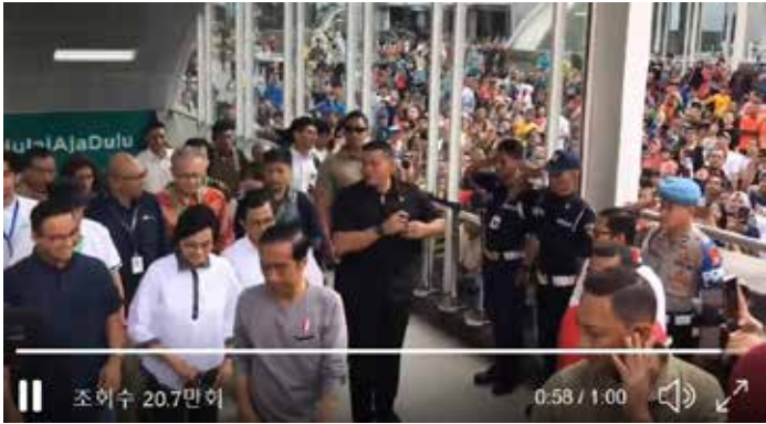
▲ 조코 위도도 대통령, 스리 물야니 재무장관, 아니스 바스웨단 자카르타 주지사 등이 24일 자카르타 MRT 개통식을 마치고 시승을 한 후 역사를 나오고 있다.

세계 최악 수준의 차량정체로 악명 높은 인도네시아의 수도 자카르타가 지하철과 경전철을 잇따라 개통해 교통지옥이란 오명을 벗을 수 있을지 주목된다.