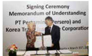
▲ 한국무역보험공사는 한국기업의 인도네시아 사업 수주를 지원하기 위해 15일 인도네시아 자카르타에서 국영 석유회사 페르타미나와 업무협약을 체결했다.

한국무역보험공사는 한국기업의 인도네시아 사업 수주를 지원하기 위해 지난 15일 인도네시아 자카르타에서 국영 석유회사 페르타미나와 업무협약을 체결했다고 17일 밝혔다.