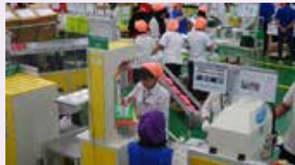
▲ 파크랜드 중부자바 주 즈빠라 공장 생산현장

아이르랑가 하르파르포 산업장관은 신발 수출액이 올해 65억 달러로 증가하고, 4년 후엔 100억 달러가 될 것으로 기대한다고 말했다.