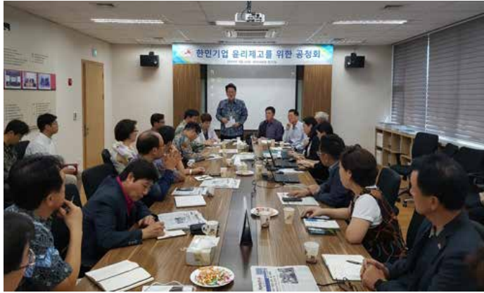
▲23일 인도네시아 자카르타 시내 재인도네시아 한인상공회의소(KOCHAM) 사무실에서 ‘한인기업 윤리제고를 위한 공청회’가 진행되고 있다.

로 몰아가는 분위기를 경계하면서도, 시대상의 변화에 걸맞게 기업윤리를 더욱 강화할 필요가 있다는 데는 의견