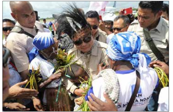
▲ 야권 대선후보인 프라보워 수비안토 대인도네시아운동당(그린드라당) 총재가 2019년 3월 26일 인도네시아 발리섬에서 연설하고 있다.

(33.7%)보다 14.5%포인트나 높았다. 응답자의 80% 이상은 누구에게 투표할지 이미 마음을 다진 상황이라고 말했다. 지지 후보를 밝히지 않은 응답자는 전체의 13.1%였으며, 이번 조사의 오차범위는 ±2.21%포인트다. 사회적 지위에 따라 지진 후보가 갈리는 이런 양상은 조코위 대통령과 프라보워 후보의 출신과도 연관이 있어 보인다. 중부 자바의 빈민가 출신으로 지수성가한 조코위 대통령은 친서민 정책과 소통형 리더십으로 2014년 대선에서 돌풍을 일으켜 군부나 기성 정치권 출신이 아닌 첫 대통령이 됐다. 32년간 인도네시아를 철권통치했던 수하르토 전 대통령의 사위였던 프라보워 후보는 군장성 출신으로 보수세력과 엘리트층의 강력한 지지를 받는다. 공식 선거운동이 시작된 작년 9월 이후 실시된 각종 여론조사에서 조코위 대통령은 꾸준한 우세를 보여 왔다. 하지만, 현지 정치권에선 최근 들어 프라보워 후보가 막판 뒤집기에 성공할 가능성이 크다는 이야기가 흘러나오고 있다. 인도네시아 여론조사기관 릿방 콤파스가 작년 10월 19.9%포인트에 달했던 조코위 대통령과 프라보워 후보의 지지율 격차가 현재 11.8%포인트까지 좁혀졌다는 여론조사 결과를 내놓으면서 조코위 대통령의 재선을 기정사실로 여겼던 분위기가 바뀌었기 때문이다. 때마침 인도네시아 반부패위원회(KPK)가 여당 연합 소속 정치지도자가 부패 혐의로 체포되고 유습 갈라 현 부통령의 동생과 조카가 프라보워 총재 진