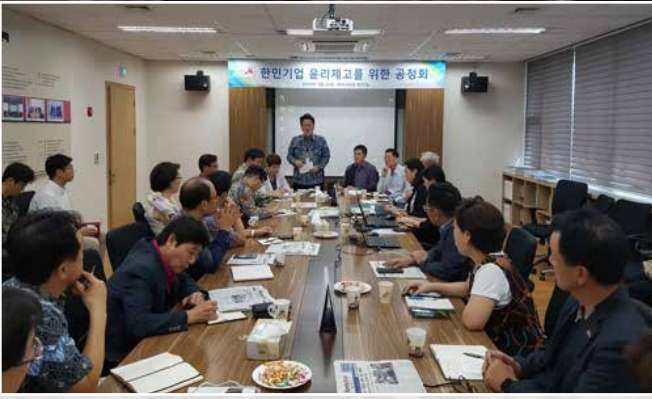
KOCHAM '한인기업 윤리제고를 위한 공청회' 가져