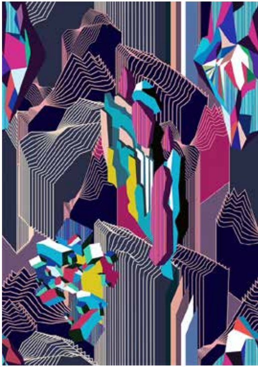
▲작품명 : Immersive Virtual Nature 강연주 작

해당 분야의 전문 교수들로 구성된 한국패션비즈니스학회와 창간 39주년을 맞은 전통의 전문매체인 한국섬유신문의 산학협력에 큰 관심 부탁드립니다.