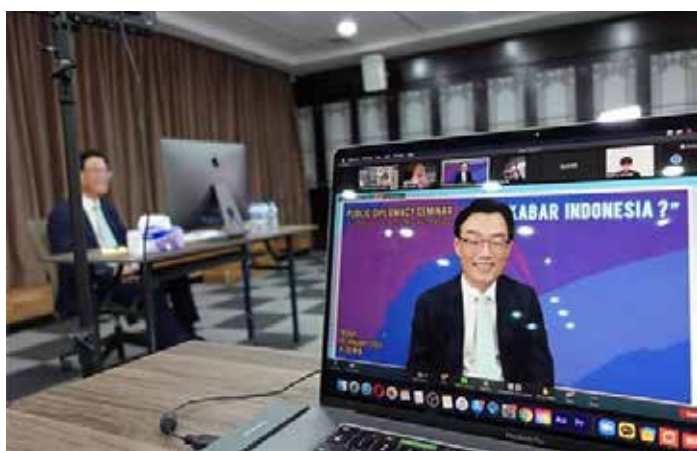
▲박태성 대사의 '아빠 까바르 인도네시아' 공공외교 토크쇼 개최

세종학당 수강생, 한류파워블로거, 코리아넷 명예기자단 등 130여명 참석자 참여 및 1,200여명 시청