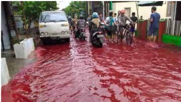
▲인도네시아 프칼롱안서 발생한 ‘진홍색 홍수’

지난 2월 1일 Yasonna Laoly 인도네시아 중부자바 프칼롱안이란 도시에서 ‘진홍색 홍수’가 발생해 관심이 쏠렸다. 7월 CNN인도네시아 등에 따르면 최근 프칼롱안시 쟁곳마을(Jenggot)에서 발생한 홍수 사진, 동영상 등이 트위터 등