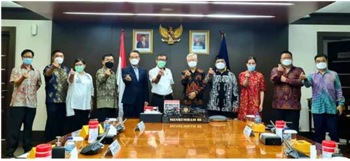
KOGA ... OMNIBUS 노동법 시행령에 따른 봉제산업 보호 법령 추가 요청 KOGA 안창섭 회장과 현지 봉제협회 대표가 참석한 가운데 OMNIBUS 노동법 시행령에 따른 봉제산업 보호 법령 추가를 요청하고 여러 사안에 관한 내용을 Yasonna Laoly 법무부장관에게 전달 했다.