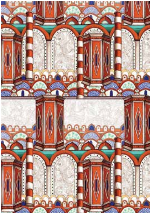
▲작품명 : Rhythmical 권인혜 작