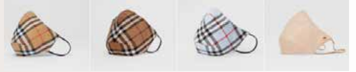
▲영국 패션 브랜드 버버리가 판매하는 '빈티지 체크 코튼 페이스 마스크'.

한편 마스크 판매 업체는 일명 '스타 마케팅'으로 프리미엄 마스크 판매에 공을 들이고 있다. 인기 연예인을 제품 모델로 앞세워 세