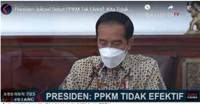
▲소코 위노노 내통령

자카르타주는 인도네시아 전 지역에서 코로나19 일일 확진사례가 가장 높게 발생하고 있다. 코로나19 긴급대책본부 자료에 따르면, 자카르타 하루 신규확진자가 1월29일 3,448건, 30일 3,491건, 31일 3,474건, 2월1일 3,614건, 2일 3,362건, 3일 3,567건으로 일주일 동안 매일 하루 3천