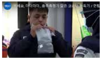
▲ 한 주민이 코로나 판독 위해 숨 붙여넣고 있다.

타 기차역과 자카르타의 빠사르 스펀역에 이 판독기를 시범 설치했고, 이후 공항에도 배치할 계획이다. 가자마다대 연구팀은 판독기를 1대당 6천800만 루피아(542만원)에 판매한다. 네덜란드의 한 의료기기 회사도 호흡을 이용하는 코로나 판독기 ‘스피로노즈’ (SpiroNose)를 출시했다.