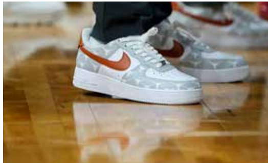
▲나이키 로고가 새겨진 나이키 운동화.

익은 6000만 유로(884억원)에 불과했다. 투자업계에서 아디다스는 악성 재고로 인해 실적 기대감이 없었다. 지난해 초 반유대주의 발언으로 물의를 빚은 래퍼로 알려진 예전 카니