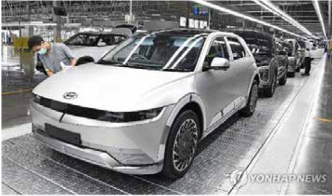
▲인도네시아 공장에서 생산 중인 아이오닉5 현대차 인도네시아 공장에서 전기차 ‘아이오닉 5’가 생산되고 있다.

II, 1974~1979년)에서 수하르토 정부는 국민생활 수준 향상과 개발 성과의 공정분배 및 고용기회의 확대를 추진했다. 이를 위해 외자 봉쇄 조치, 합작투자 및 직접 투자 규제에 대한 우선 분야 설정, 신용 규제를 통한 토착 자본을 보호한다는 정책을 펼쳤고, 이 기간 연평균 6.8%의 성장을 달성했다. 수하르토 정부는 원목 수출 규제정책을 진행함에 따라 코데코와 코린도는 현지에서 합판공장을 설립했다. 또 한국의 건설사가 현지에서 고속도로와 플랜트 건설을 주도하는 등 현지 진출이 러시를 이루었으며 주로 자바섬 이외의 지역에서 사업을 펼치면서 주로 지역사회 발전에 기여했다.