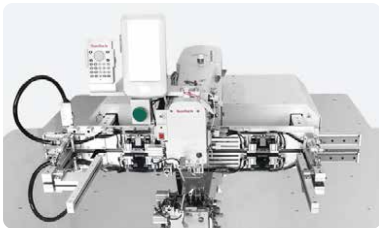
ST-6040HS-C3 3-컬러 컴퓨터 패턴 재봉기