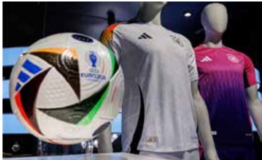
▲아디다스 로고가 새겨진 독일 축구공과 유니폼.

로만 7억5000만 유로(약 1조 165억원)의 매출을 올렸고, 3억 유로(약 4325억5000만원)의 순이익을 얻었다. 이 중 1억4000만 유로(약 2018억원)는 반유대주의口인종차별을 반대하는 자선단체에 기부하