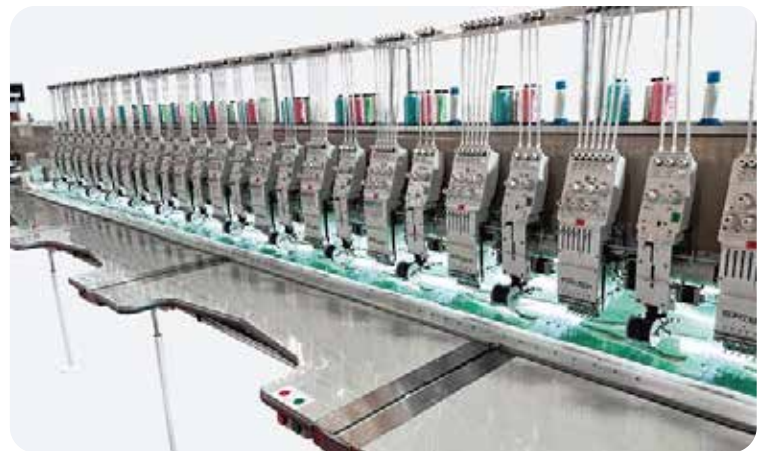
SFT-10616 코딩 자수기