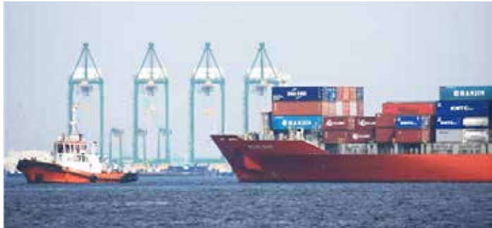
▲ 북부자카르타 탄중 빠리옥 자카르타국제컨테이너터미널(JICT)

인도네시아의 새로운 수입 제한 조치로 인해 공급망이 흔들리고 자동차 및 전자 산업의 외국인 투자자를 비롯한 기업들은 재고 부족과 일시적인 생산 중단을 경고하며 우려를 표하고 있다고 자카르타포스트가 지난 9일 전했다.