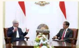
▲ 조코위 대통령과 팀 쿡 애플 CEO가 회담하고 있다.

그는 또 인도네시아 유명 관광지 발리에 새로운 애플 개발자 아카데미를 열 계획이라며 “