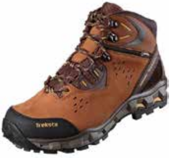
▲최근 신발산업진흥센터로부터 'KAS 공인 제품인증' 을 받은 트렉스타의 '익스트림 GTX' 제품

부산경제진흥원은 산하 신발산업진흥센터(신발센터)가 (주)트렉스타의 '익스트림 GTX' 제품에 국내 최초로 'KAS(한국제품인정기구)