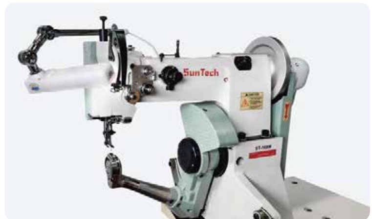
ST-168 Series 아리안스 재봉기