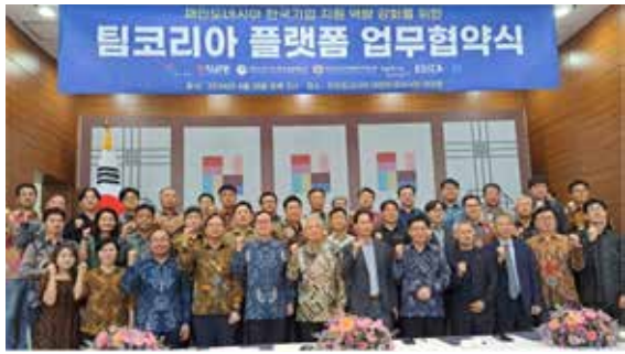
인니 진출 韓기업들 “당국에 한 목소리 내자”... '팀 코리아' 결성 재인니상의 중심으로 플랫폼 결성... 정보 공유 · 규제당국 공동 대응