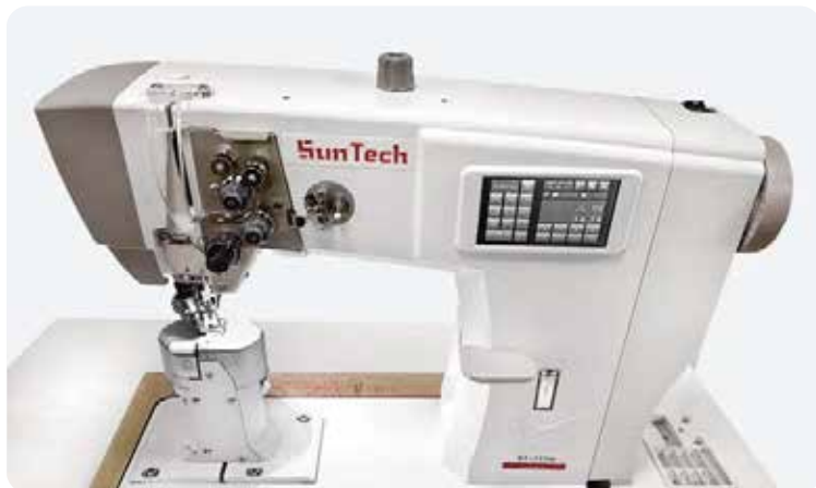
ST-666H(롤러 1본침), ST-777H(롤러 2본침) 자동 땀폭 조절이 가능한 롤러 포스트 재봉기