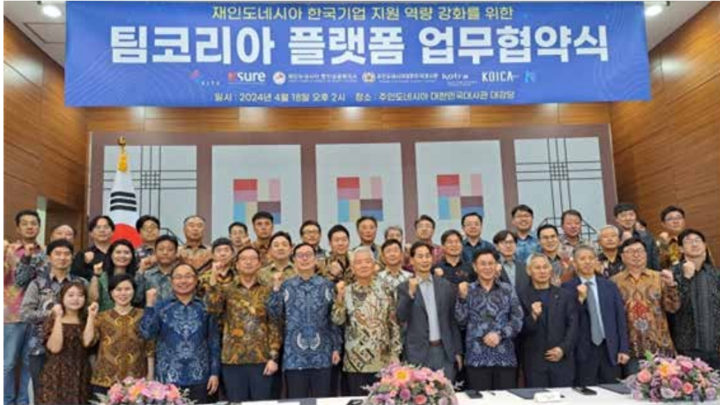
▲18일(현지시간) 인도네시아 자카르타 내 주인도네시아 한국 대사관에서 재인도네시아 한국 기업 지원 역량 강화를 위한 팀코리아 플랫폼 업무협약식 후 참가자들이 기념 촬영을 하고 있다. 2024.4.18.