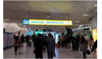
▲수카르노 하타 공항 제3터미널 외이주노동자(PM)들은 연간 그 3배 금액 상당의 물품들을 반입할 수 있게 됐다. 무역부 장관령 36/2023의 관련 조항에 따르면 항공편으로 인도네시아에 도착하는 여행객들은 랩톱이나 태블릿, 스마트폰을 다 합쳐 두 대씩만, 신발과 의류의 경우 각각 두 켤레, 다섯 벌만 반입이 가능했다. 하지만 이같은 규제는 16일 경제조정장관실의 회의 결과 발표와 함께 이제 더 이상 유효하지 않게 됐다. [자카르타포스트/자카르타경제신문]