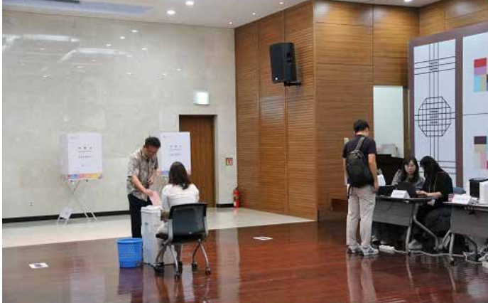
▲ 주인도네시아 대사관에서 실시된 재외선거

선거권자 197만명 중 14만7천명만 등록...실제 투표자는 9만2천명 우편·전자투표 도입 등 제도 개선 요구...비례대표 필요성도 주장